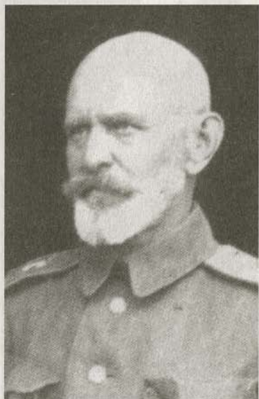
Генерал-лейтенант Д.М. фон Зигель