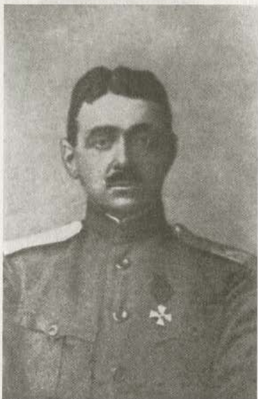
Генерал-лейтенант С.Г. Улагай