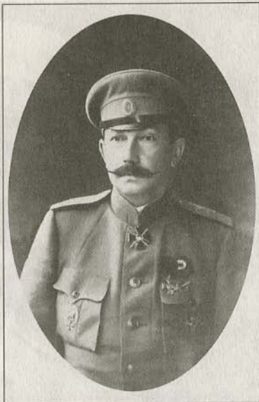
Генерал-лейтенант А.П. Богаевский