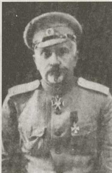
Генерал от инфантерии Ю.Н. Данилов