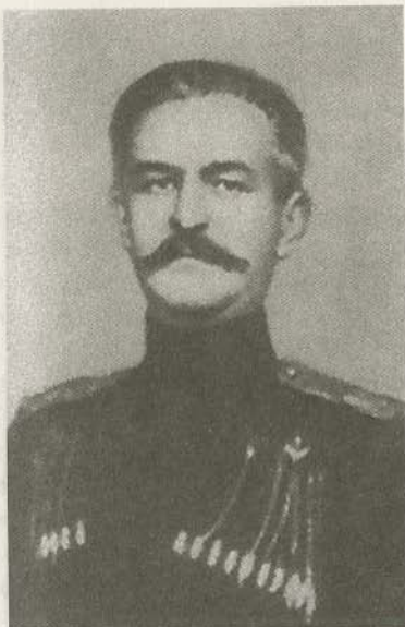
Генерал-майор В.М. Ткачев