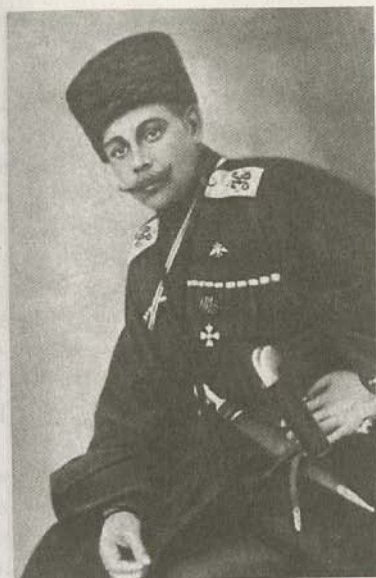
Генерал-майор Н.Г. Бабиев