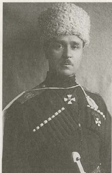
Генерал от кавалерии П.Н. Шатилов