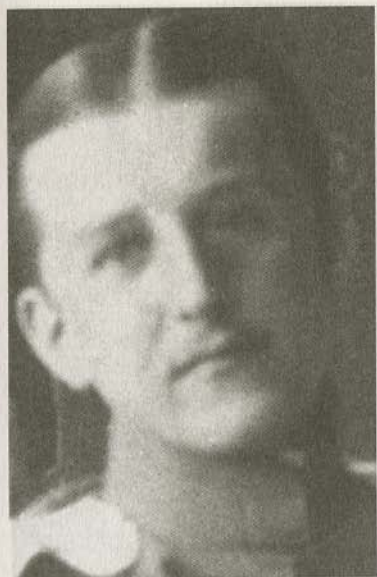
Генерал-лейтенант Я.А. Слащев