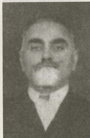
Генерал-майор Г.Б. Андгуладзе