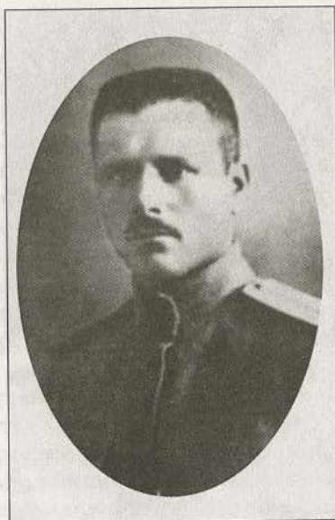
Полковник Ф.Д. Назаров