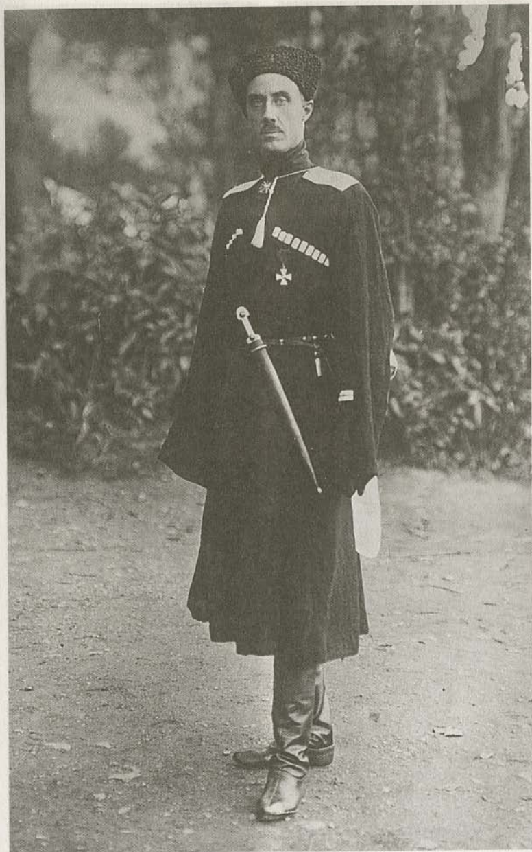
Барон П.Н. Врангель