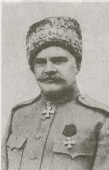
Генерал от кавалерии А.М. Драгомиров