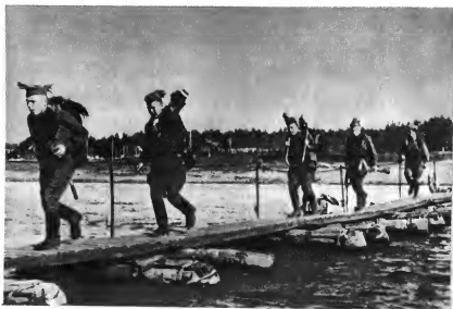
На тактических учениях. Пулеметный расчет 153-й стрелковой дивизии форсирует реку. 1940 г.