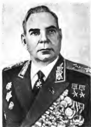
Н. И. Крылов Командующий войсками округа (1956—1958 гг.)