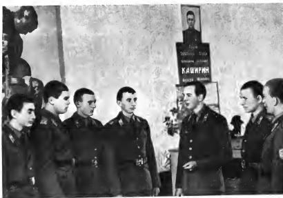
Герой Советского Союза А. И. Каширин навечно зачислен в списки части. Офицер В. Макаров рассказывает воинам о его подвигах. 1948 г.