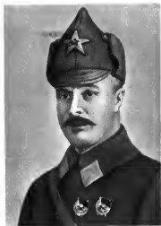
М. В. Фрунзе