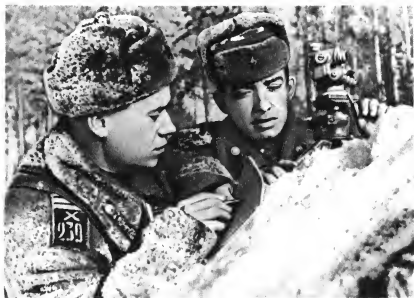
Артиллеристы на полевых занятиях