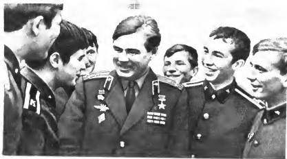
Летчик-космонавт полковник В. Г. Лазарев среди воинов-уральцев