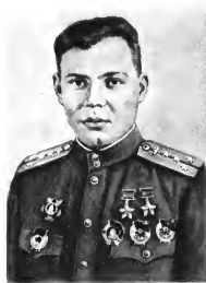
Г. А. Речкалов