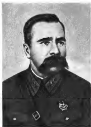
И. И. Гарькавый Командующий войсками округа (1935—1937 гг.)