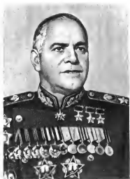
Г. К. Жуков Командующий войсками округа (1948—1953 гг.)