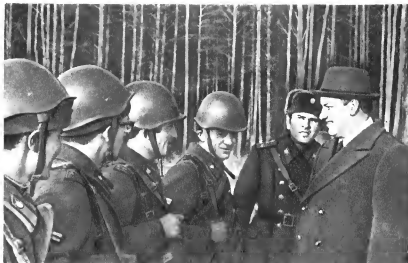
Член ЦК КПСС, первый секретарь Свердловского обкома партии Б. Н. Ельцин встретился с воинами на полевых занятиях. 1980 г.