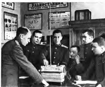
Курсанты изучают радиотехнику