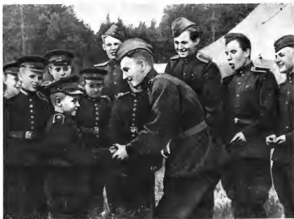
В гости к курсантам пришли суворовцы. 1951 г.