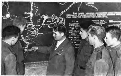
Герой Советского Союза Г. М. Дуб среди молодых воинов, 1976 г.