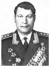
Н. К. Сильченко Командующий войсками округа (1970—1980 гг.)