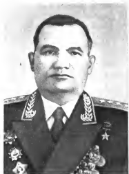
Я. Г. Крейзер Командующий войсками округа (1960—1961 гг.)