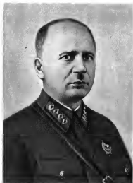
Г. П. Софронов Командующий войсками округа (1937—1938 гг.)