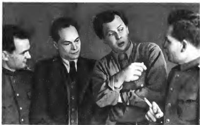
Поэт А. Т. Твардовский встретился с коллективом редакции окружной газеты «Красный боец». 1948 г.