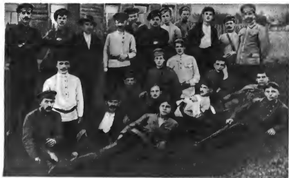
Добровольческая партийная дружина г. Котельнич Вятской губернии (ныне Кировская область). 1918 г.

Памятник С. Д. Павлову в городе Троицке Челябинской области