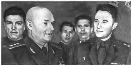
В 1958—1960 гг. войсками округа командовал генерал-полковник Д. Д. Лелюшенко (второй слева)