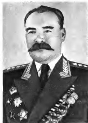
М. И. Казаков Командующий войсками округа (1953—1956 гг.)