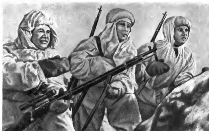
Действующая армия. Герой Советского Союза снайпер В. Г. Зайцев (первый слева) со своими учениками. 1942 г.