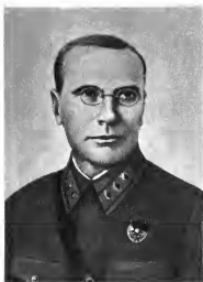
Я. П. Гайлит Командующий войсками округа (1937 г.)