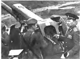
Участник войны генерал Н. Н. Науменко делится боевым опытом с молодыми артиллеристами. 1981 г.