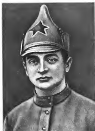
М. Н. Тухачевский