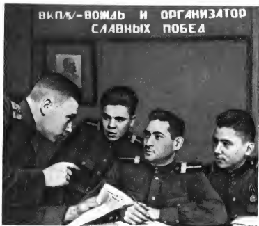
Накануне политических занятий, 1952 г.