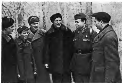
Делегация рабочих города Свердловска прибыла на Калининский фронт. 1942 г.