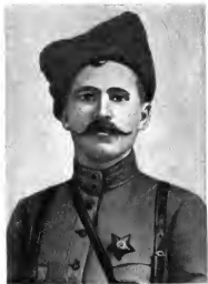
В. И. Чапаев