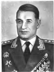
И. В. Тутаринов Командующий войсками округа (1961—1965 гг.)