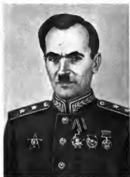
А. В. Катков Командующий войсками округа (1941—1945 гг.)