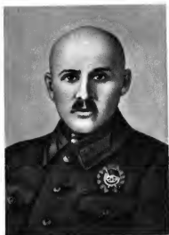
В. К. Блюхер