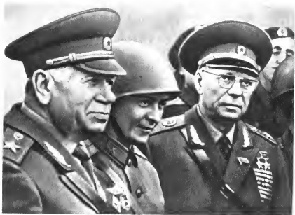
Министр обороны СССР Маршал Советского Союза Д. Ф. Устинов и начальник Главного политического управления Советской Армии и Военно-Морского Флота генерал армии А. А. Епишев с курсантами Свердловского высшего военно-политического танко-артиллерийского училища. 1979 г.