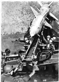
Стартовый расчет за работой