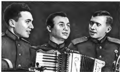
Победители окружного смотра художественной самодеятельности. 1957 г.