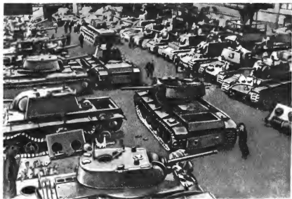
Урал — фронту: сборка танков; пошив обмундирования