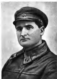
В. Д. Соколовский Начальник штаба округа (1935—1938 гг.)