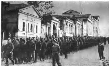
Уральцы отправляются на фронт. 1941 г.