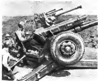
Артиллеристы на полевых занятиях