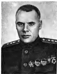
Ф. И. Кузнецов Командующий войсками округа (1945—1948 гг.)