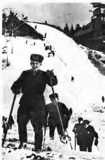
Бойцы на лыжной подготовке в районе Уктусских гор