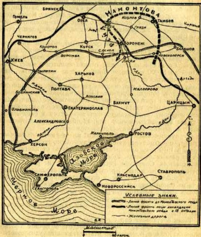
Схема № 1.

рых могла бы дезорганизовать все боевое снабжение Красной армии и общее руководство борьбой, а для Советского правительства создать крайне опасную политическую обстановку.