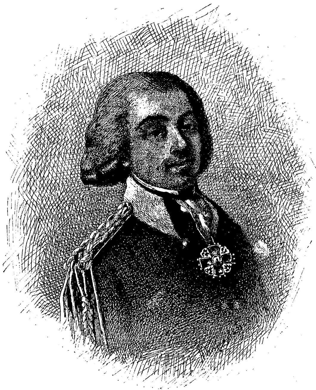
АНТОНЪ МИХАИЛОВИЧЪ РАЧИНСКІЙ

ПЕРВЫЙ КОМАНДИРЪ И ШЕФЪ ГВАРДІИ ЕГЕРСКАГО БАТАЛІОНА.