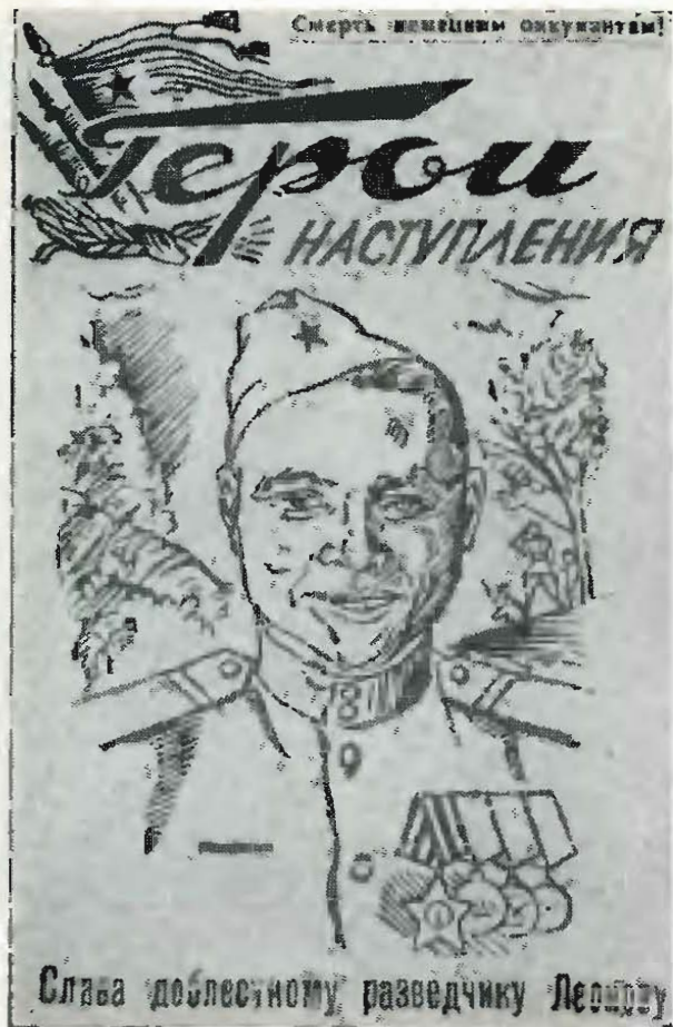
Листовка, посвященная разведчику Георгию Леонову.