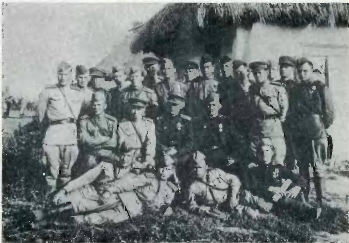
Группа политработников 214-й стрелковой дивизии. Пересечная. 23 августа 1943 г.