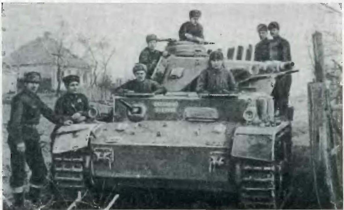
Вперед! — Харьков! Август 1943 г.