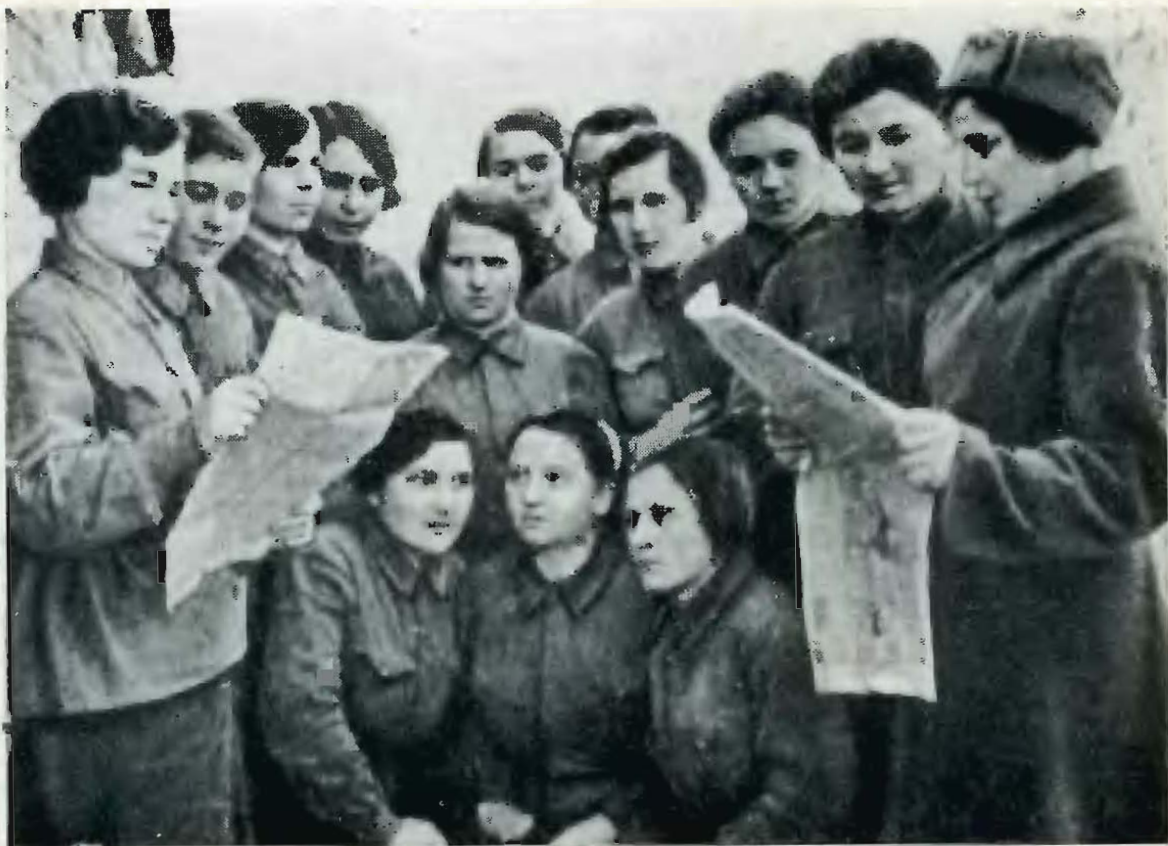
Они — из 67-го Отдельного полка связи.