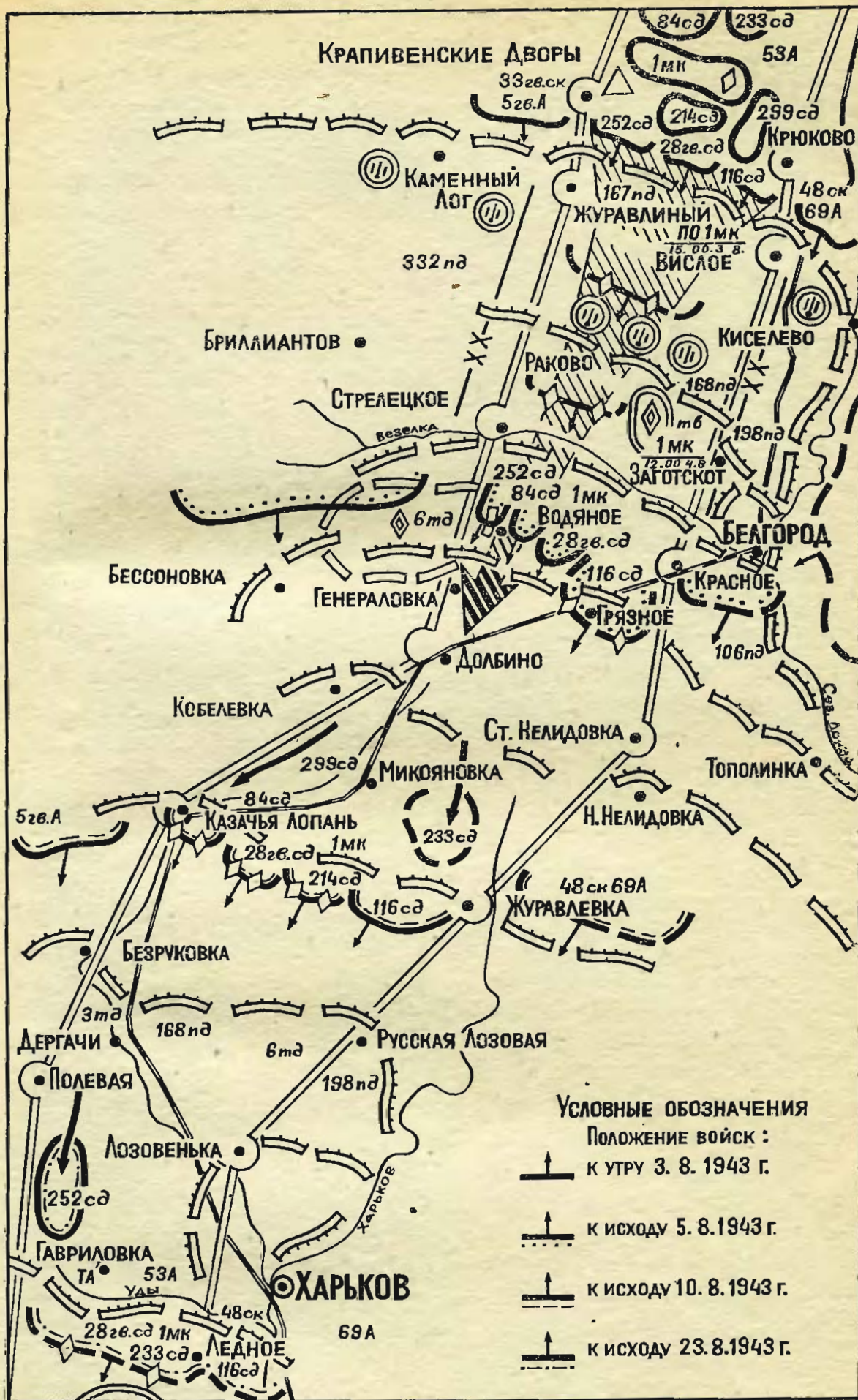
Общий ход боевых действий 53-й армии. Август 1943 г.