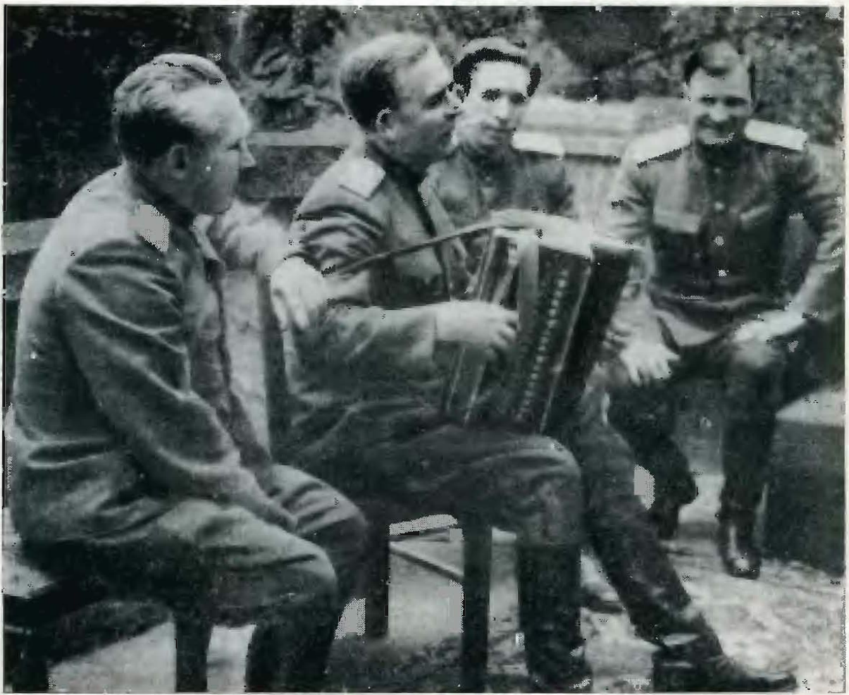
В короткие минуты отдыха.