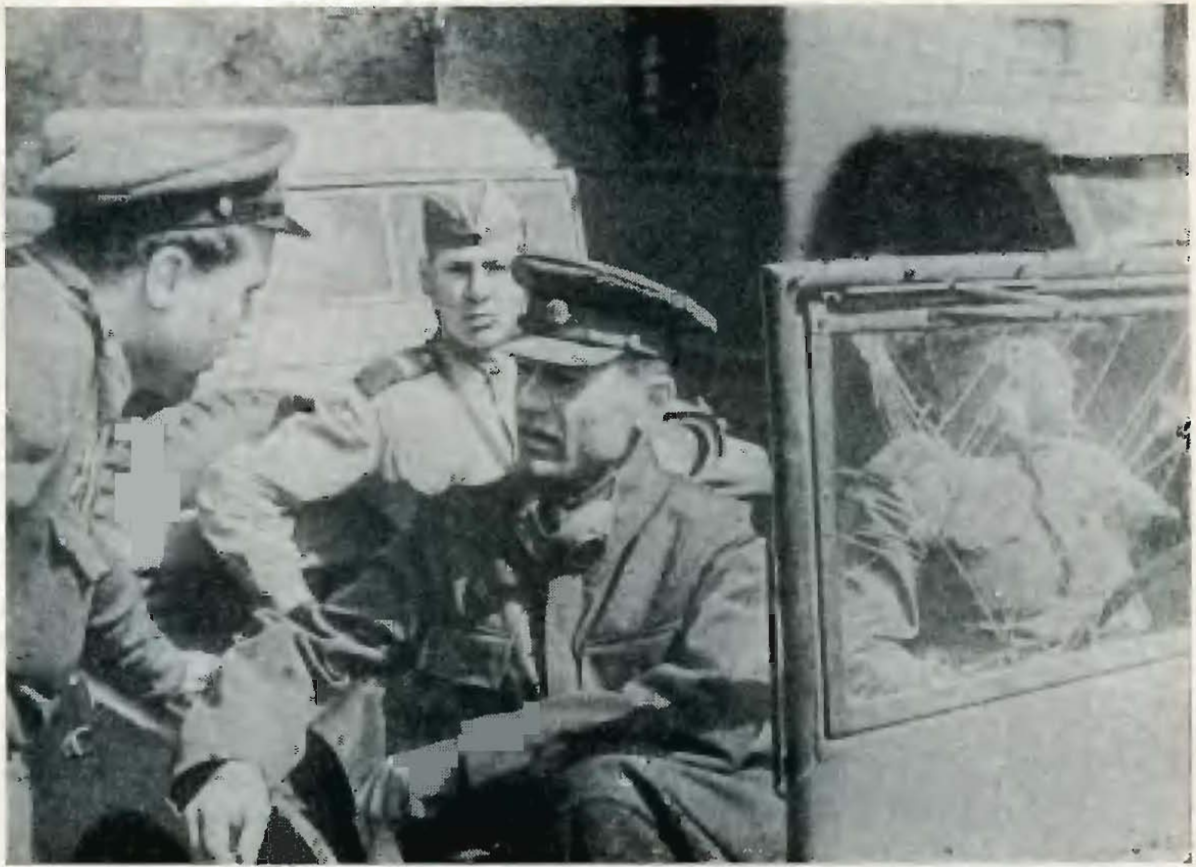
Член Военного совета Степного фронта генерал-майор И. С. Грушецкий в одной из частей, ведущей бои на подступах к Харькову. Август 1943 г.