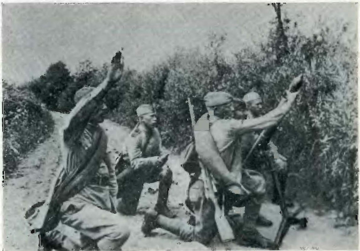
Минометный расчет в районе Полевой. Август 1943 г.