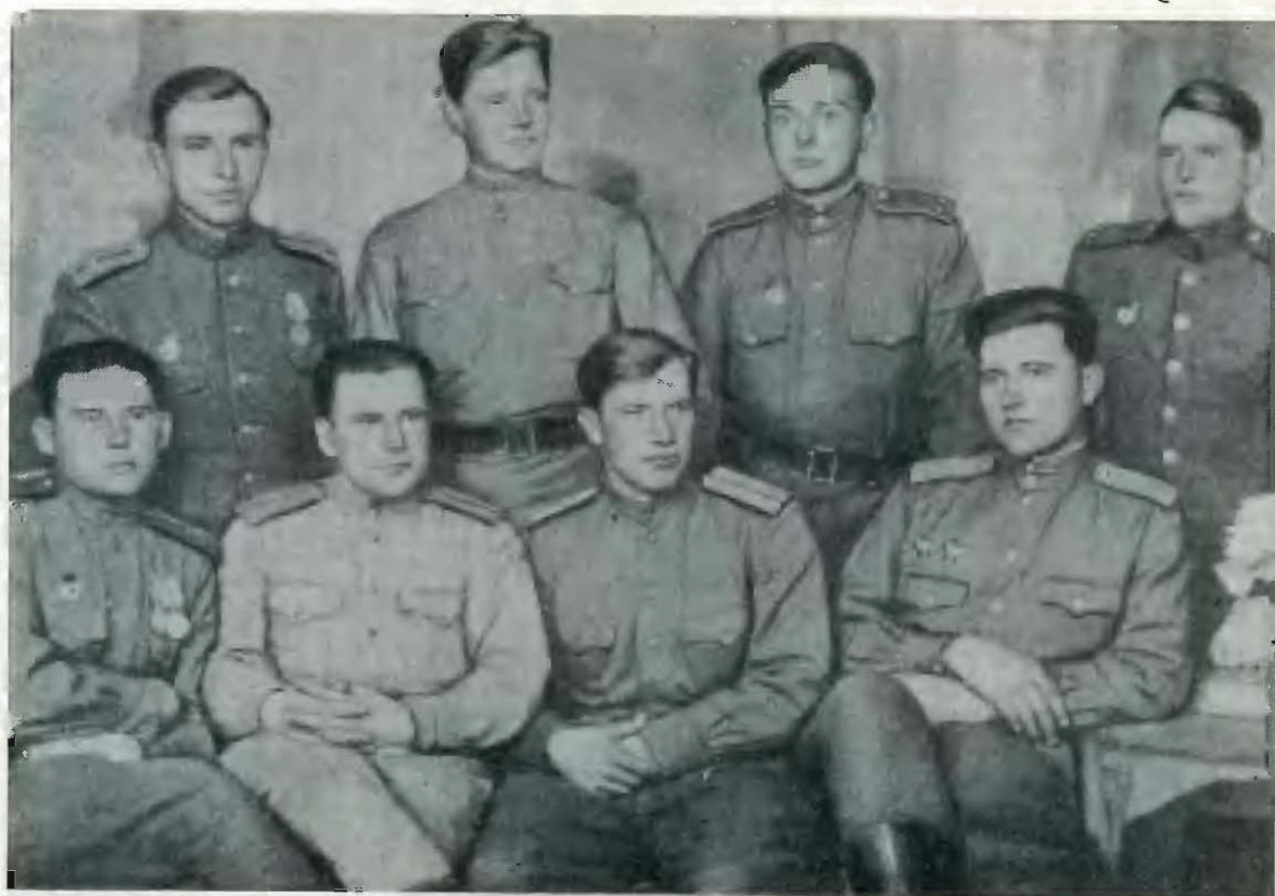
Группа командиров взводов и рот 1-го батальона 89-го гвардейского стрелкового полка 28-й гвардейской Харьковской стрелковой дивизии.