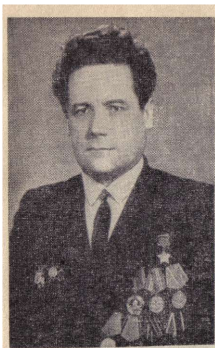
Герой Советского Союза Н. Огородников.