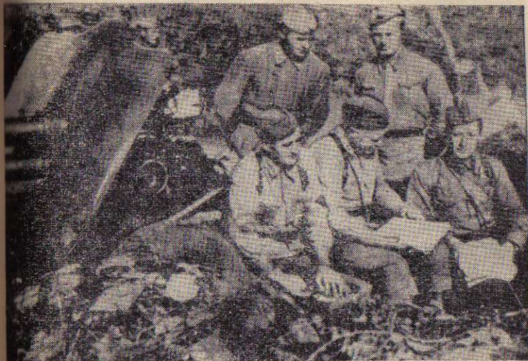
Заседание партийного бюро в перерыве между боями.

Преследование гитлеровцев продолжалось до восемнадцатого августа. Дивизия с боями прошла более 130 километров, преодолела 13 промежуточных оборонительных рубежей. Было освобождено 70 населенных пунктов Орловской области, в том числе город Кромы, железнодо-