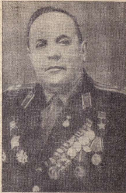
Герой Советского Союза Г. С. Томиловский.