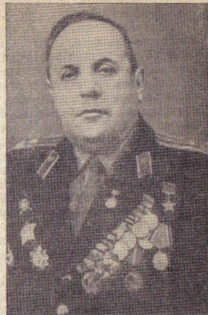
Герой Советского Союза Г. С. Томиловский.

После взятия высоты полк ускорил продвижение на Большую Ивановку, вышел к высоте 200,4, глубоко вклинившись в оборону противника. Командир дивизии, исполь-