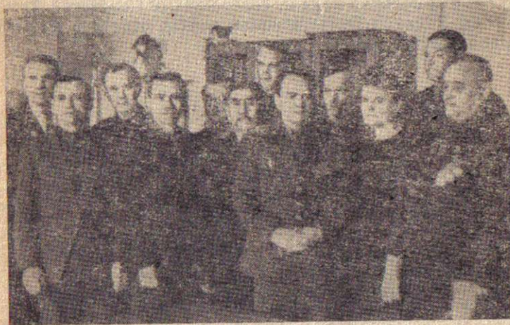
Ветераны 8-й стрелковой дивизии в редакции газеты семипалатинской областной газеты «Иртыш».

Воины казахстанской дивизии, преодолевая упорное сопротивление гитлеровцев, до 30 апреля с боями прошли путь от реки Стругурня до берегов Кысуца, освободили много населенных пунктов.