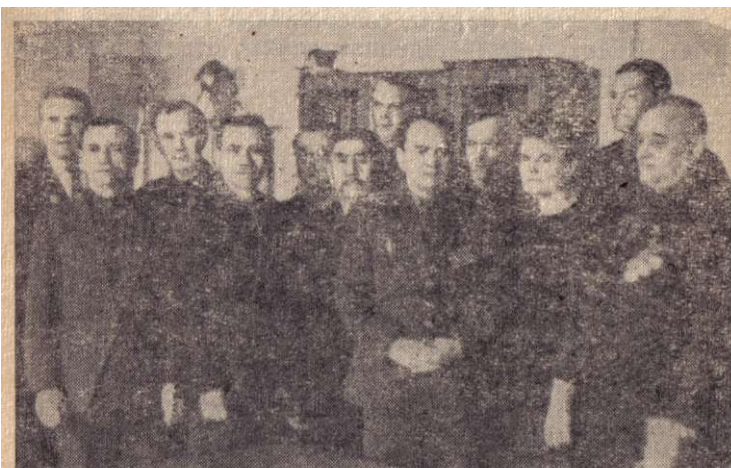
Ветераны 8-й стрелковой дивизии в редакции газеты семипалатинской областной газеты «Иртыш».