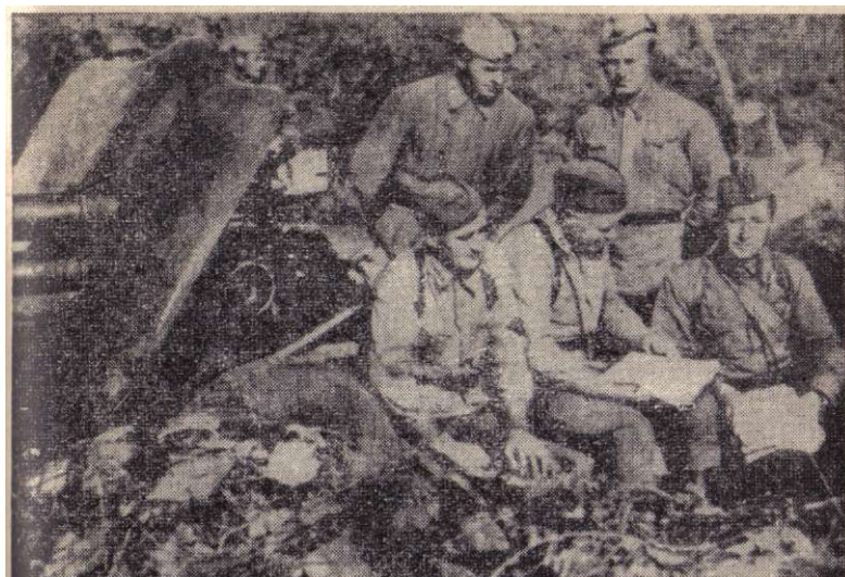
Заседание партийного бюро в перерыве между боями.