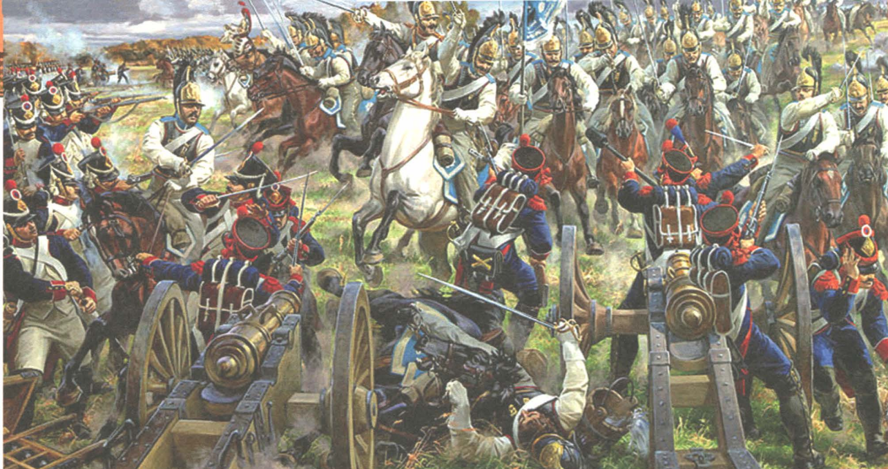
Атака русских кирасиров. Художник Е.А. Корнеев. (Студия военных художников им. М.Б. Грекова).

бою на холмах позади флешей. Французская конница попыталась продолжить наступление, но витебчане вместе с другими полками отразили атаку. Не удалось пройти дальше и наполеоновской пехоте. Французы были остановлены.