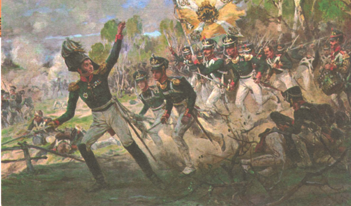
Подвиг генерала Н.Н.Раевского. Художник Н.С.Самокиш. Начало XX в.

деревни Салтановка, а сам решил переправиться через Днепр ниже по течению. Раевский должен был атаковать войска маршала Даву, который обустроил под Салтановкой сильную оборонительную позицию. Французы находились в выгодном положении — их защищал глубокий овраг с ручьём на дне, густой лес, непроходимые болота и сама река Днепр. К Салтановке можно было пройти только по плотинам и мостам, которые во многих местах были сломаны или завалены деревьями. К тому же у французского командующего Даву было 26 тысяч солдат, а у русского Раевского — только 15 тысяч.