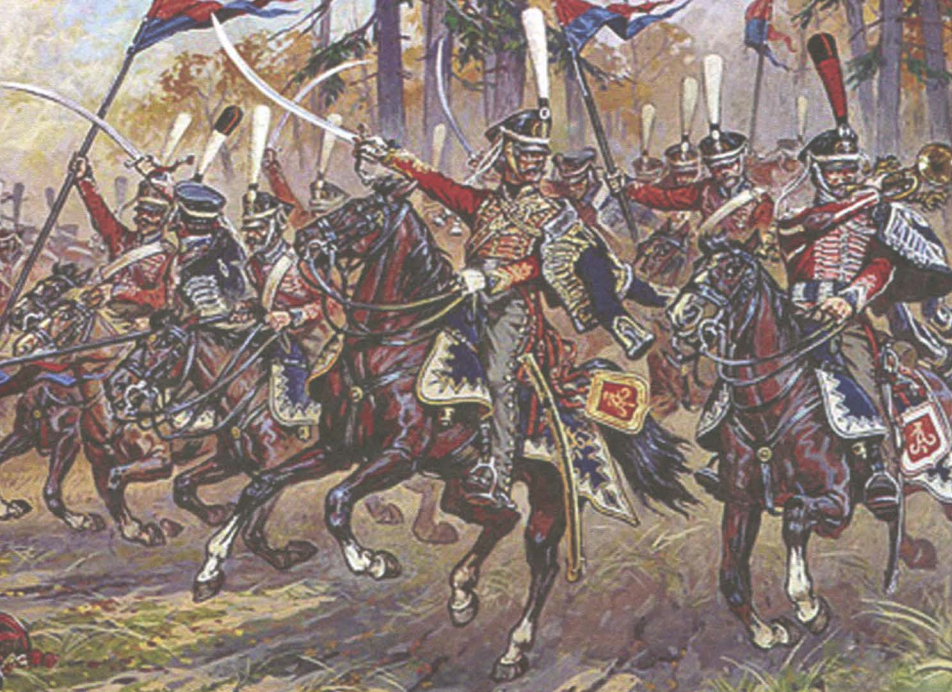
Атака русских гусар.

6 13-го егерского полка, которые, сломив сопротивление саксонцев, первыми ворвались в город с востока. Егеря — это сильные, прекрасно обученные солдаты, которые умели хорошо стрелять, колоть штыками. Они как современные спецназовцы и десантники, выполняли самые трудные операции, всегда были там, где сложнее и тяжелее.