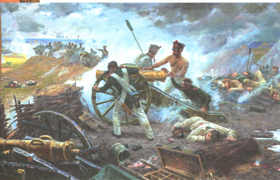
Подвиг артиллеристов батареи Раевского. Художник С.Н.Трошин (Студия военных художников им. М.Б.Грекова).