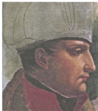
Наполеон Бонапарт. Художник Ж.-Л. Давид. XIX в.

Одновременно с армией Наполеона через реку Буг переправились войска Австрии, которая была союзником Франции против России. Именно австрийцы двинулись навстречу 3-й русской армии Тормасова. Города Брест, Пинск и Кобрин были заняты врагом.