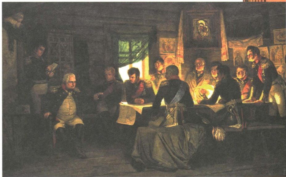
Военный совет в Филях. Художник А.Д. Кившенко. XIX в.

Французы ликовали, но совершенно напрасно. Совсем скоро Кутузов, получив подкрепления, погнал захватчиков с родной земли.