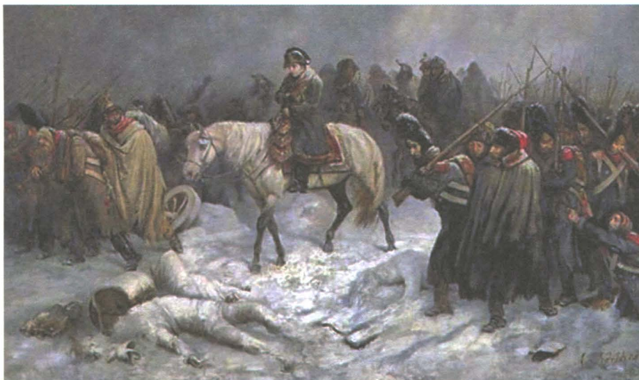
Отступление Наполеона из Москвы. Художник А.Нортерн. XIX в.

Вскоре Наполеон бросил армию на произвол судьбы и бежал во Францию. 26 декабря через реку Нёман в Восточную Пруссию переправились 1600 человек — последние жалкие остатки полчищ, вторгшихся в Россию всего полгода назад.