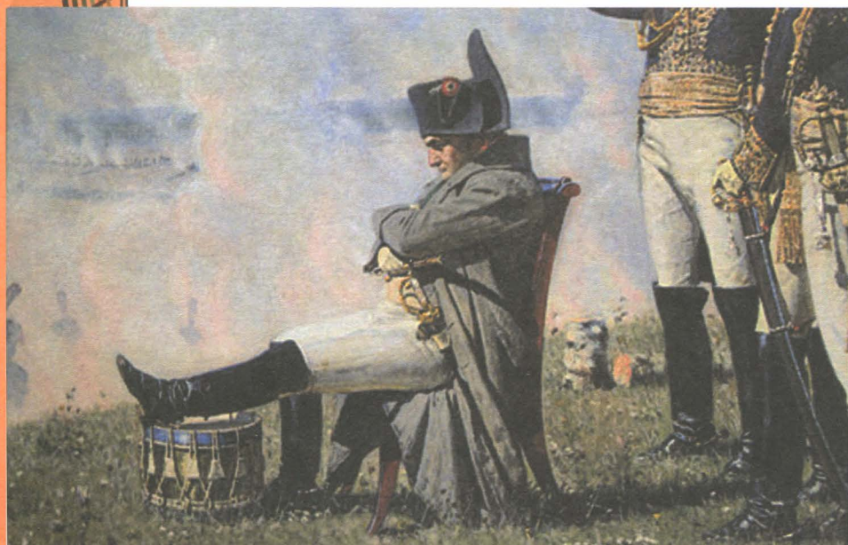
Бородино. Наполеон. Конец сражения. Художник В.В. Верещагин. XIX в.

Лишь во время третьей атаки после непрерывного полуторачасового боя французы, которых на этом участке сражения было значительно больше, смогли захватить батарею. Русские отошли, но новое наступление французской конницы было остановлено стремительной атакой русских кавалеристов.