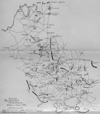
Схема Германской оккупации Февраль - Август 1941г.