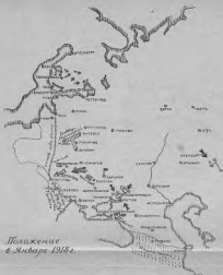
Положение в Кубане 1918 г.