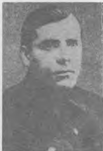
М. И. Золотухин