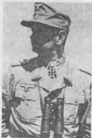
Генерал Губерт Ланц, командир 1-й горнострелковой дивизии «Эдельвейс»