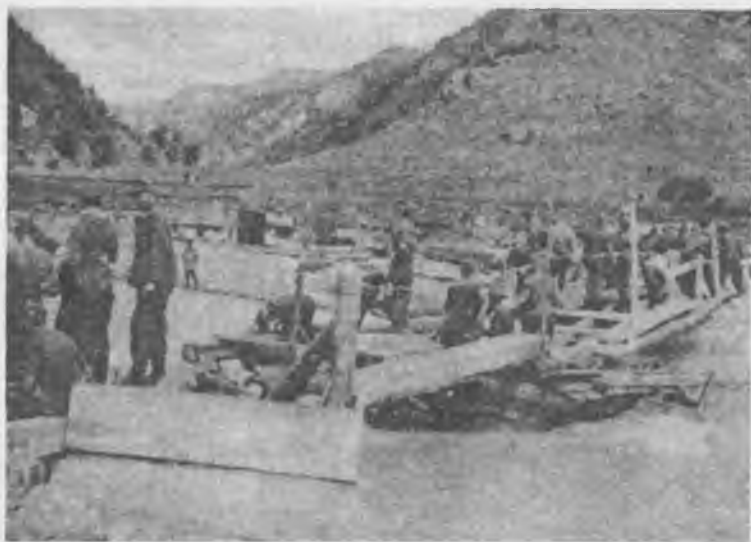
«Эдельвейсы» восстанавливают переправу через р. Кубань