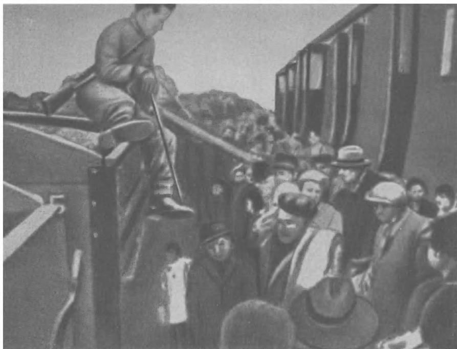
«Спецтранспорт» из Польши.