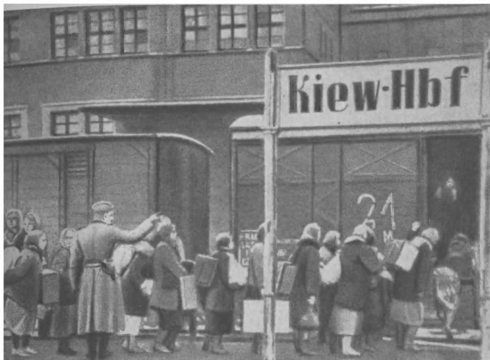
Угон населения на рабский труд в Германию. Киев, 1941 год.