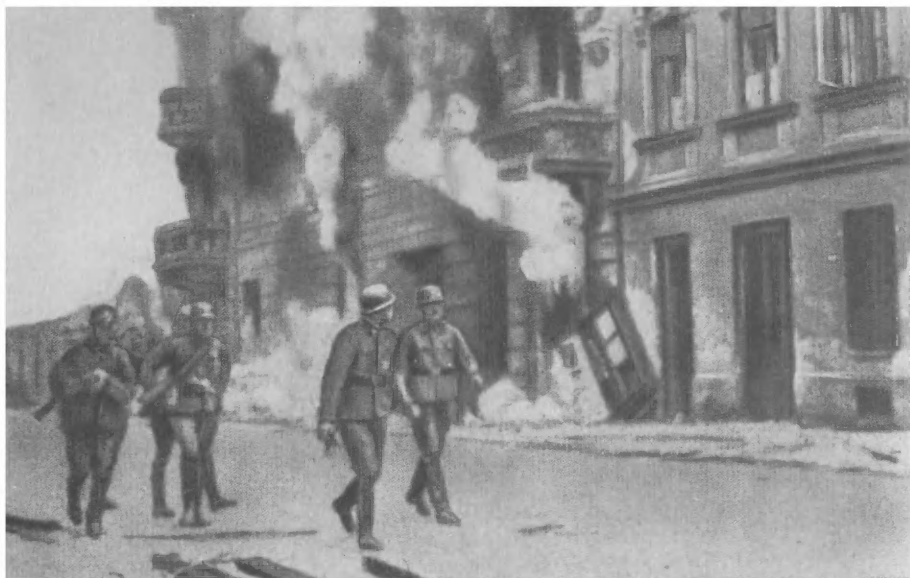
Уничтожение Варшавского гетто.

Гиммлер и представители промышленных концернов осматривают Освенцим.