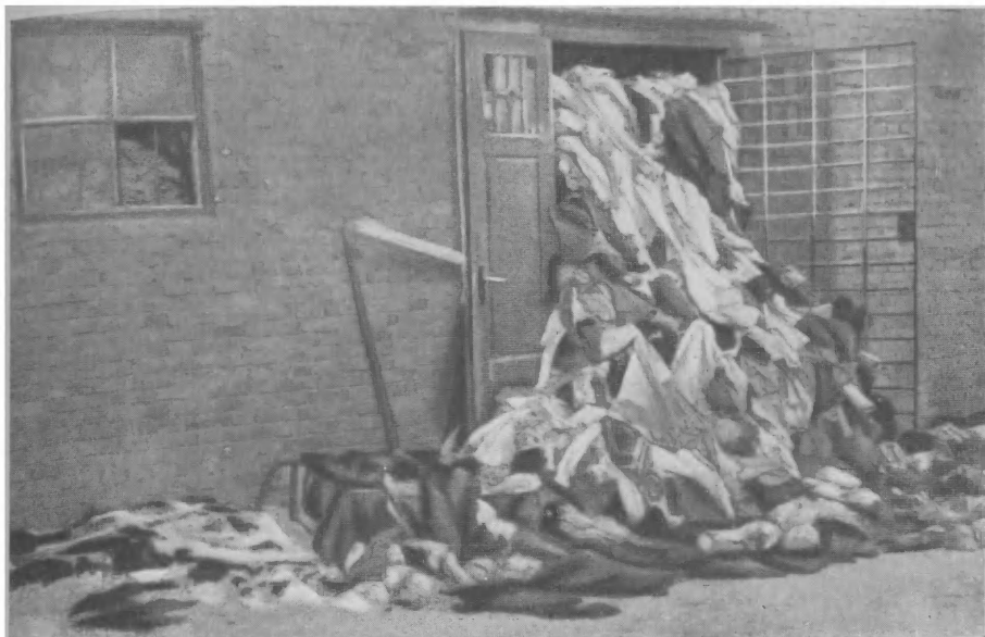
Один из многих складов с одеждой истребленных узников концлагеря Освенцим.