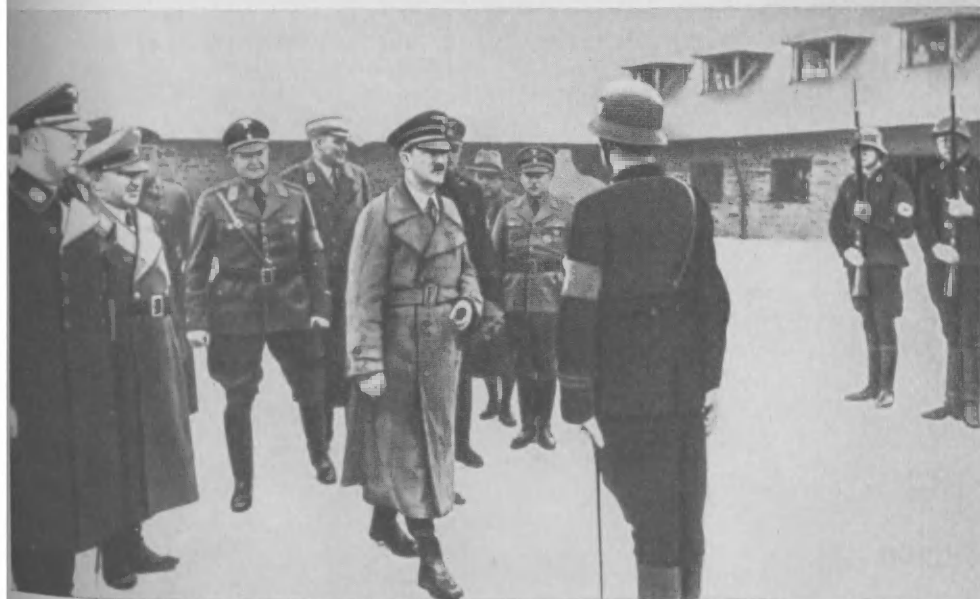
Посещение Гитлером и другими главарями рейха концлагеря Саксенхаузен.