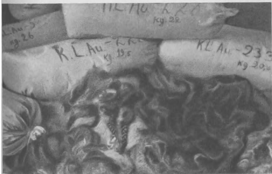
Волосы истребленных женщин, обнаруженные в концлагере Освенцим.