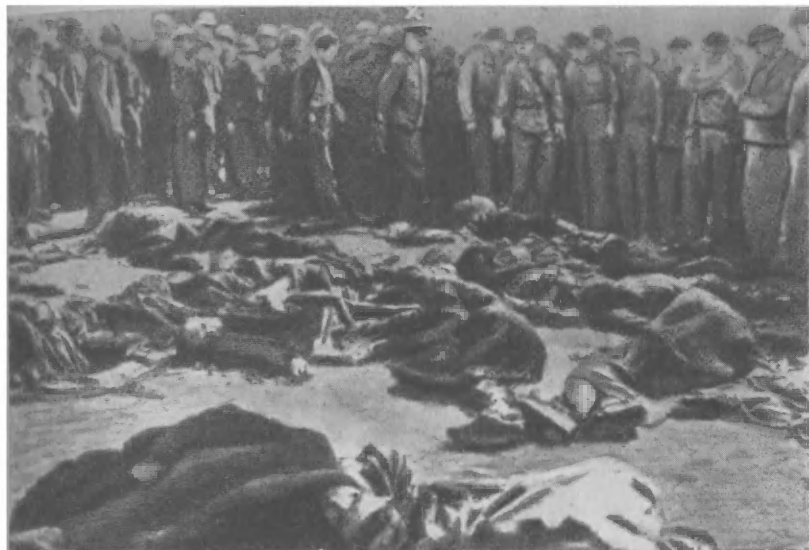
Генерал Дуайт Д. Эйзенхауэр осматривает концлагерь Берген-Бельзен.