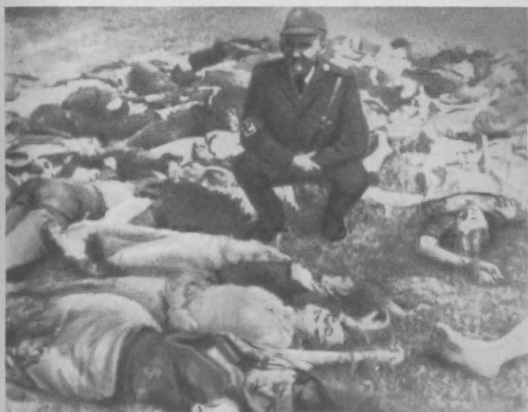
Нацистский террор в Югославии.