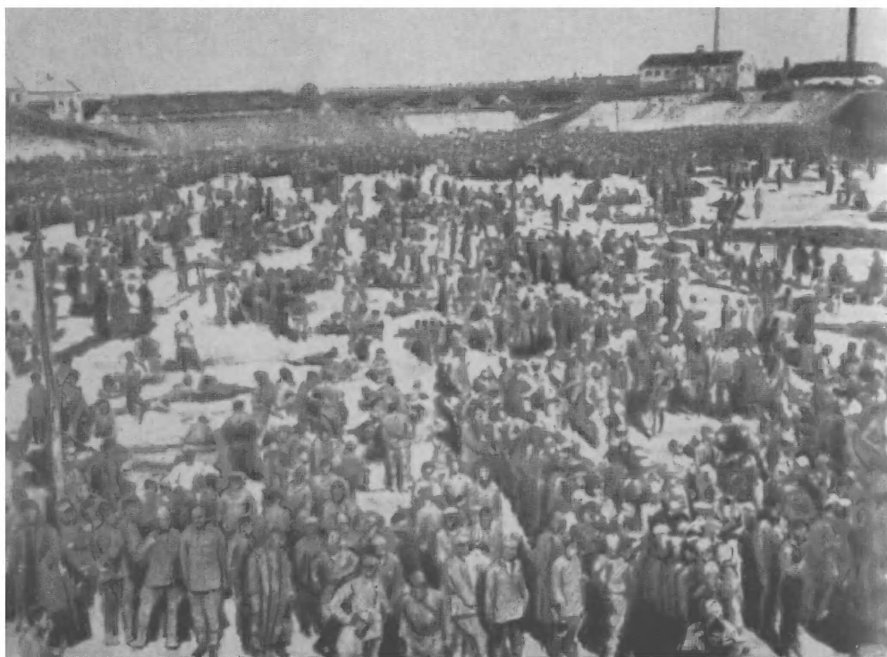
Гитлеровский лагерь для военнопленных возле города Умань. (Немецкий снимок от 14 августа 1941 г.) В этом лагере размещалось 50 тыс. советских военнопленных.