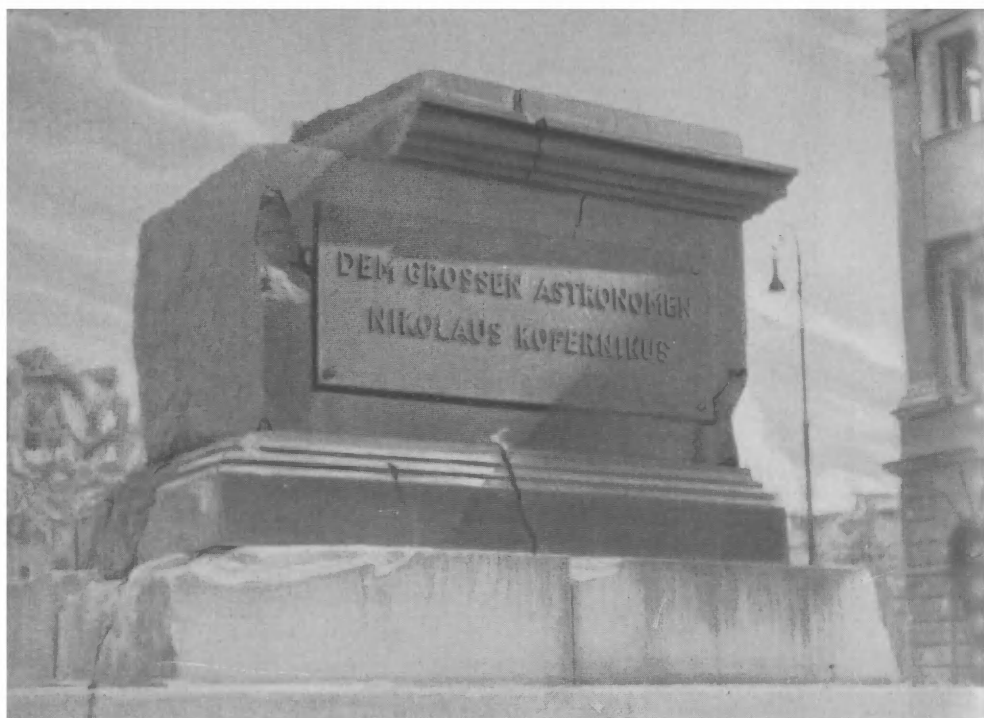
Памятник великому астроному Николаю Копернику в Варшаве, уничтоженный нацистскими вандалами.