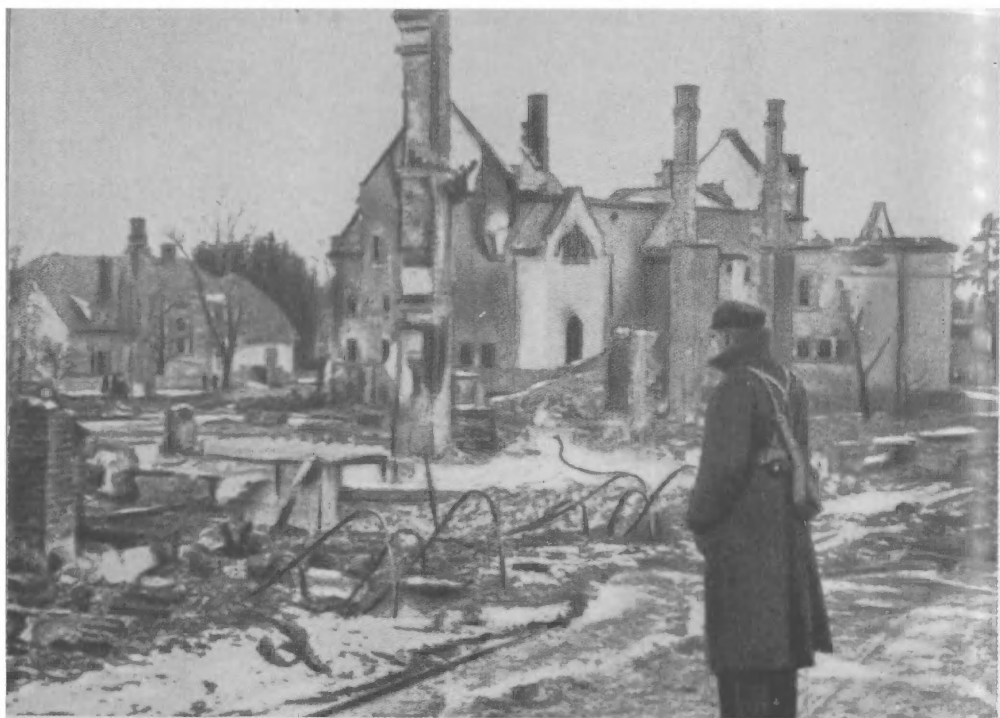
Норвежский город Эльверум, разрушенный фашистскими оккупантами 1 апреля 1940 г.