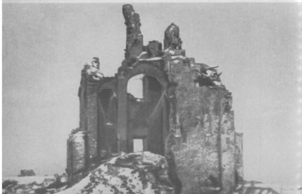
Разрушенный фашистами древнейший памятник — Храм Спаса Нередицы (Новгород).