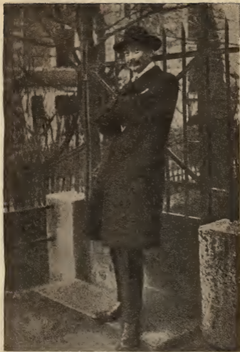
Ф. Э. ДЗЕРЖИНСКИЙ в Цюрихе, 1910 г.