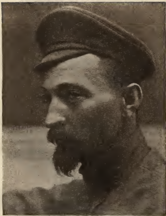
Ф. Э. ДЗЕРЖИНСКИЙ, 1922 г.