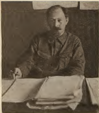
Ф. Э. ДЗЕРЖИНСКИЙ в своём рабочем кабинете, 1926 г. (Фото)