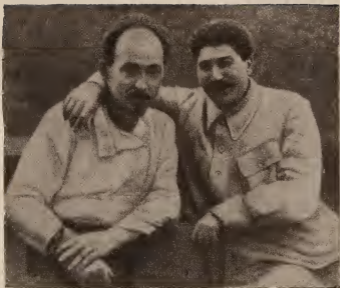
И. В. СТАЛИН и Ф. Э. ДЗЕРЖИНСКИЙ, 1925 г.