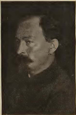
Ф. Э. ДЗЕРЖИНСКИЙ