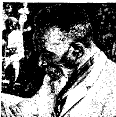
Дональд Сивале (1890—1983). Ветеран борьбы за освобождение Северной Родезии от колониального ига