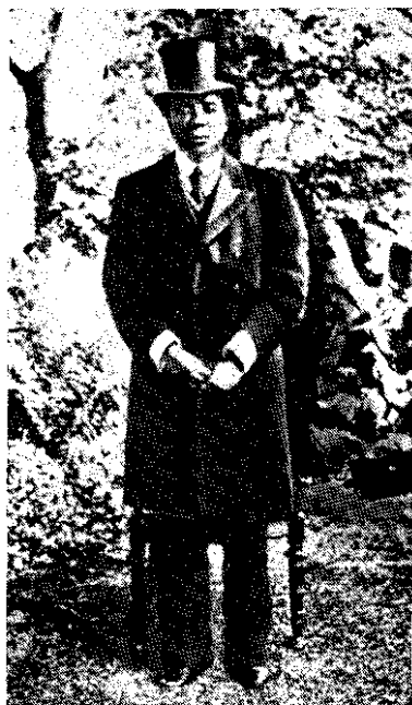
Правитель народа лози Леваника I (1842—1916). Провинция Баротселенд. Западная Замбия