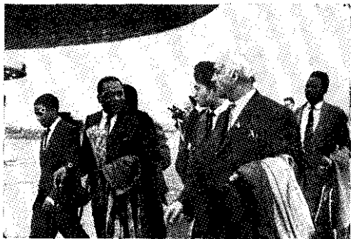
Встреча на аэродроме в Москве первой парламентской делегации Замбии (1967 г.)