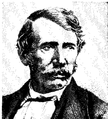
Давид Ливингстон (1813—1873), английский исследователь Африки, миссионер. Его именем назван город на юго-западе Замбии