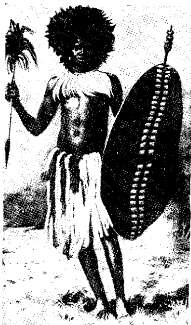
Воин из племени хамар. Британская Центральная Африка. 1850 г.