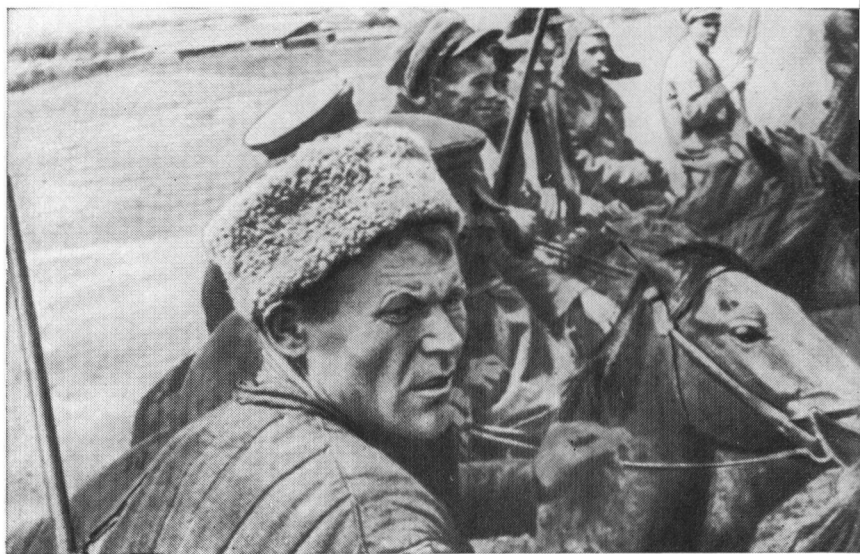
В отряд к С. М. Буденному.