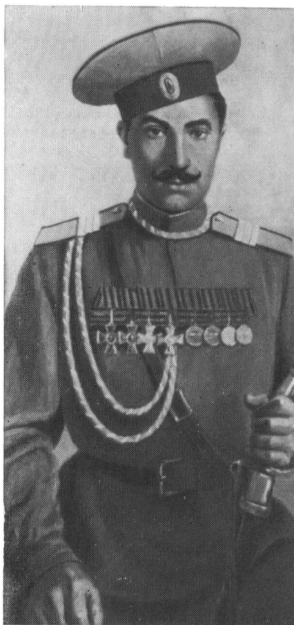
Старший унтер-офицер С. М. Буденный. 1915 г.