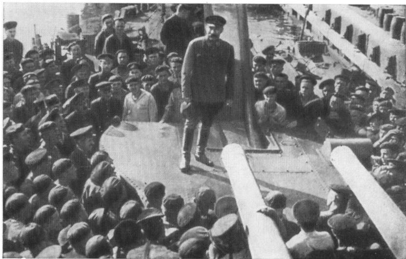
Командующий войсками Северо-Кавказского фронта маршал С. М. Буденный выступает на митинге перед моряками лидера «Ташкент», Июнь 1942 г.