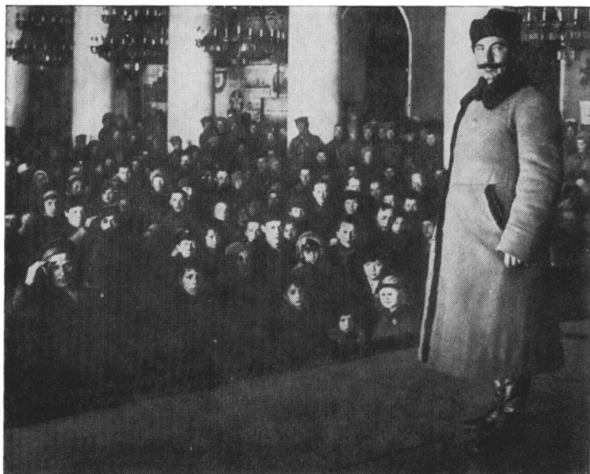
С. М. Буденный на встрече с делегатами VIII Всероссийского съезда Советов. Москва, 1920 г.