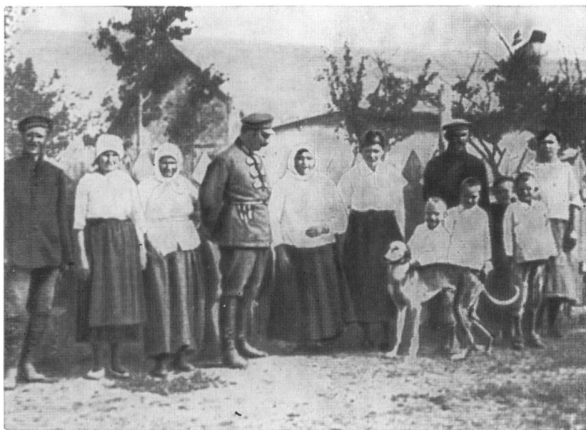
С. М. Буденный с матерью и родными. Станица Платовская, 1925 г.