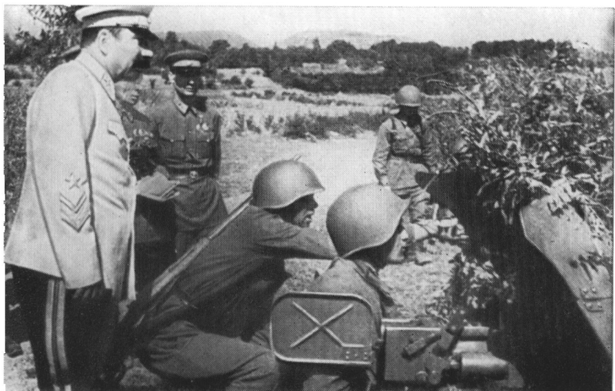
С. М. Буденный на тактических учениях. 1940 г.