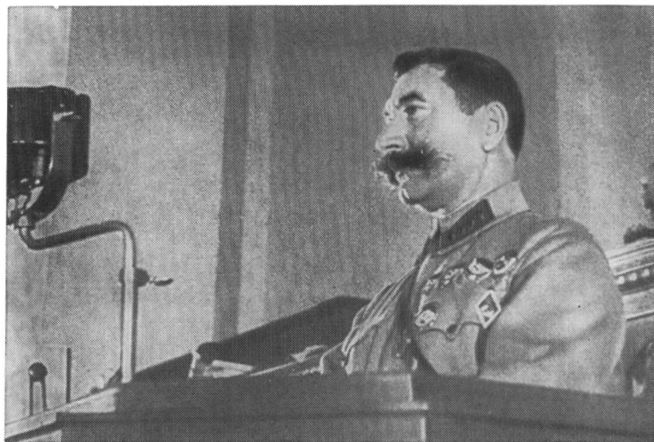
Выступление С. М. Буденного на VII Всесоюзном съезде Советов, 1935 г.