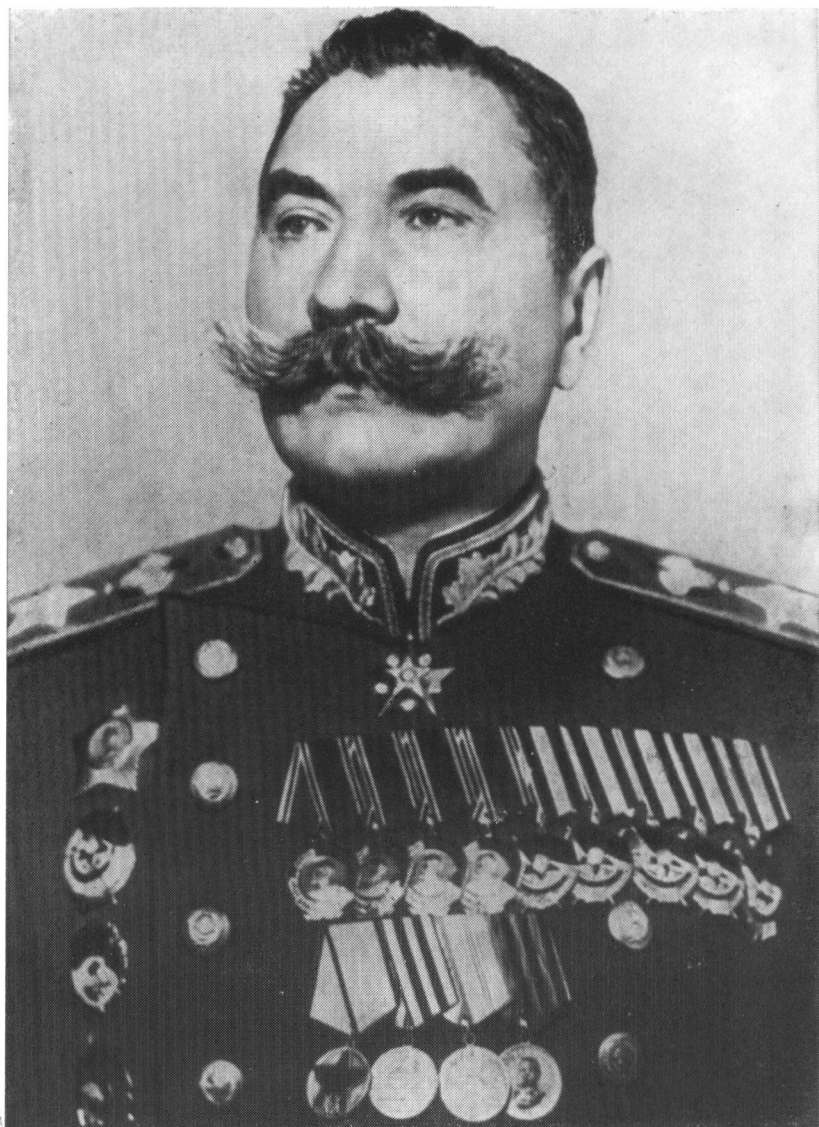
Маршал С. М. Буденный в День Победы. Москва, 1945 г.