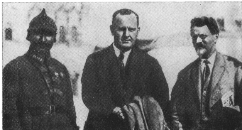
М. И. Калинин и С. М. Буденный с американским сенатором Джонсоном на Красной площади. 1923 г.