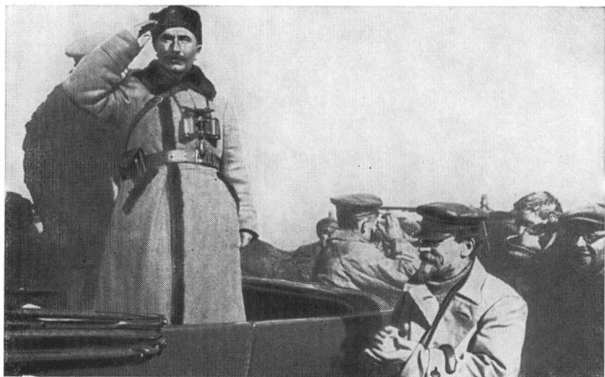
М. И. Калинин среди бойцов Первой Конной армии. Выступает С. М. Буденный. 1920 г.