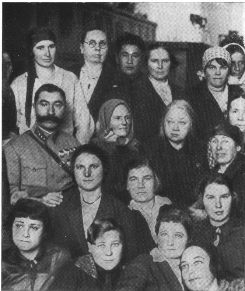
С. М. Буденный и Н. К. Крупская среди делегатов VII Всесоюзного съезда Советов. 1935 г.