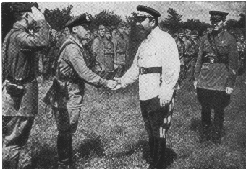
Встреча с бойцами и командирами перед отправкой на фронт. Крым, 1942 г.