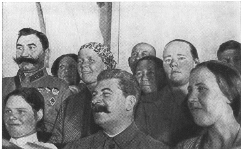
И. В. Сталин, С. М. Буденный и Мария Демченко в группе участниц II Всесоюзного съезда колхозников-ударников. Москва, 1935 г.