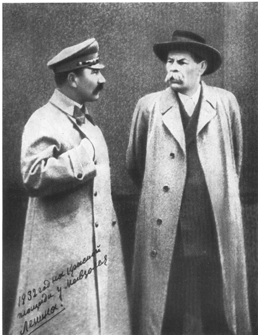
С. М. Буденный и А. М. Горький на Красной площади у Мавзолея В. И. Ленина. 1932 г.