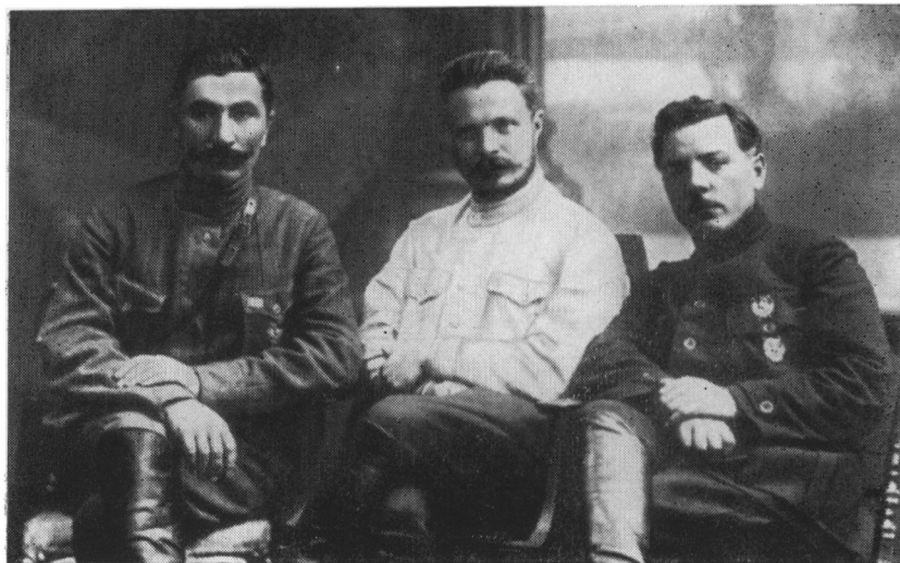
С. М. Буденный, М. В. Фрунзе, К. Е. Ворошилов на Южном фронте.