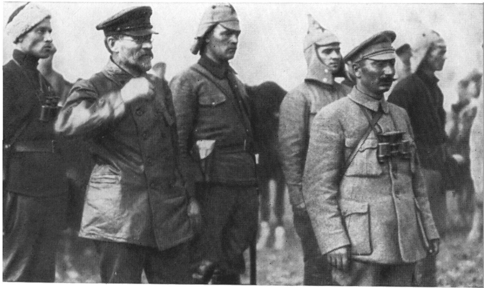
М. И. Калинин принимает парад частей Первой Конной армии. 1920 г.