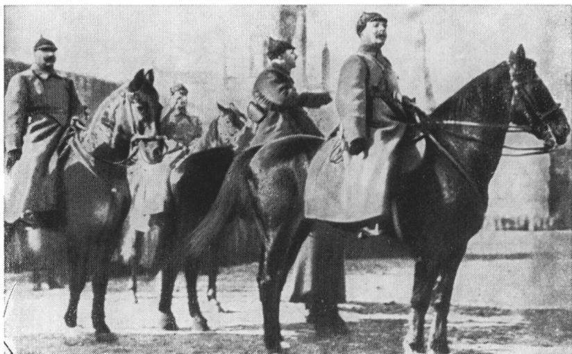
М. В. Фрунзе и С. М. Буденный на военном параде в честь Великого Октября. Москва, 1923 г.