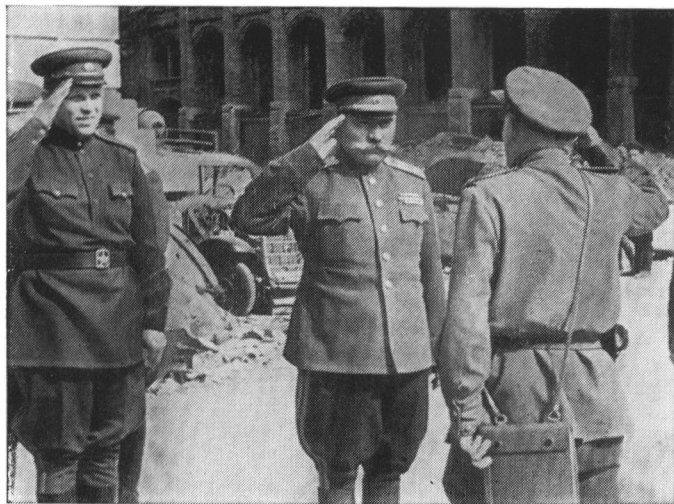
С. М. Буденный в поверженном Берлине. Май 1945 г.

В день 60-летия министра обороны СССР маршала Г. К. Жукова. Москва, 1956 г.