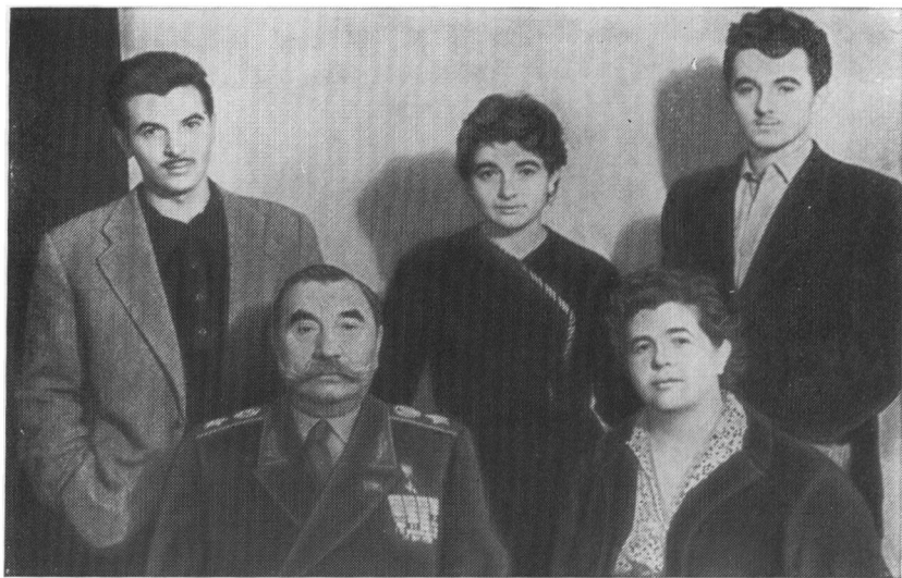
С. М. Буденный в кругу семьи.