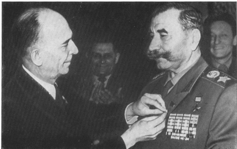
Заместитель председателя главного правления Общества польско-советской дружбы Мечислав Вонгровский поздравляет С. М. Буденного в день 80-летия, 25 апреля 1963 г.