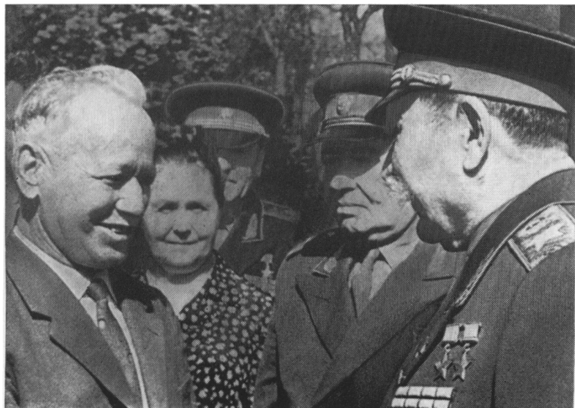
М. А. Шолохов приветствует полководца на донской земле. 1966 г.