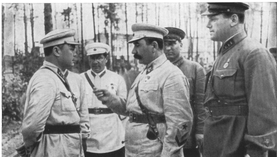
Маршал Советского Союза С. М. Буденный, командующий войсками Московского военного округа и член Военного Совета А. И. Запорожец среди начсостава кавалерийской части. 1939 г.