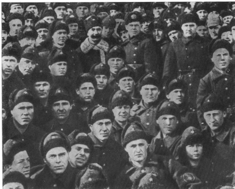
Инспектор кавалерии РККА и член РВС СССР С. М. Буденный среди моряков Амурской военной флотилии. 1929 г.

С. М. Буденный и «алтайский Сусанин» — Ф. С. Гуляев. 1929 г.