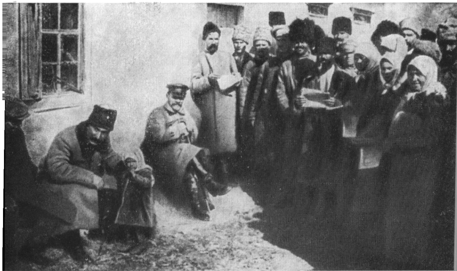
М. И. Калинин и С. М. Буденный беседуют с крестьянами. 1921 г.