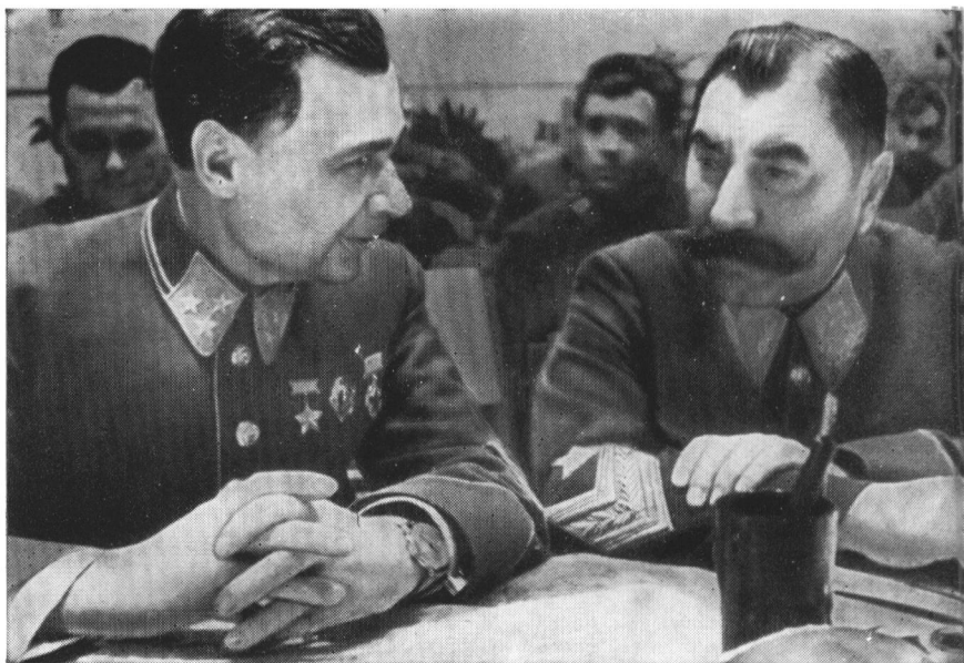
На партийной конференции Ленинградского военного округа. С. М. Буденный и командующий округом М. П. Кирпонос. 1940 г.