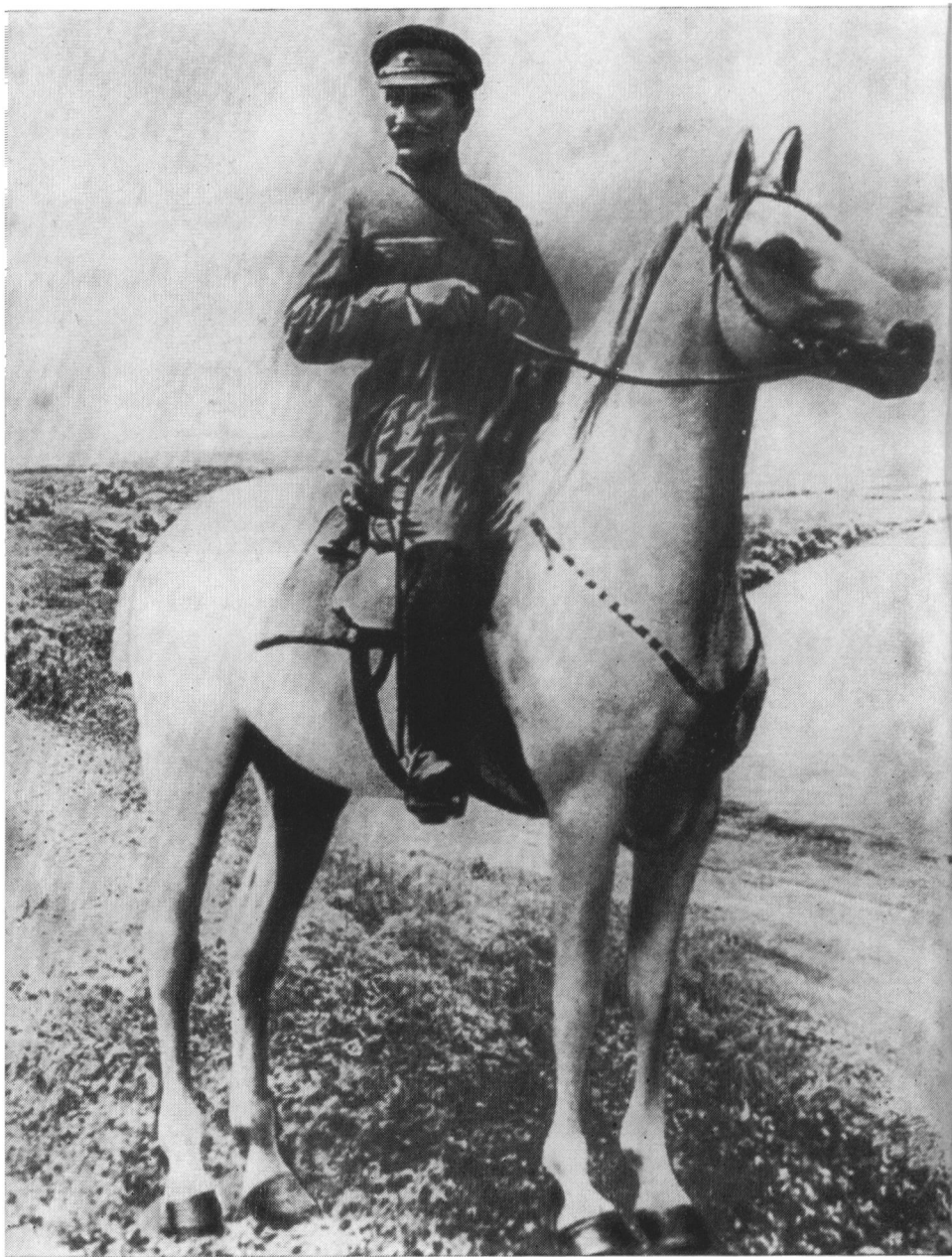
С. М. Буденный. Севастополь, 1920 г.