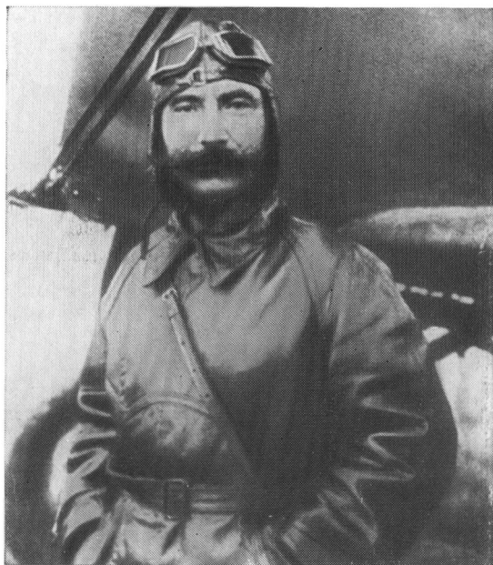
Слушатель Военной академии имени М. В. Фрунзе С. М. Буденный перед полетом. 1931 г.