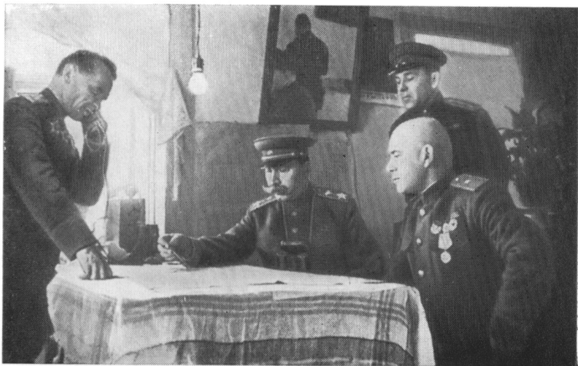
С. М. Буденный на командном пункте генерала П. И. Батова. 1943 г.