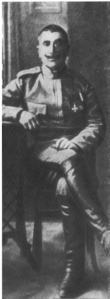
С. М. Буденный после награды Георгиевским крестом 4-й степени. 1914 г.