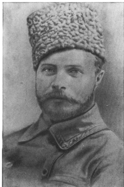
Командующий Южным фронтом М. Ф. Фрунзе. 1920 г.