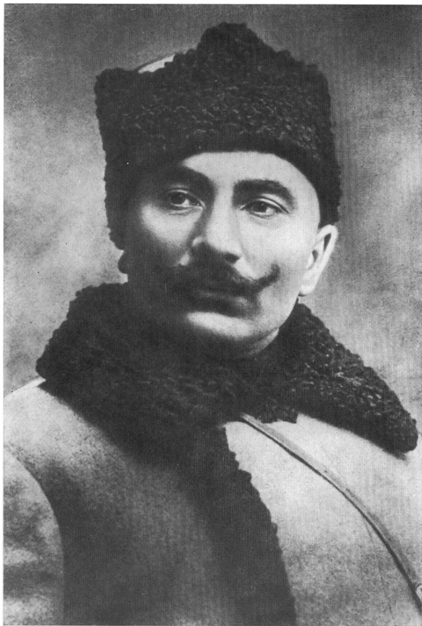
Командарм Первой Конной армии С. М. Буденный.