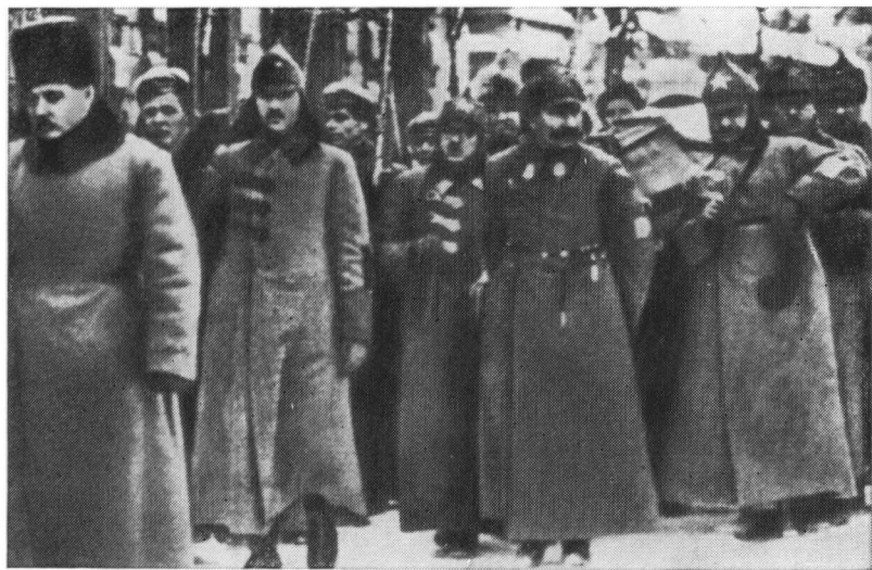
Г. К. Орджоникидзе, С. М. Буденный, К. Е. Ворошилов и другие несут гроб с телом В. И. Ленина от Павелецкого вокзала к Дому союзов. 1924 г.