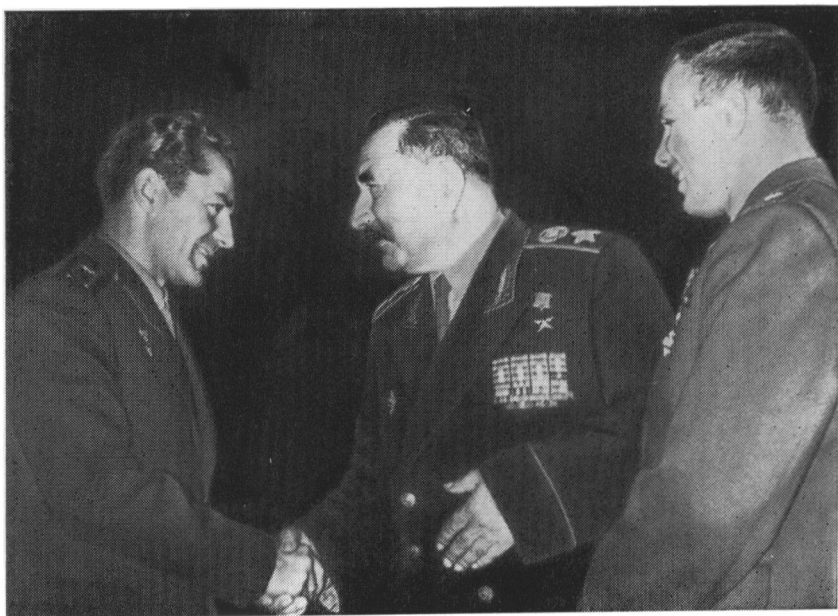
С. М. Буденный беседует с космонавтами Ю. А. Гагариным и Г. С. Титовым.