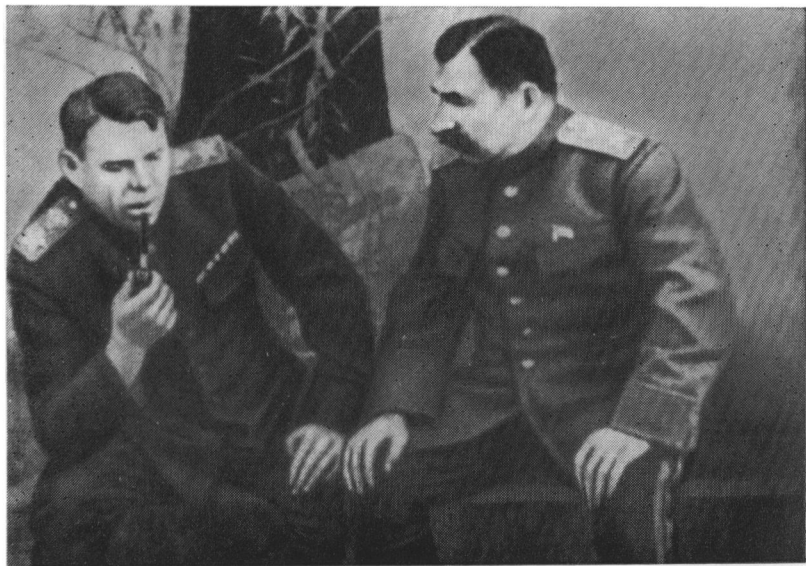
Члены Ставки Верховного Главнокомандования маршалы А. М. Василевский и С. М. Буденный в Донбассе. 1943 г.