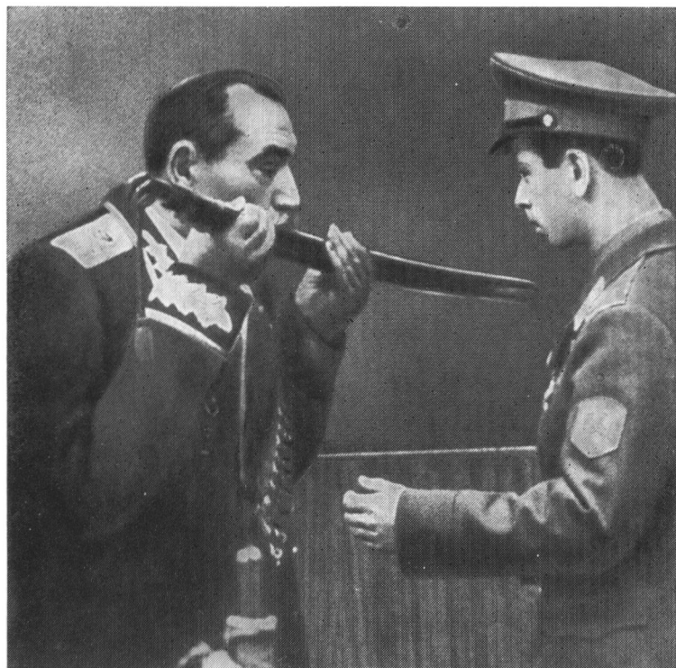
Маршал С. М. Буденный вручает свою боевую шашку комсомольцам 70-х годов на XVI съезде ВЛКСМ.