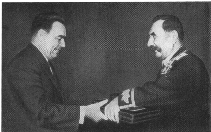
Председатель Президиума Верховного Совета СССР Л. И. Брежнев поздравляет С. М. Буденного с награждением второй медалью «Золотая Звезда». 1963 г.