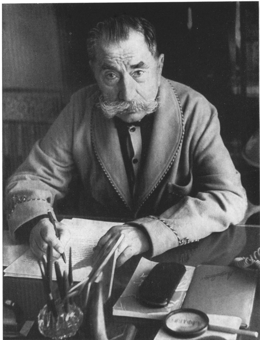
За рабочим столом. 1973 г.