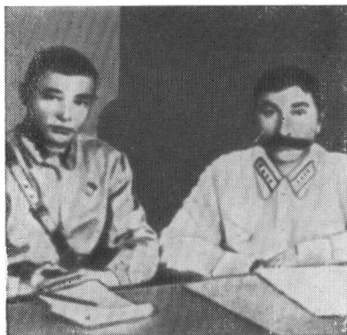
Встреча С. М. Буденного с группой бывших партизан. Иркутск, 1929 г.