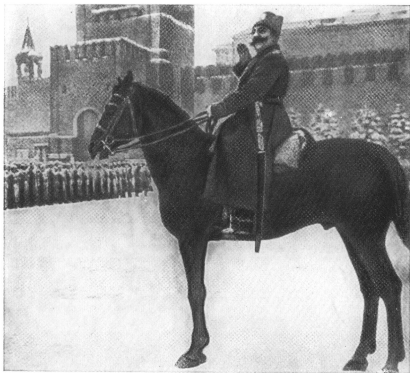
Маршал С. М. Буденный принимает военный парад 7 ноября 1941 года.