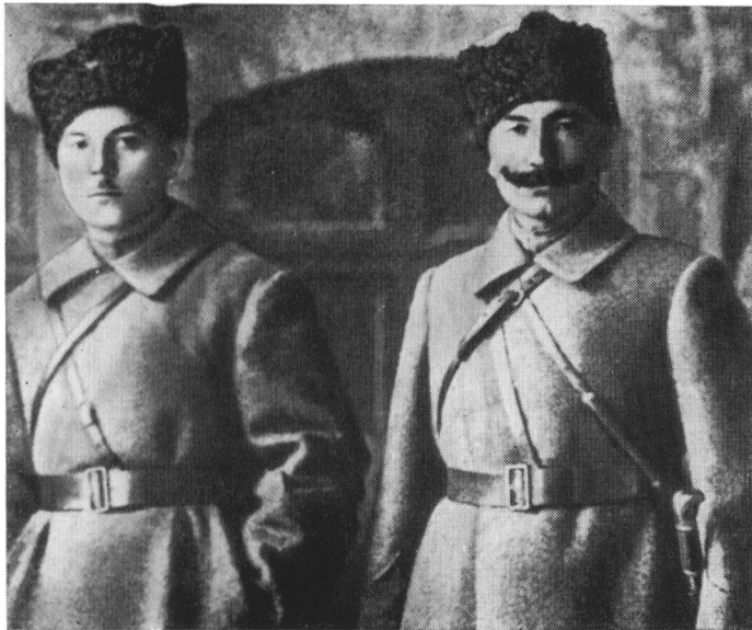
Командарм Первой Конной армии С. М. Буденный и член Реввоенсовета Конармии К. Е. Ворошилов. 1920 г.