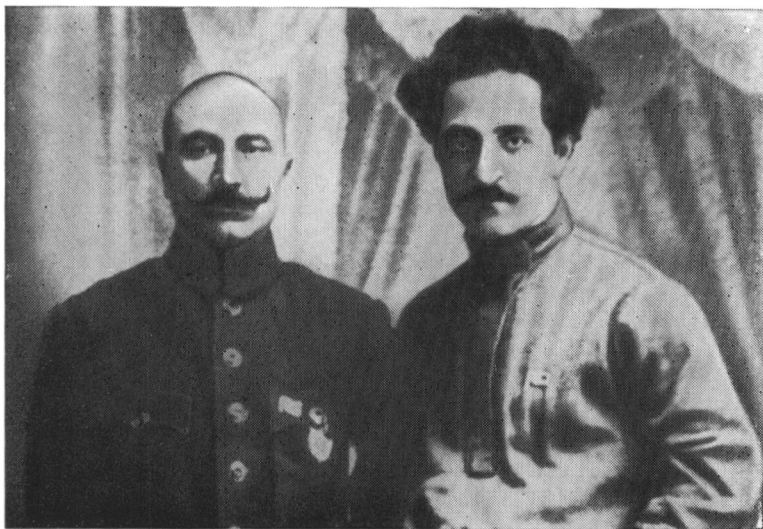
С. М. Буденный и Г. К. Орджоникидзе. 1920 г.