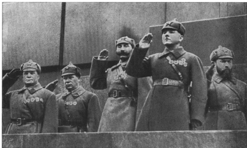
С. М. Буденный среди военачальников на трибуне Мавзолея В. И. Ленина 7 ноября 1935 г.