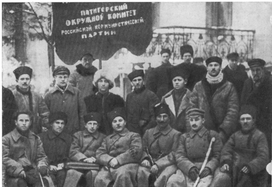
С. М. Буденный, К. Е. Ворошилов, А. С. Бубнов и др. с членами Пятигорского комитета РКП(б). 1920 г.