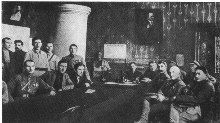
Член Реввоенсовета СССР С. М. Буденный на заседании Совнаркома Туркменистана. 1926 г.