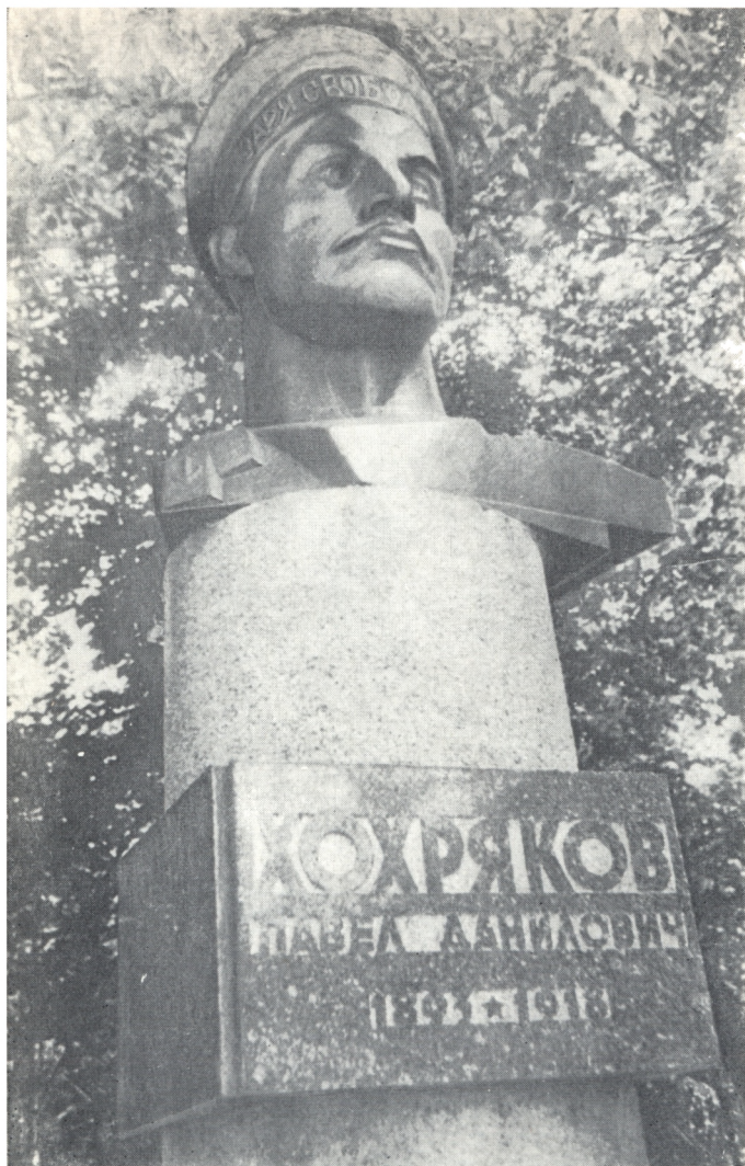
Памятник Павлу Даниловичу Хохрякову в Перми.