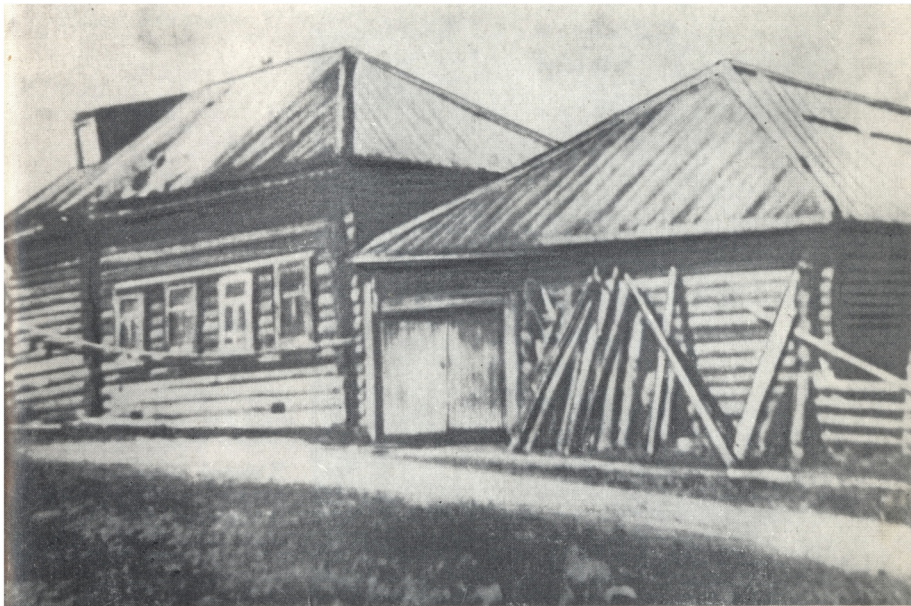
В этом доме прошли детские и юные годы Павла Хохрякова. Фото 1937 года.