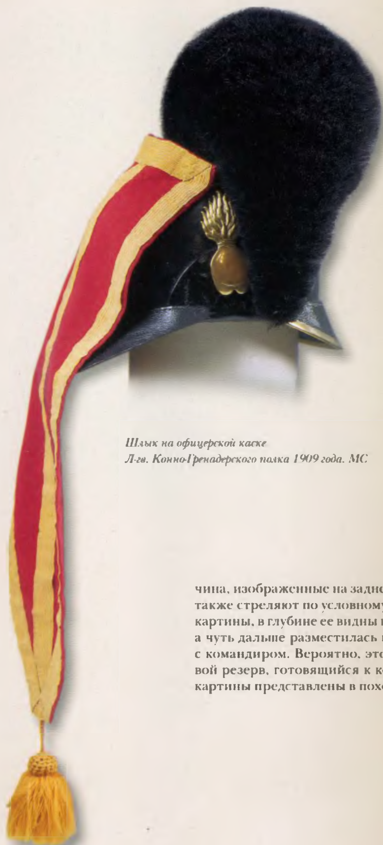
Шлык на офицерской каске Л-гв. Конно-Гренадерского полка 1909 года. МС

чина, изображенные на заднем плане в центре полотна, также стреляют по условному противнику. В левом углу картины, в глубине ее видны несколько пеших grenадер, а чуть дальше разместилась группа всадников во главе с командиром. Вероятно, это эскадронный или полковой резерв, готовящийся к контратаке. Все персонажи картины представлены в походной форме.