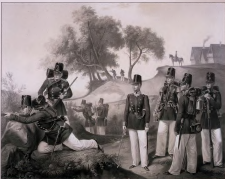
Лейб-гвардии 2-й Стрелковый батальон. 1857 г. Литография В. Ульриха