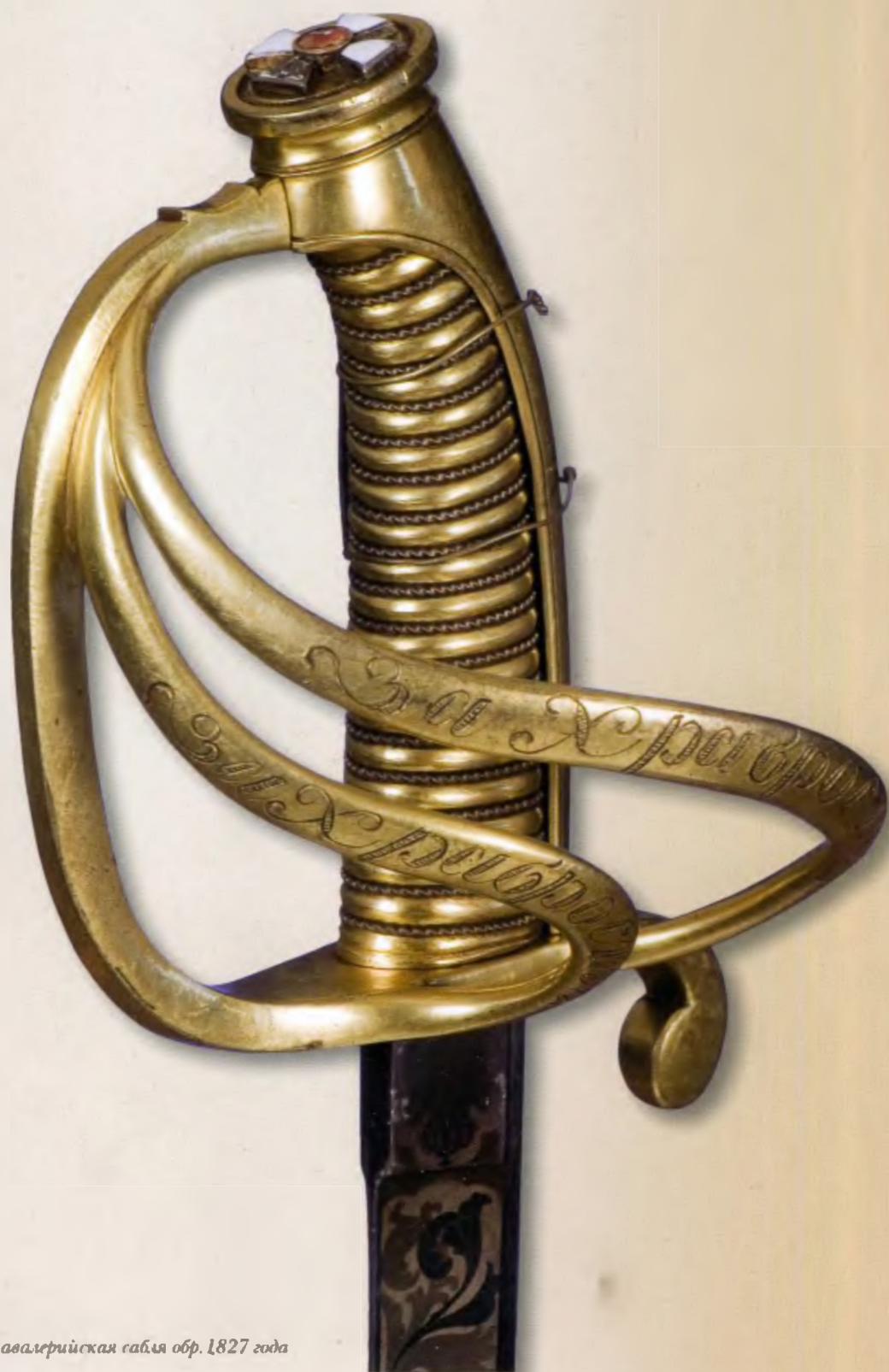
Наградная кавалерийская сабля обр. 1827 года