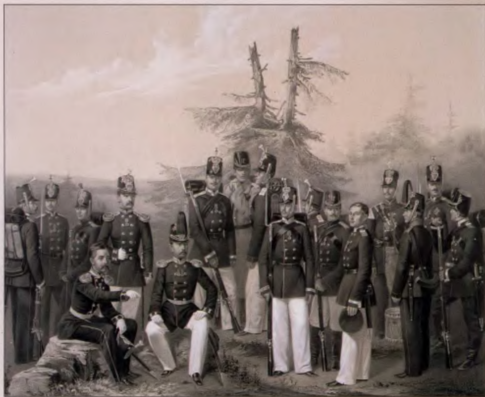
Пехота 1-го армейского корпуса. 1861 г. Литография Бира и Фернунда 2-го