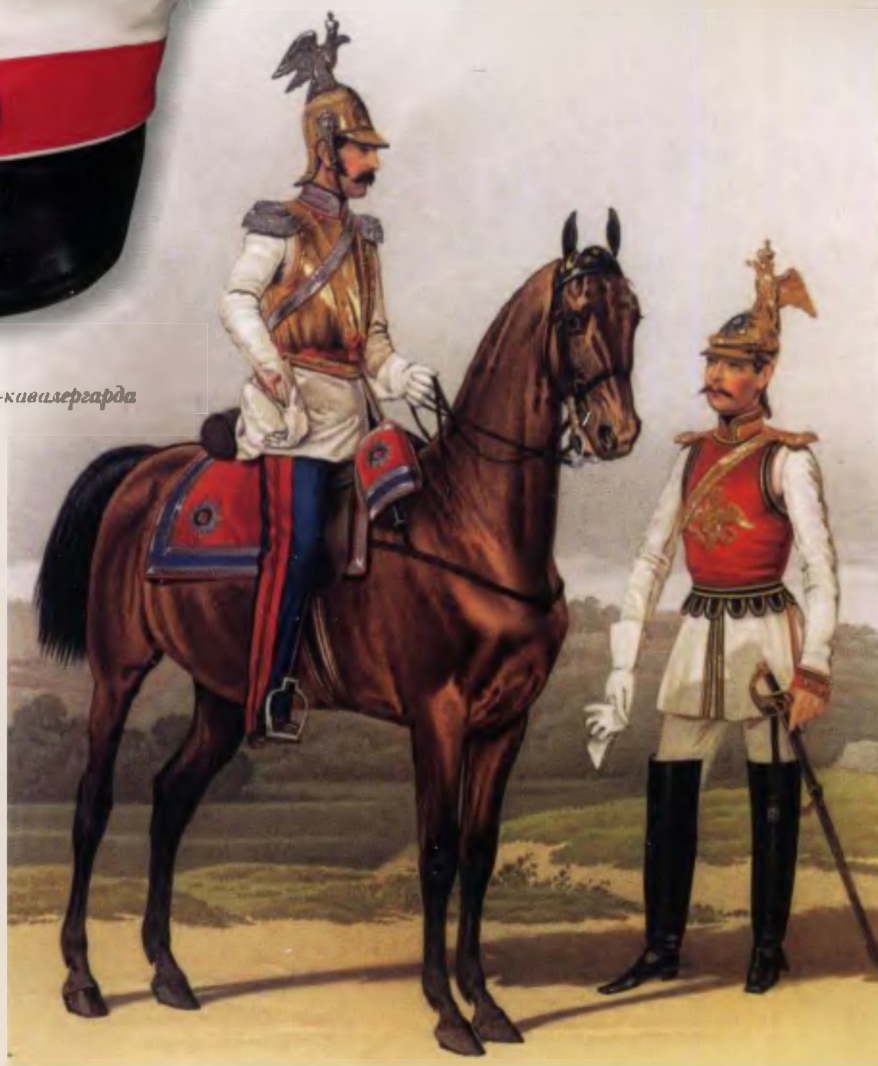
Офицеры Л-гв. Кавалергардского и Конного полков