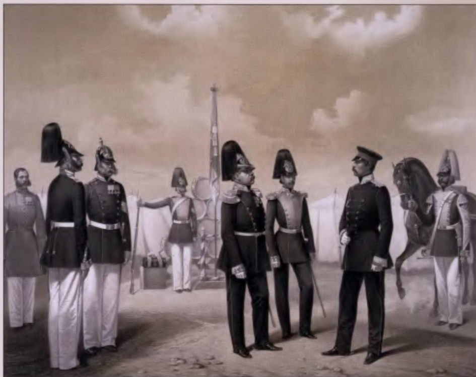
Гренадерский Императора Австрийского полк. 1856 г. Литография К. Гиллера