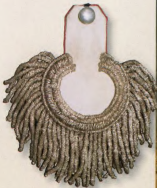
Эполет полковника Л.-гв. Вальмского полка

углу полотна изображен строй волынцев с унтер-офицером на правом фланге. Судя по шеврону на его рукаве — это кандидат на классный чин. Перед строем на исходном рубеже стоят офицер, наблюдающий за ходом стрельб, и рядовой с ружьем «на руку». В правом углу картины показан батальонный барабанщик, бьющий в барабан. На заднем плане хорошо видны: нижний чин, стреляющий по мишени, и знаменосец с Георгиевским знаменем. Все персонажи, кроме полковника, изображенного в парадной форме, показаны в обыкновенной форме.