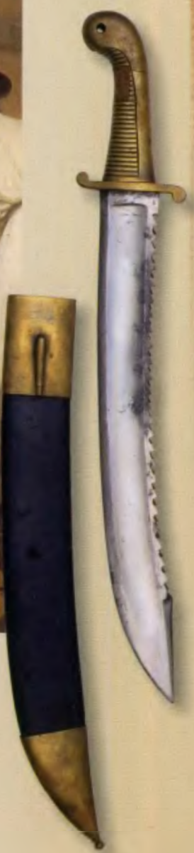
Саперный солдатский тесак обр. 1827 года