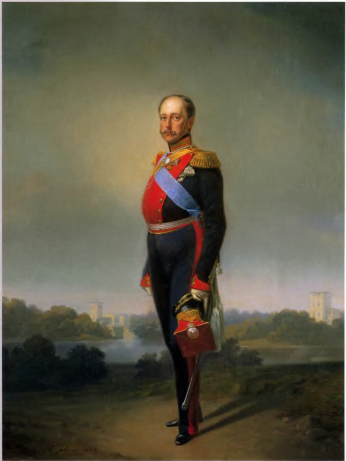
Император Николай I. Художник А. И. Гебенс, 1852 Холст, масло