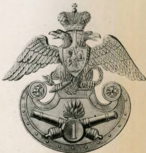
Киверный герб 1-й бригады артиллерийских бригад образца 1833 года

На картине изображены офицеры и нижние чины 1-й батареи на занятиях в поле в окрестностях Петергофа. Подтверждением этого является Петергофская церковь Святой мученицы и царицы Александры, виднеющаяся в глубине полотна. В центре картины полковник в сюртуке. По всей видимости, это командир батареи. Справа и слева от него два обер-офицера в обыкновенной и парадной формах. В левой части полотна младший фейерверкер в парадной форме и фельдфебель в шинели с фуражкой в руке. Шифровка на околыше фуражки подтверждает, что перед нами чины первой батареи, а белая выпушка на клапанах обшлагов почти у всех персонажей говорит, что батарея входит в состав Л.-гв. 1-й Артиллерийской бригады. В правом углу картины возле пушки показаны бомбардир с бабником в руках и канонир — оба в обыкновенной форме. Слева на заднем плане видна группа нижних чинов, занимающаяся обслуживанием орудия, а за командиром батареи изображен батарейный барабанщик. Все они в обыкновенной форме с полной выкладкой.