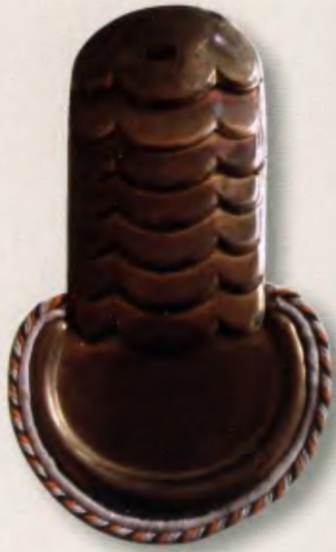
Эполет к парадной форме рядового (вольноопределяющегося) улана