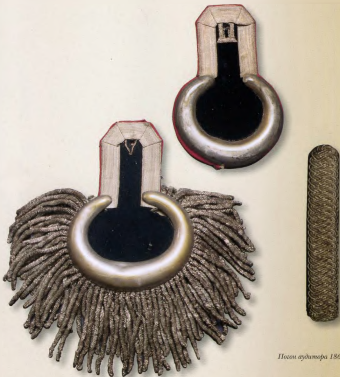
Погон аудитора 1860-х годов

Кроме того, в наши дни военных дирижеров уже редко называют капельмейстерами. Что касается остальных названий чинов, то все они сохранились по сей день и их названия не вызывают недоумения.