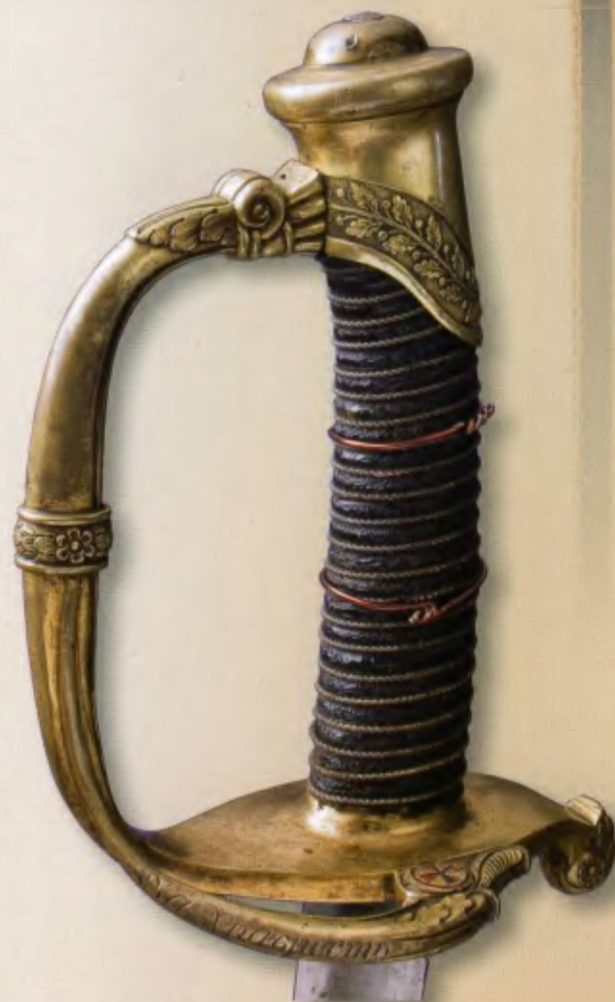
Офицерская пехотная сабля обр. 1826 года. Наградное Аннинское оружие