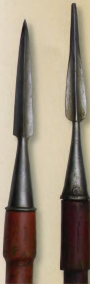
Пи́ки каза́чы обр. 1839 года