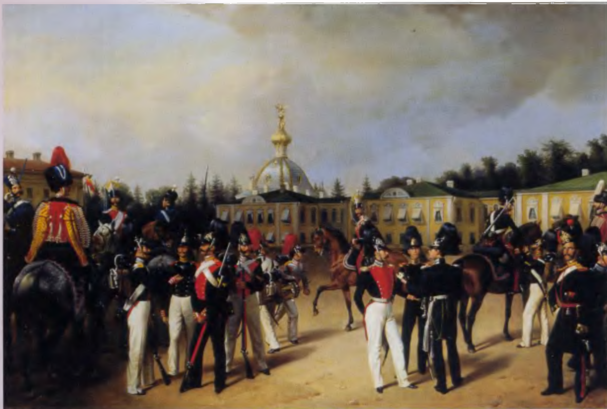
Ф. Крюгер. Гвардейцы на фоне Петергофского дворца. 1853 год