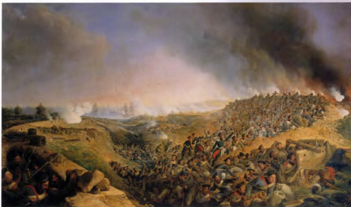
А. Зауэрвайд. Инженерный штурм крепости Варны 23 сентября 1828 года. 1836 год

Тем не менее, как уже было сказано, наиболее известна в России его сюита из более чем ста тридцати полотен, посвященная Русской армии, самые ранние из которых выполнены в конце 1840-х – начале 1850-х годов. Это в основном сцены солдатского быта. Так Адольф Гебенс начал поиск своей темы в батальном жанре. Несмотря на то что, согласно приводимой выше записке, работать по заказам Кабинета художник начал в 1848 году, в фонде самого Кабинета в Российском государственном историческом архиве ни за этот, ни за следующий год документов с упоминанием об интересующем нас событии не сохранилось. Выплаты за написанные картины документально подтверждаются только с 1850 года, но, тем не менее, несколько его полотен конца сороковых годов мы можем восстановить по описям Царскосельского дворца и по наличию. К таким работам относятся «Квартирьеры Лейб-гвардии Преображенского полка», «Солдаты Лейб-гвардии Литовского полка», «Песенники Лейб-гвардии Семеновского