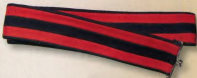
Пояс рядового Л-гв. Конно-Гренадерского полка