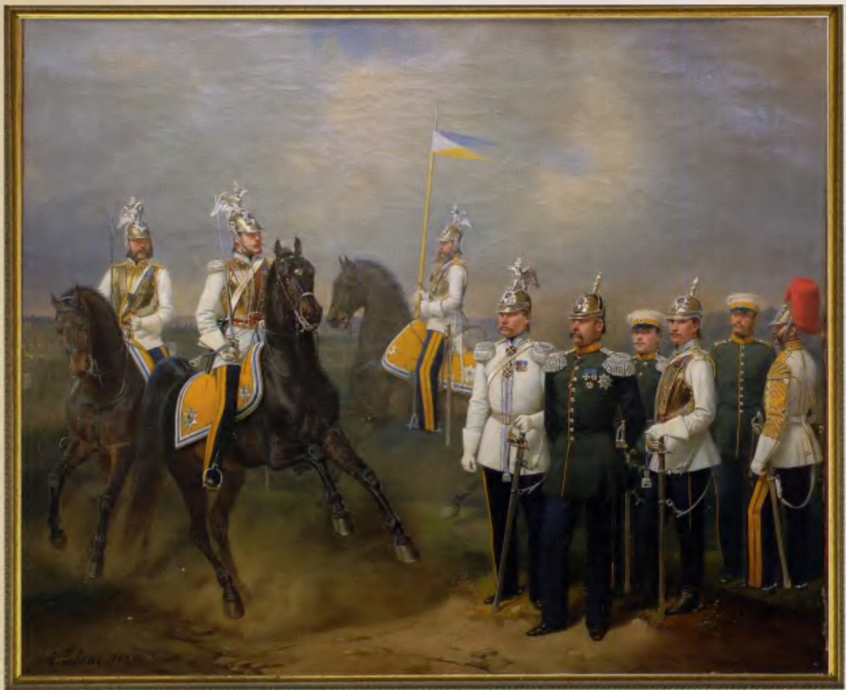
Группа чинов Л.-гв. Кирасирского Его Величества полка