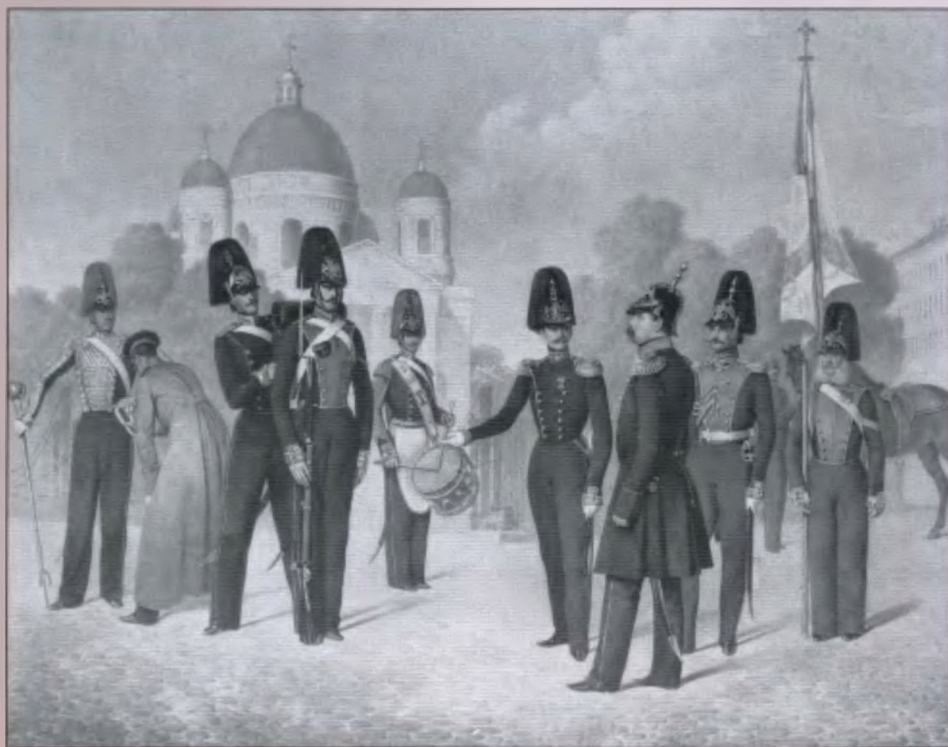
Чины Лейб-гвардии Преображенского полка. 1855 г. Литография К. Гиллера (?)

Мы надеемся, что издание этой книги обратит внимание собирателей на произведения этого художника, и позволит найти многие его работы, которые в настоящее время числятся утраченными.