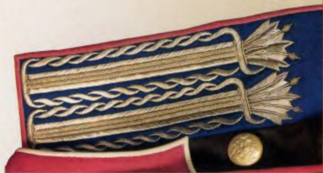
Офицерское шитье воротника Л.-гв. Семеновского полка (мундир 1830 года)