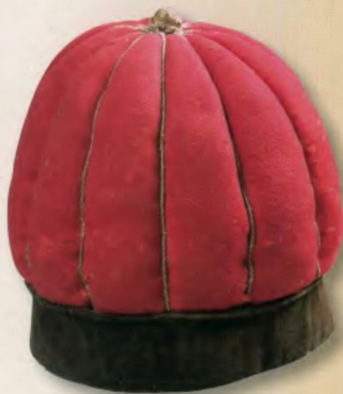
Тюрбаны чинов горского взвода Конвоя Его Величества