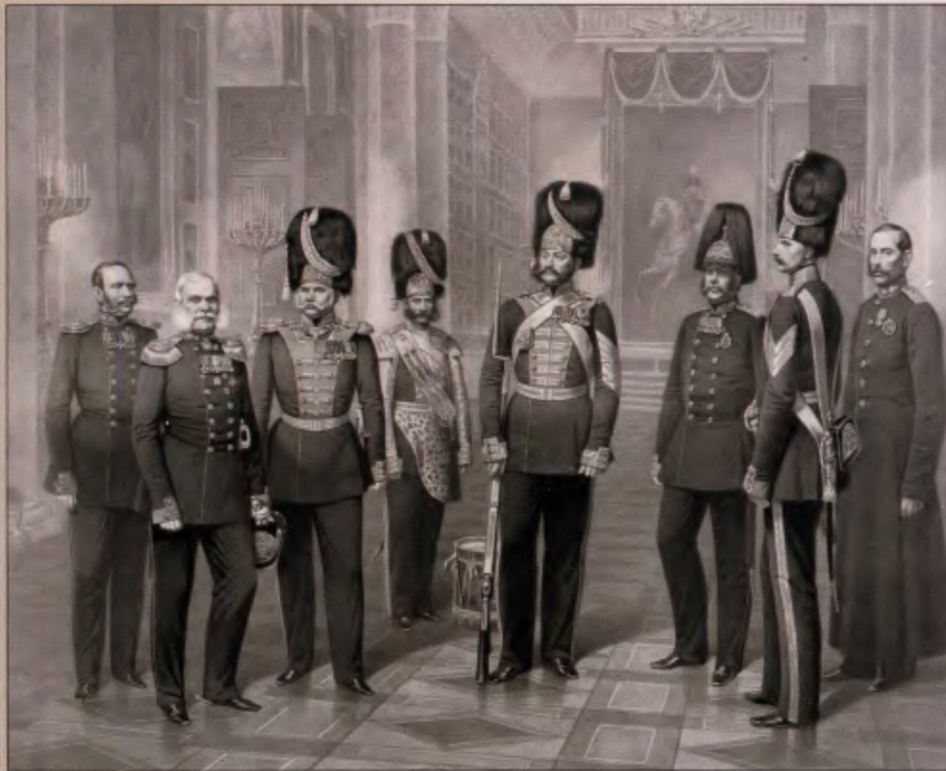
Дворцовые гренадеры. 1861 г. Литография Смирнова