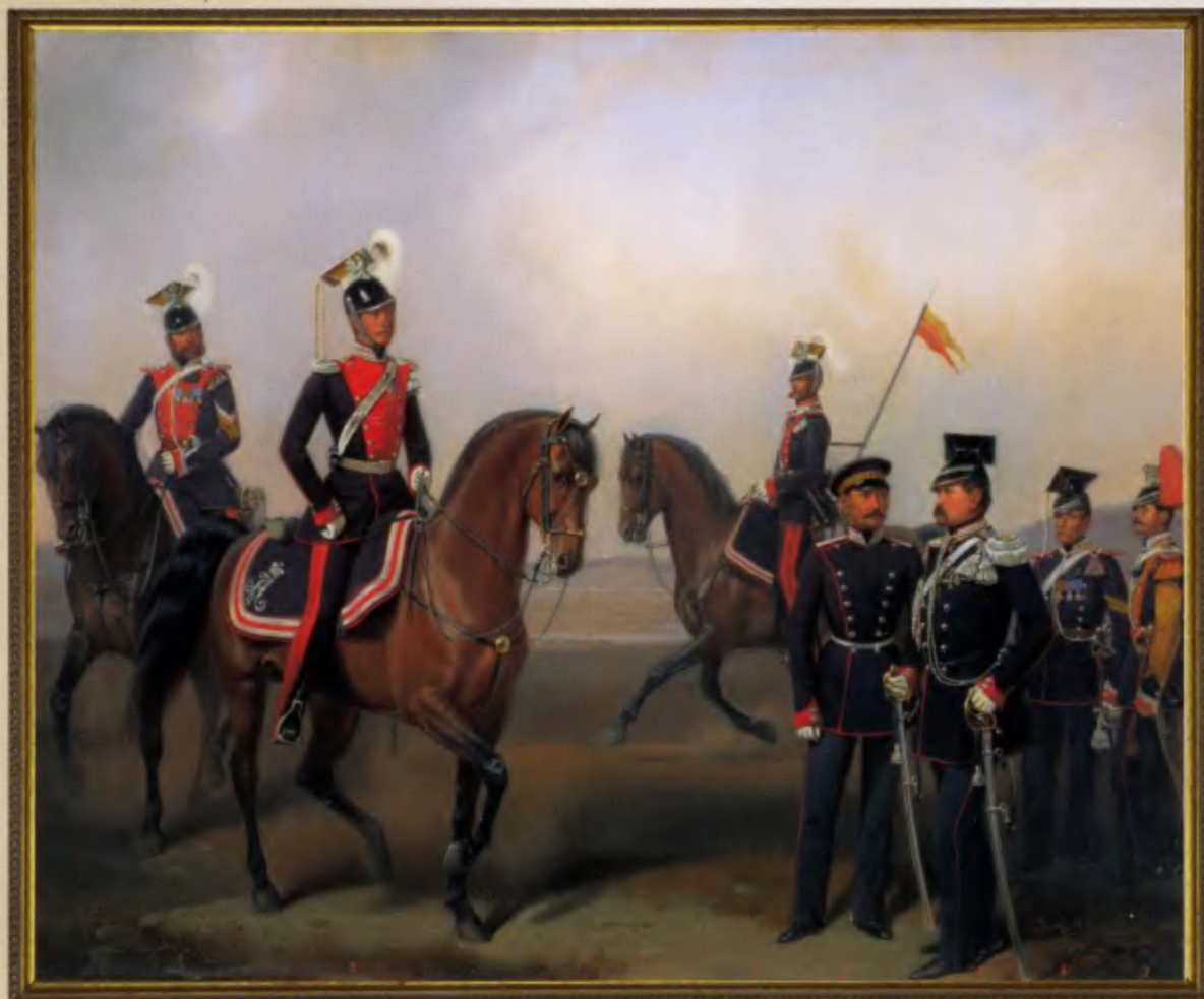
Группа офицеров и нижних чинов Л.-гв. Уланского Его Величества полка Полотно 1857 года, 55х67, масло, холст

7 декабря 1817 года в Варшаве скомплектован Л.-гв. Уланский Его Императорского Высочества Цесаревича полк. Свое название полк получил в 19 февраля 1855 года. Полковой праздник назначен в день Святого Мартиниана 13 февраля. В полк набирали хорошо сложенных шатенов, для которых покупали гнедых коней.