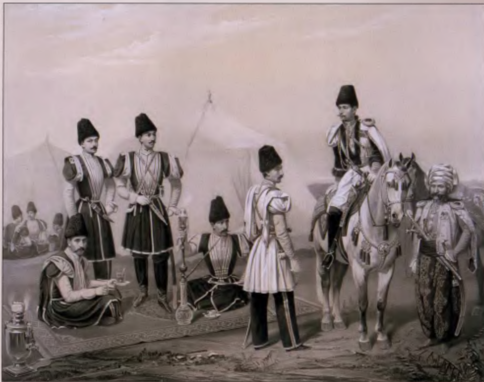
Лезгиньы Собственного Его Императорского Величества конвоя. 1860 г. Литография Бири