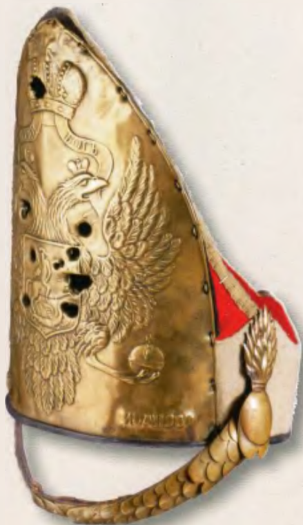
Гренадерки Л.-гв. Павловского полка

«Все курносые и сопаты В гвардии Павловском Солдаты».