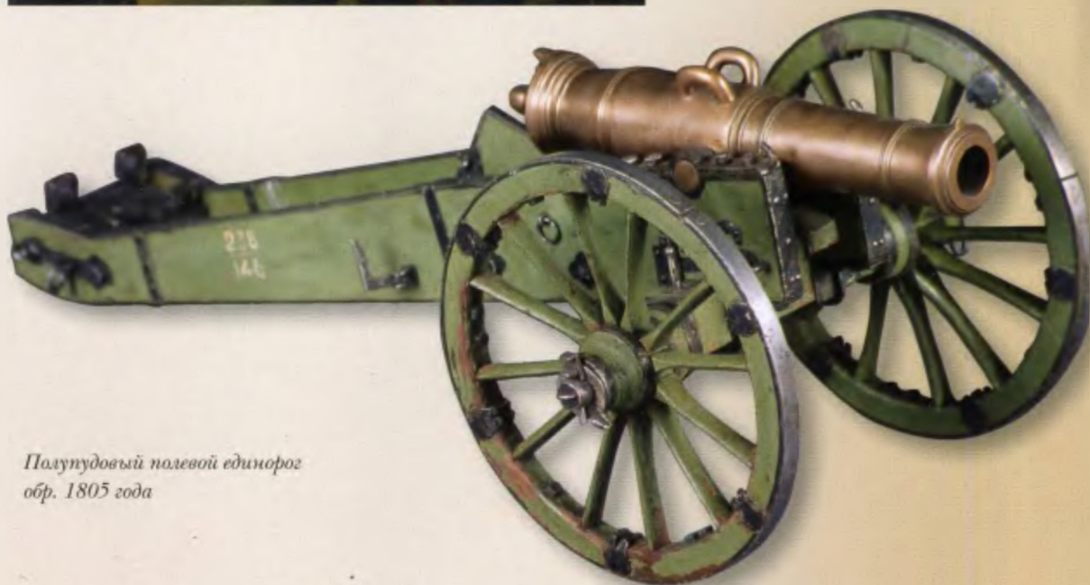
Полупудовый полевой единорог обр. 1805 года