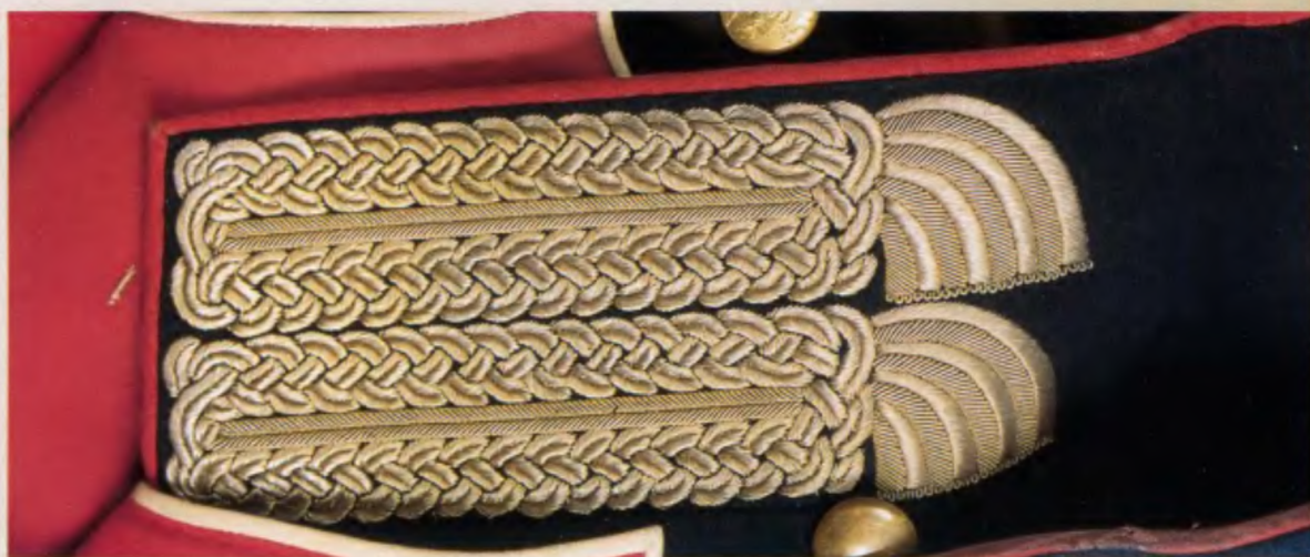
Офицерское шитье воротника и клапана обшлага Л.-гв. Измайловского полка, 1817–1829 гг.