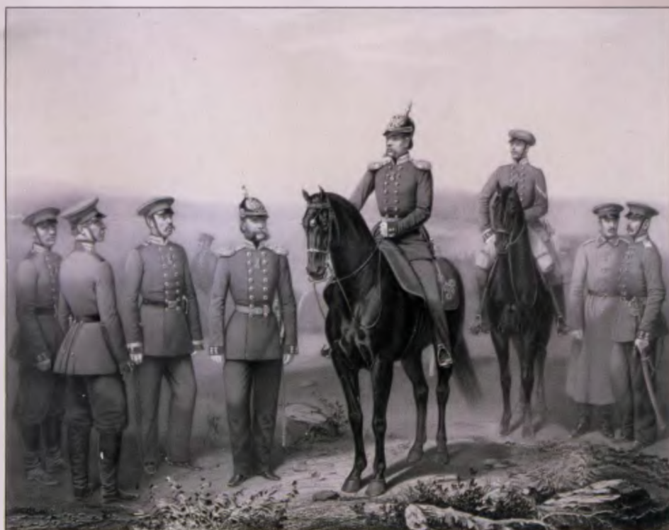
Чины Гвардейского фуритата. 1861 г. Литография Гиллера и Бира