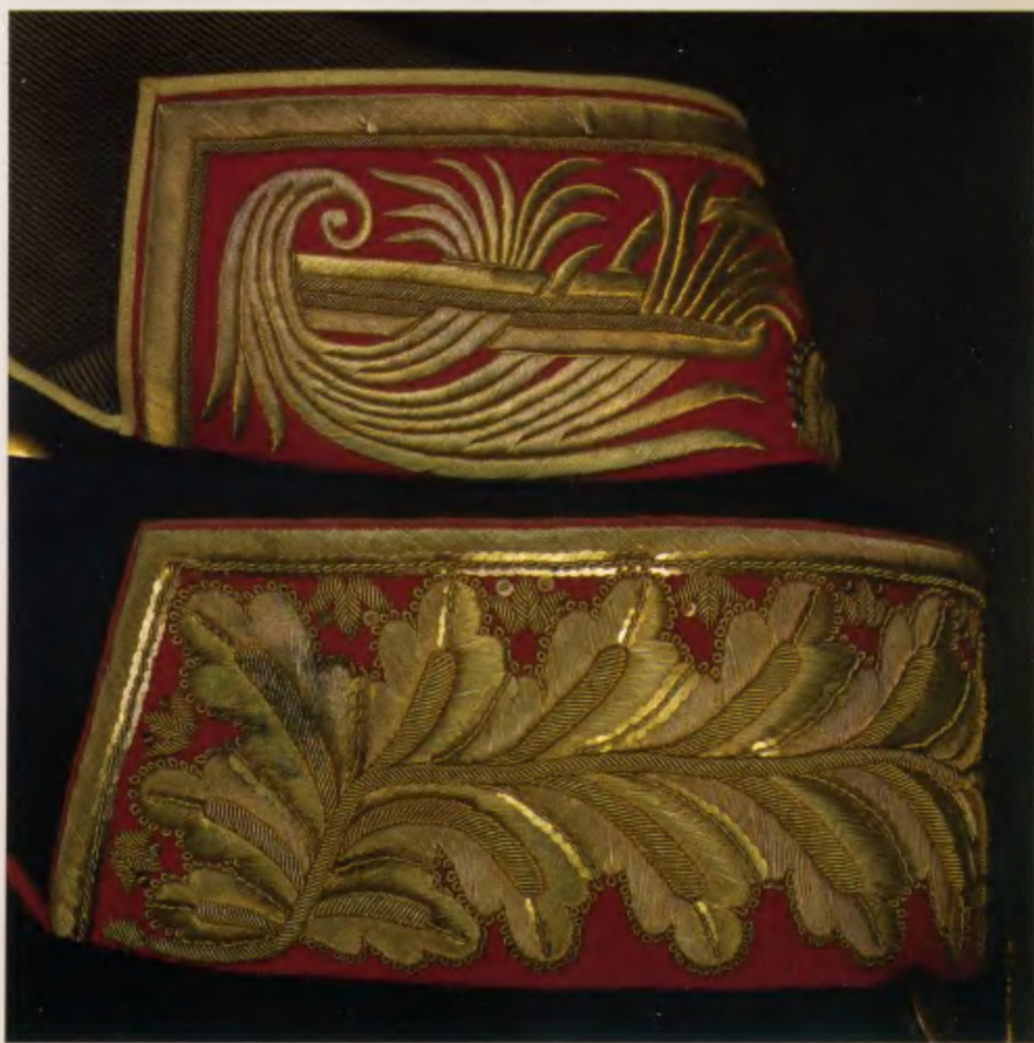
Мундирное шитье воротников чинов свиты (сверху) и генералов