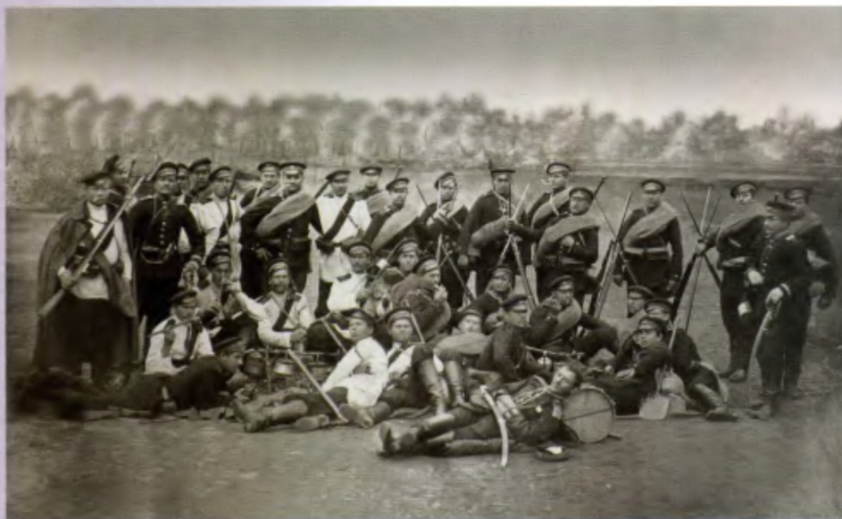
Бивуак Сыздальского пехотного полка на Чинар-Ханской позиции перед Константинополем в 1878 году

Штандартная комната Екатерининского дворца Царского Села. Фото начала XX века. (нижняя картина справа - «Гродненские Гусары» художника А. Гёбенса)