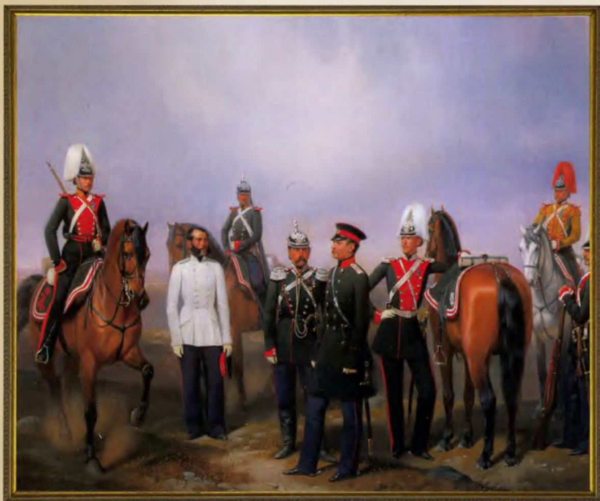
Группа чинов Л.-гв. Драгунского полка