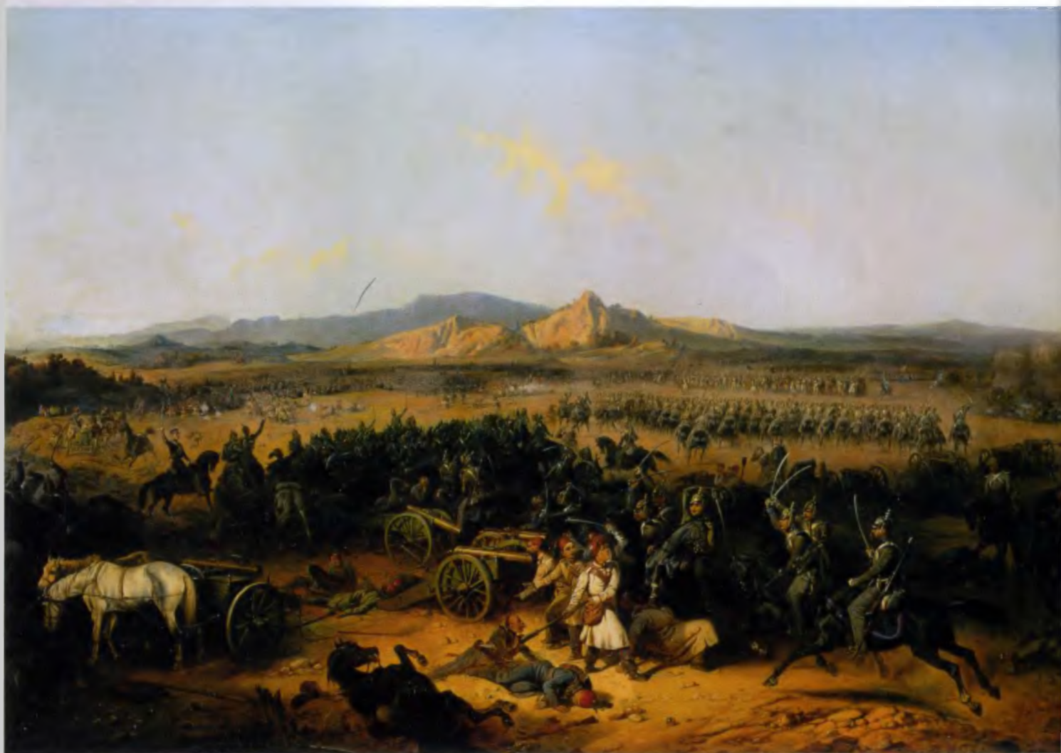
Б. Виллевальде. Кавалерийская атака при Башкадыкларе 19 ноября 1853 года. 1855 год