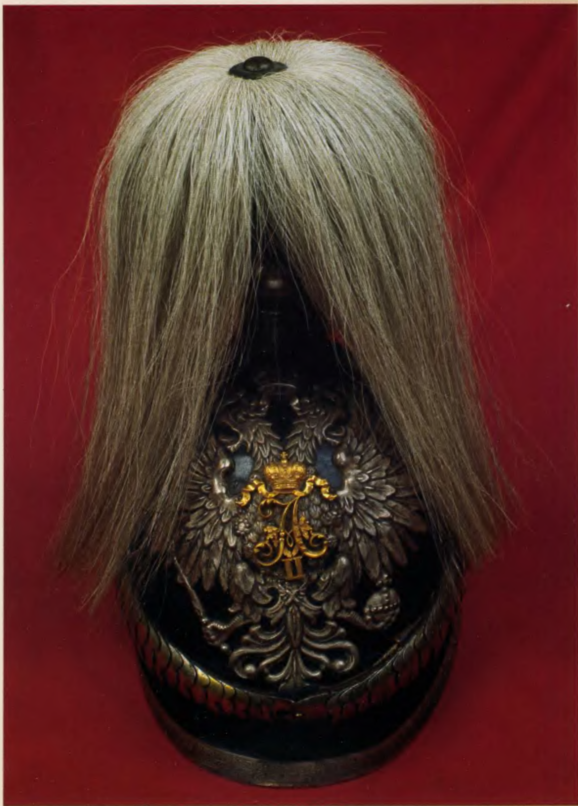
Каска гвардейского офицера середины XIX века