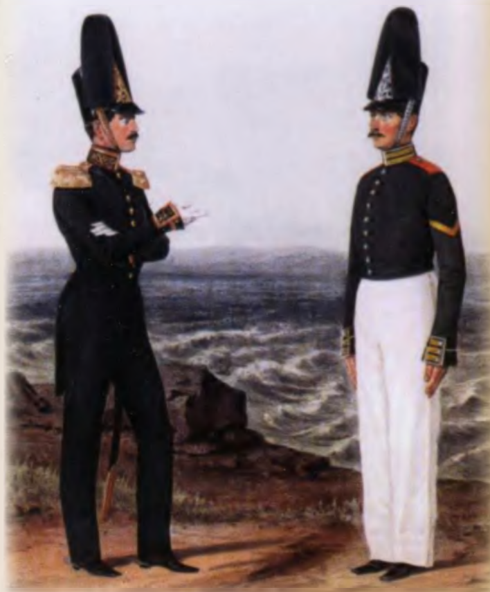
Офицер и матрос Гвардейского экипажа 1850-х годов

На полотне изображены: командир экипажа контр-адмирал С. И. Мофет в сюртуке, капитан первого ранга в парадной форме, обер-офицер, унтер-офицер, рядовой и барабанщик. Чуть поодаль знаменосец в окружении матросов Экипажа. От набережной отваливает (к набережной швартуется) шлюпка с императорской яхты, на которой изображены матросы в корабельной форме.