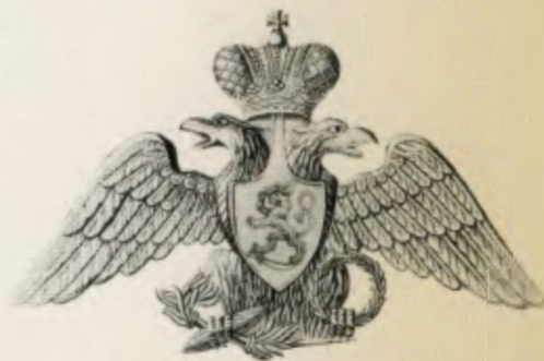
Киевский герб финских стрелков