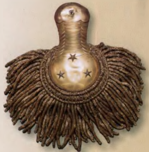
Эпалет подполковника кавалерии