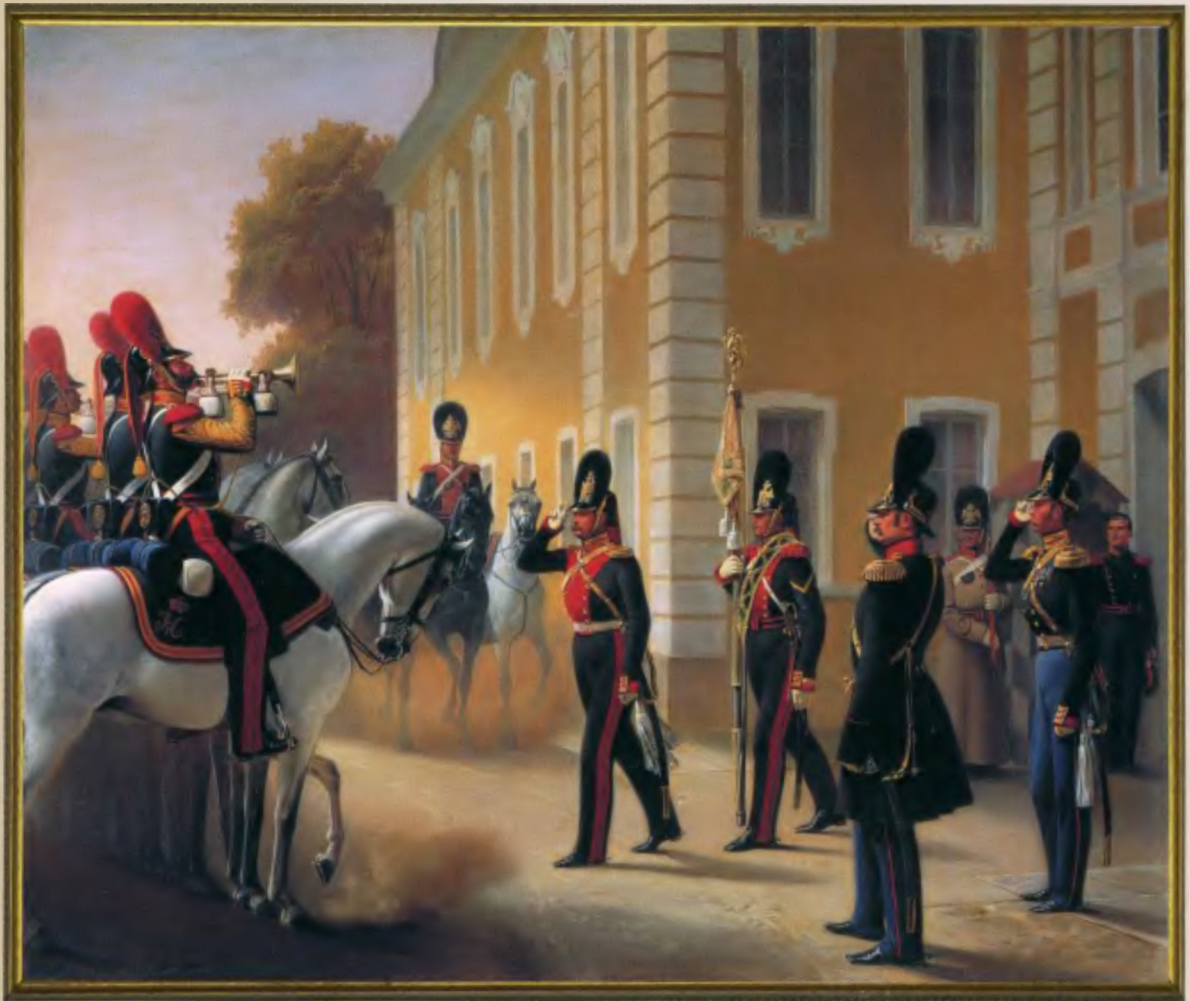
Вынос штандарта Л.-гв. Конно-Гренадерского полка Полотно 1853 года

Вынос штандарта к строю полка происходит на фоне Петергофского дворца.