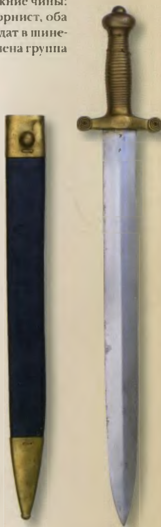
Солдатский пехотный тесах обр. 1848 года