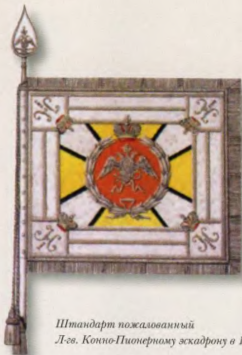
Штандарт пожалованный Л-гв. Конно-Пионерному эскадрону в 1826 году