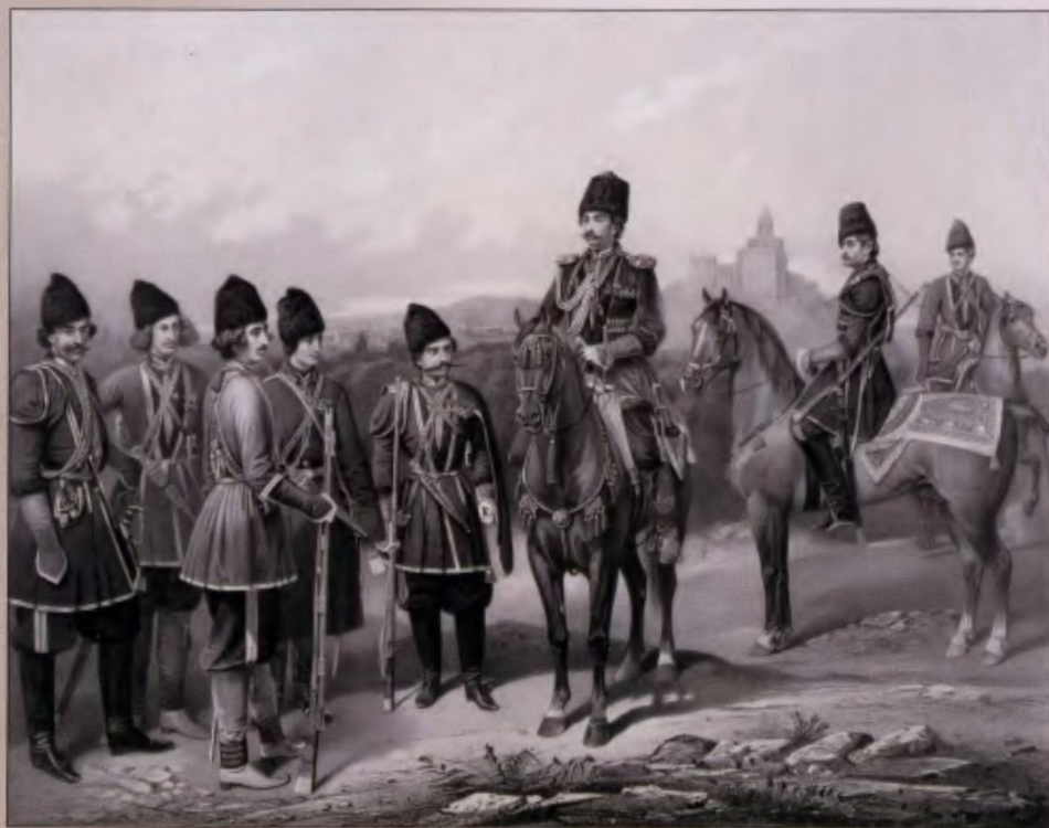
Грузины Собственного Его Императорского Величества конвоя. 1861 г. Литография Бира