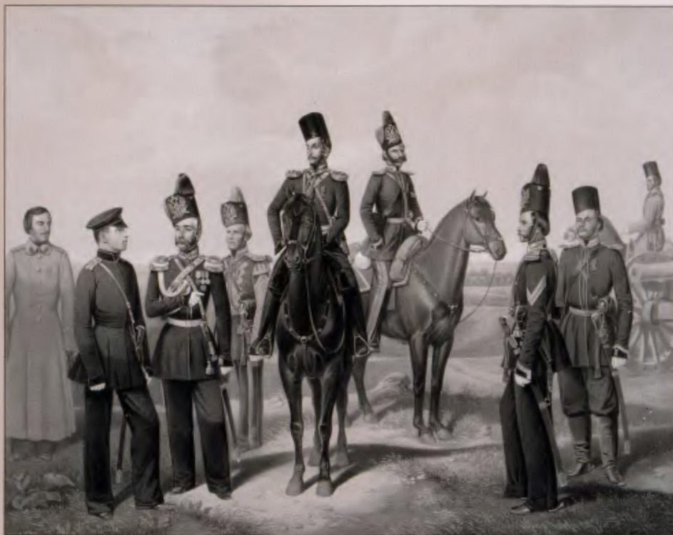
Лейб-гардии Донская казачья батарея. 1859 г. Литография К. Гиллера