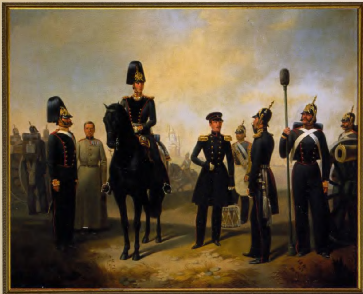
Группа военных чинов 1-й батареи Л.-гв. 1-й Артиллерийской бригады Полотно 1855 года, 56х67, холст, масло

В ноябре 1796 года из Бомбардирской роты Преображенского полка, команд пушкарей других гвардейских полков и артиллерии Гатчинских войск был сформирован Л.-гв. Артиллерийский батальон. Состоял батальон из трех пехотных и одной конной артиллерийских рот. В 1803 году Л.-гв. Артиллерийский батальон был разделен на пять рот — две батарейные, две легкие и одну конную. В 1805 году конная рота отделена от батальона, а сам он в феврале 1811 года переименован в Л.-гв. Артиллерийскую бригаду. Через пять лет, в 1816 году, бригада была разделена на две: Л.-гв. 1-ю Артиллерийскую и Л.-гв. 2-ю Артиллерийскую бригады. 1-я батарея Л.-гв. 1-й Артиллерийской бригады была самым привилегированным и заслуженным подразделением всей Императорской Гвардейской артиллерии. Это объясняется прежде всего тем, что при формировании Л.-гв. Артиллерийского батальона именно в состав 1-й роты (впоследствии 1-й батареи) вошла Бомбардирская рота Преображенского полка. Кроме того, батарея героически сражалась во всех войнах, которые вела Россия в XIX и в начале XX века. За боевые заслуги 1-я батарея имела Георгиевскую серебряную трубу с надписью: «За отличие