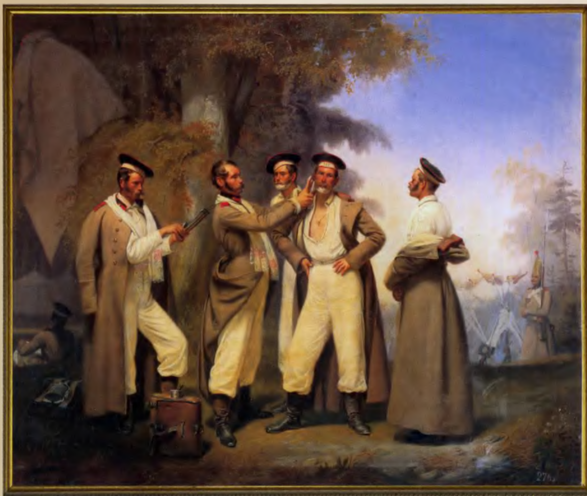
Солдаты Л.-гв. Павловского полка на бивуаке