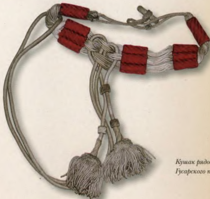
Кушак рядового Л.-эв. Гродненского Гусарского полка. Вторая половина XIX века