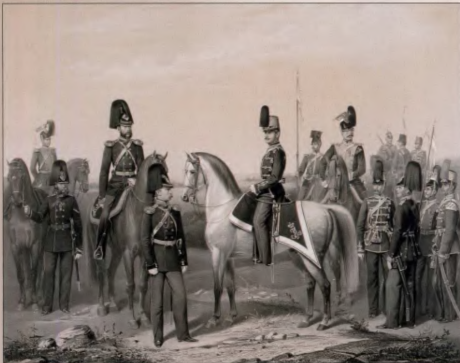
Чины 7-й Легкой кавалерийской дивизии. 1862 г. Литография К. Гиллера