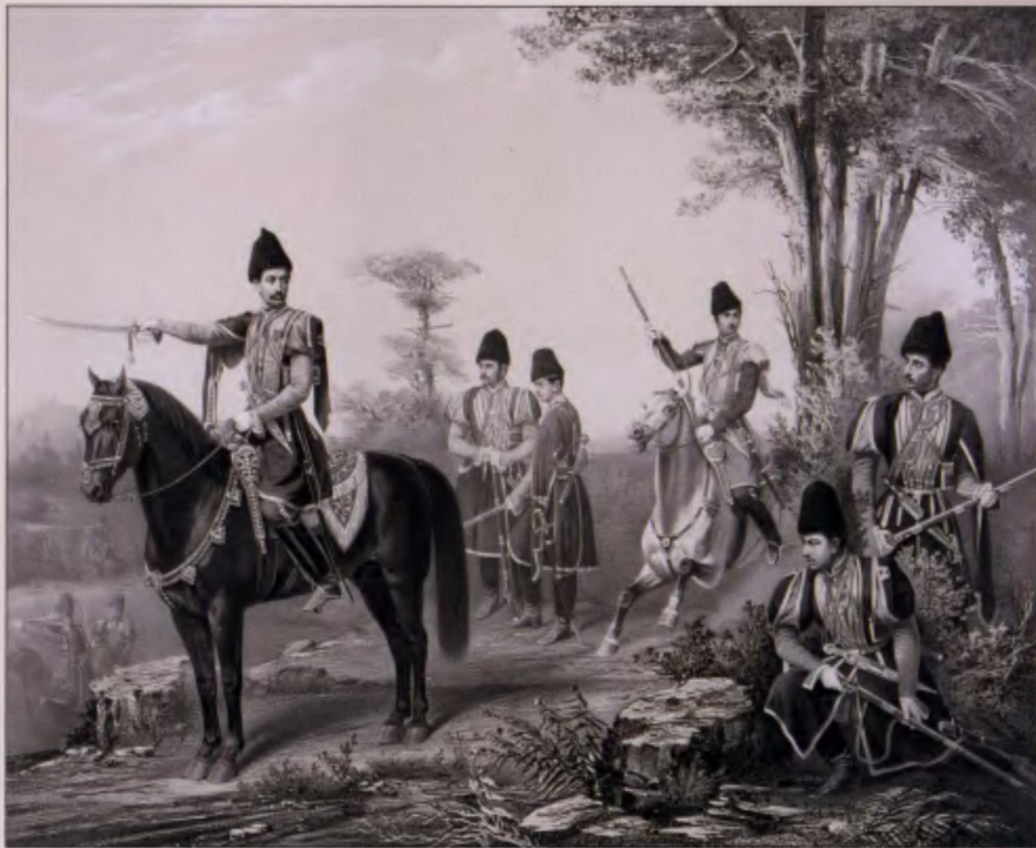
Мусульмане Собственного Его Императорского Величества конвоя. 1860 г. Литография К. Гиллера