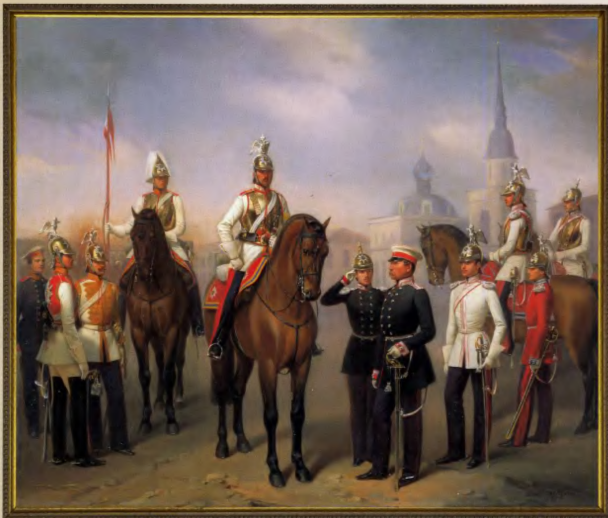
Группа офицеров и солдат Кавалергардского Ея Величества полка