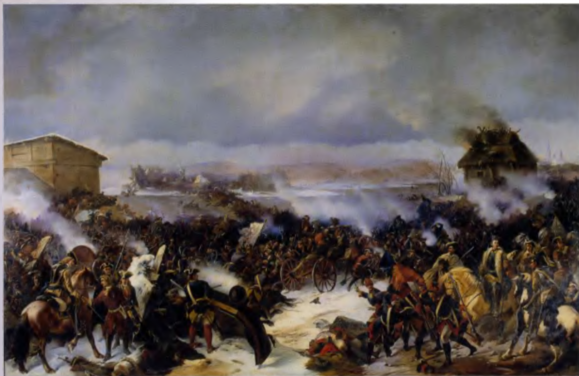
А. Коцебу. Сражение под Нарвой 19 ноября 1700 года. 1846 год

цикл его картин на тему суворовских походов, за который он получил звание профессора батальной живописи.