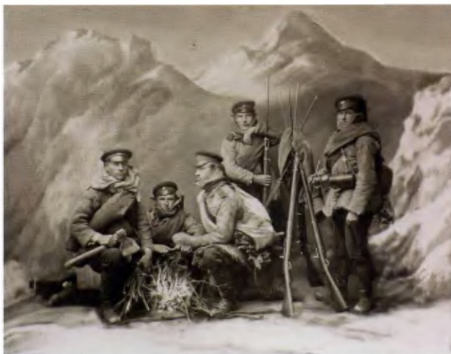
Солдаты Владимирского пехотного полка на аванпостах в Балканских горах в 1877 году

В настоящем издании мы прокомментируем картины художника, хранящиеся в Государственном Музее-Заповеднике «Царское Село», Военно-историческом музее артиллерии, инженерных войск и войск связи, Мемориальном музее А. В. Суворова, Государственном Русском музее, Государственном музее-заповеднике «Петергоф» и в Центральном Военно-медицинском музее. Искусствоведческий комментарий вряд ли будет слишком восторженным и разнообразным, поэтому мы ограничимся лишь комментарием историческим. Все даты приводятся по старому стилю.