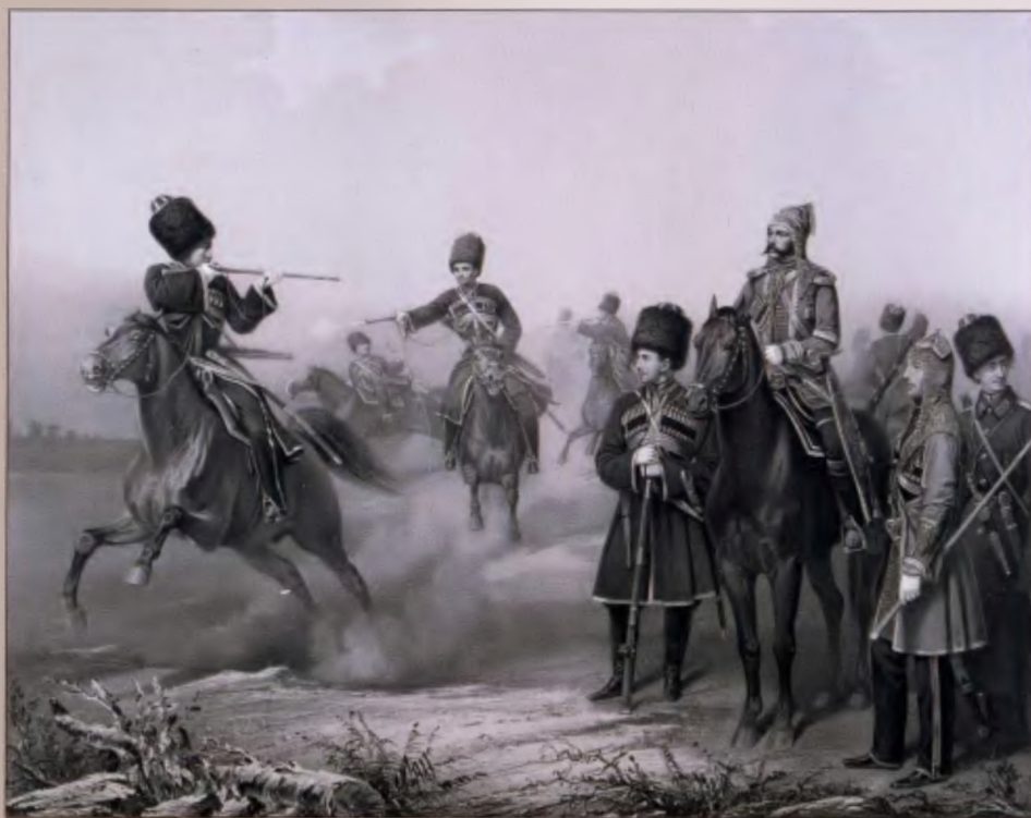
Черкесы Собственного Его Императорского Величества конвоя. 1860 г. Литография К. Гиллера