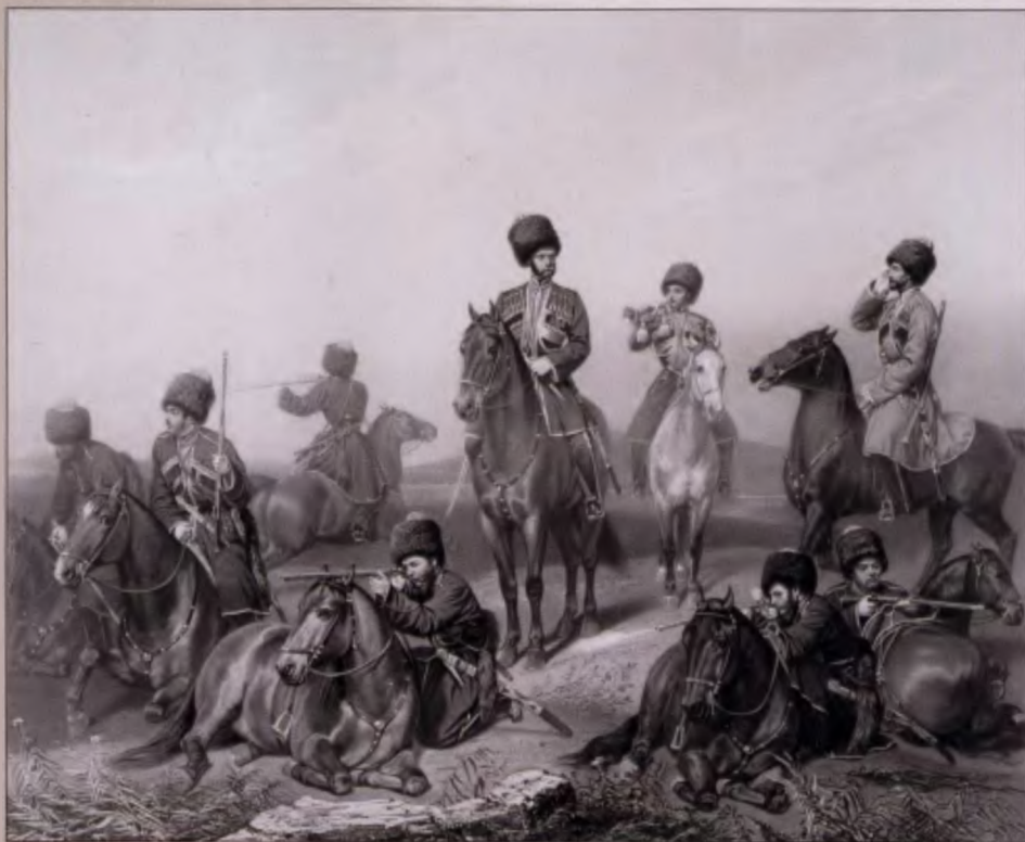
Линейные казаки Собственного Его Императорского Величества конвоя. 1861 г. Литография Пашенного