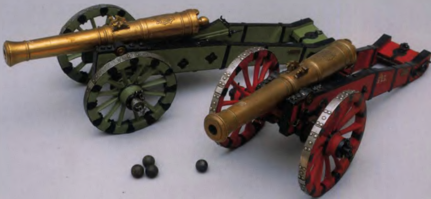
Осадные пушки последней четверти XVIII века

На картине изображены чины Гвардейской артиллерии на фоне фортификационных сооружений с установленными на них орудиями. В центре полотна на плетеной корзине сидит командир Л.-гв. 2-й Артиллерийской бригады генерал-майор М. А. Салтыков, одетый в офицерское пальто. Справа от него показаны еще два генерал-майора, один в парадной форме Гвардейской Конной артиллерии, другой в походной форме 3-й Гвардейской и Гренадерской артиллерийской бригады. Слева от генерала Салтыкова стоят два полковника в сюртуках с флигель-адъютантскими аксельбантами. На заднем плане картины изображены портупей-юнкер, а также штабс-капитан и поручик в повседневной и походной формах адъютантов гвардейской артиллерии. В левом углу полотна показаны военный аудитор и военный медик. За ними стоит рядовой Фурштатской команды Л.-гв. 1-й Артиллерийской бригады.