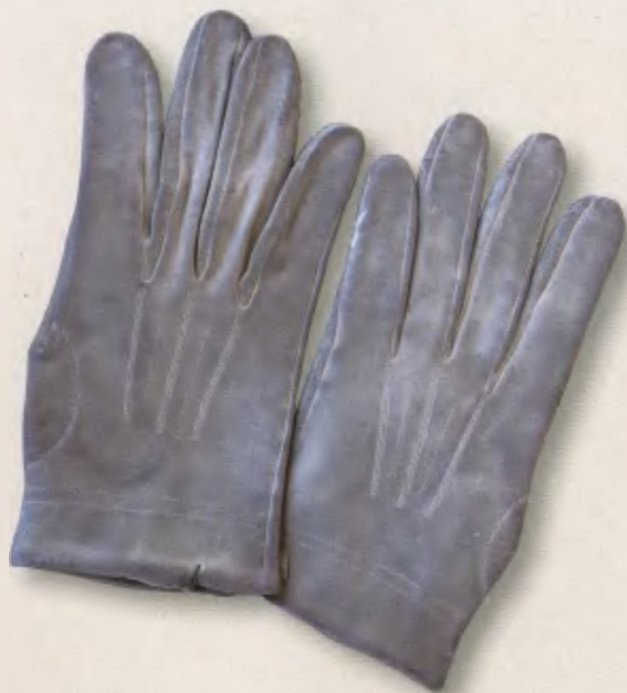
Перчатки дежурного офицера, на внутренней стороне которых шпаргалка с необходимыми данными