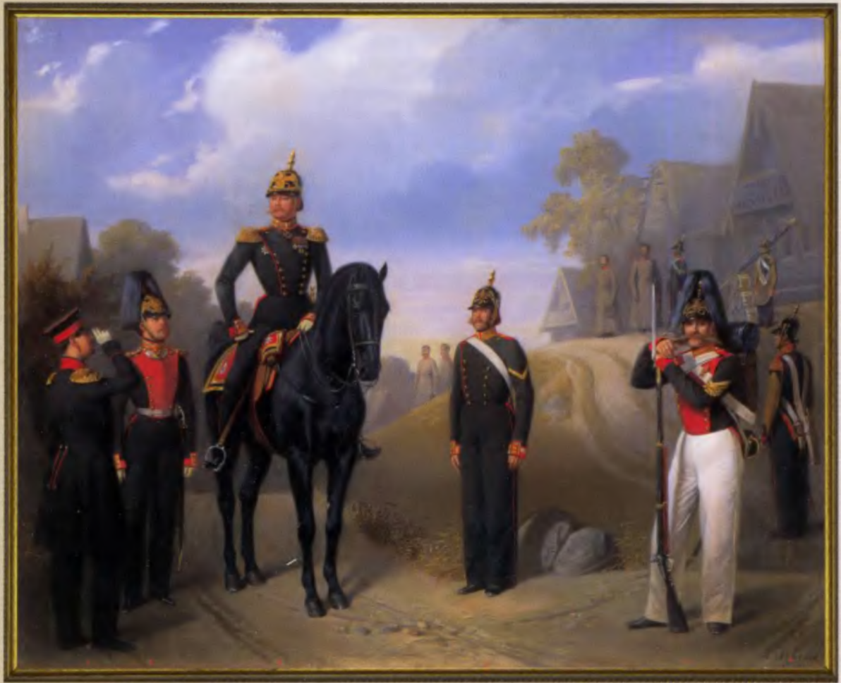
Группа офицеров и солдат Л.-гв. Московского полка