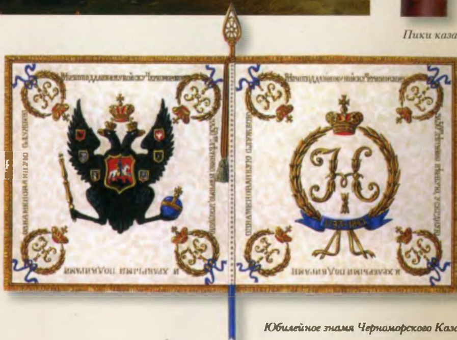
Юбилейное знамя Черноморского Казачьего Войска