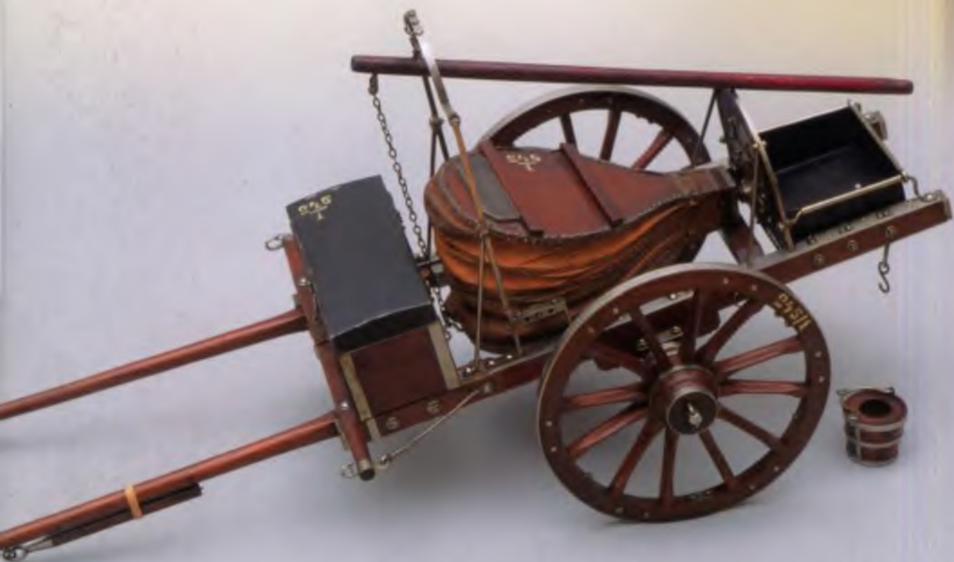
Походная кузница Русской армии середины XIX века

На картине изображены чины Л.-гв. Конной артиллерии на постое в деревне во время летних маневров. В левом углу полотна на скамье в обыкновенной городской форме сидит полковник. По всей видимости, это командир батареи, отдающий указания подчиненным. Рядом с ним стоят капитан и подпоручик, оба в обыкновенной форме, чуть дальше — вахмистр в летней и штаб-трубач в обыкновенной формах. В правом углу картины показаны двое фейерверкеров, один в летней, другой в парадной формах. На заднем плане хорошо видны нижние чины, следящие за водопоем конского состава. В глубине полотна двое ездоков занимаются выводкой лошадей.