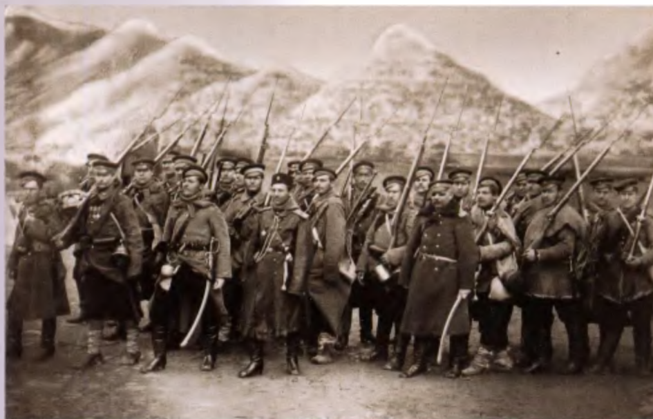
Фотография во второй половине XIX столетия стала серьезным конкурентом «репортажной живописи». На этой фотографии мы видим солдат Суздальского пехотного полка во время форсированного марша к Адрианополю в 1877 году