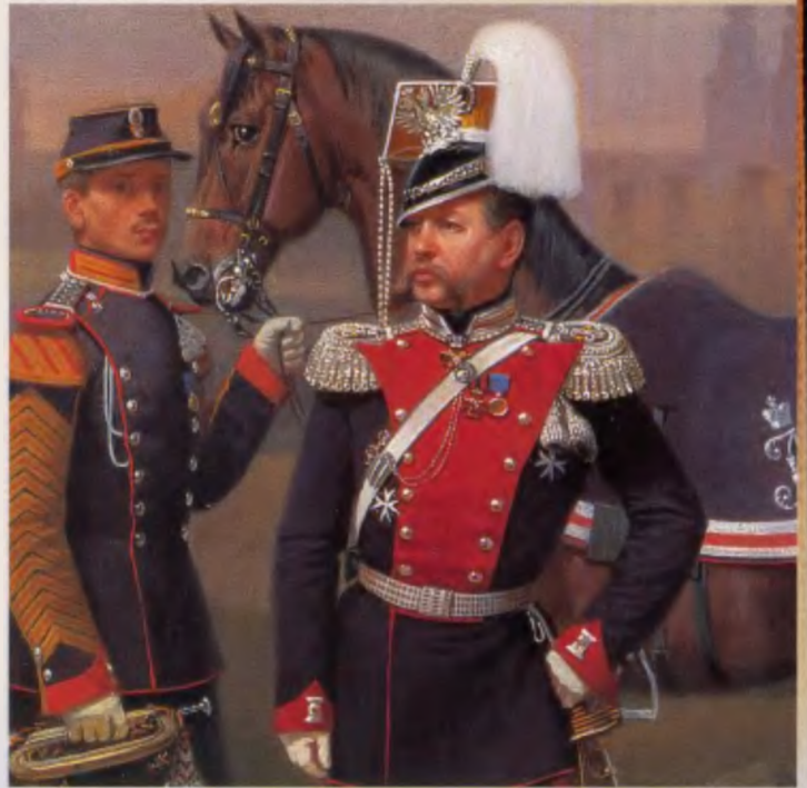
Офицерские уланские шапки 8-го уланского Вяземского и Л.-гв. Уланского Ея Величества полка. Принадлежали шефам этих полков Великой княжне Татьяне Николаевне и Императрице Александре Федоровне. ГМЗ «Царское Село»