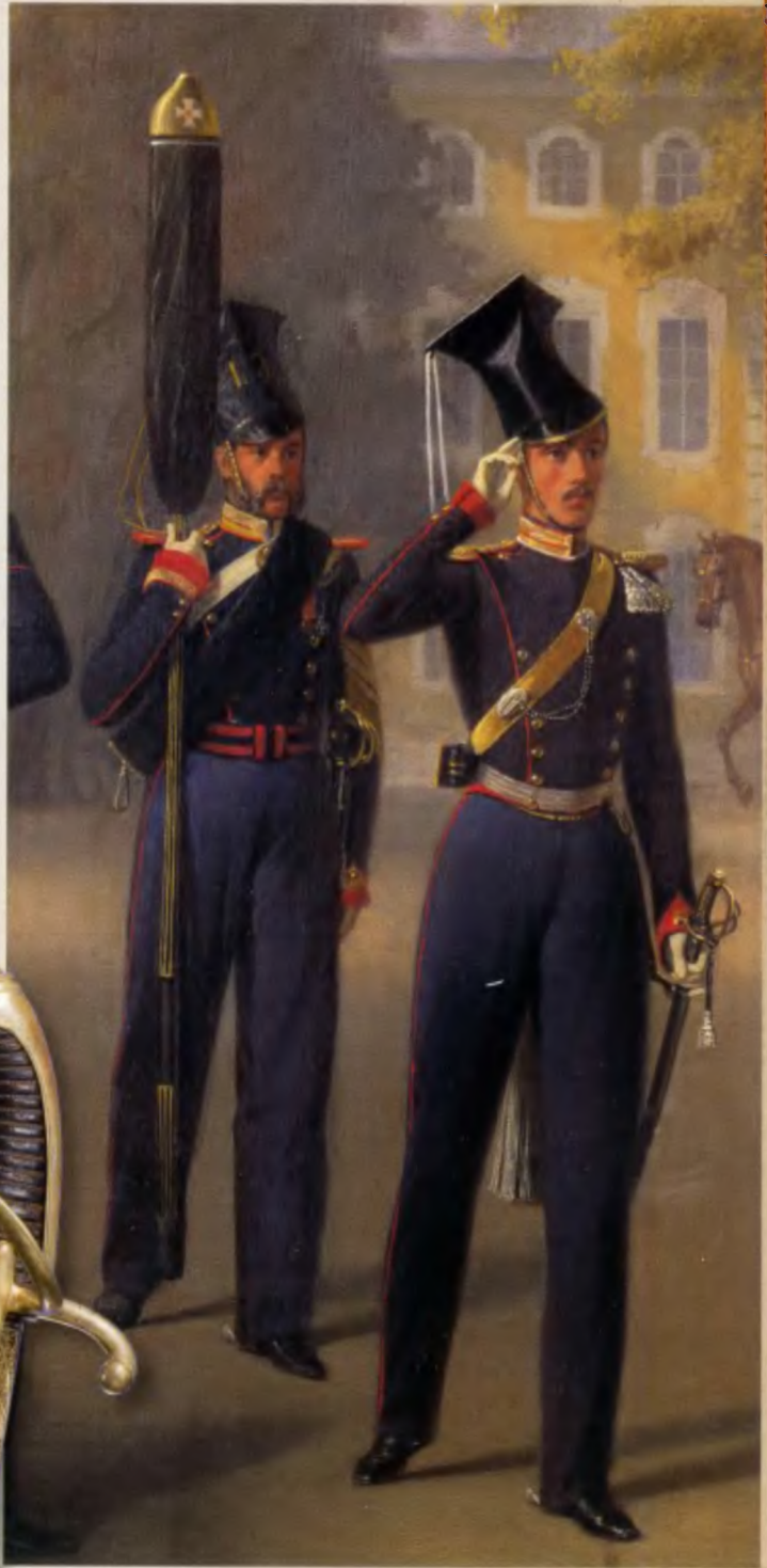
Офицерские кавалерийские сабли середины XIX века