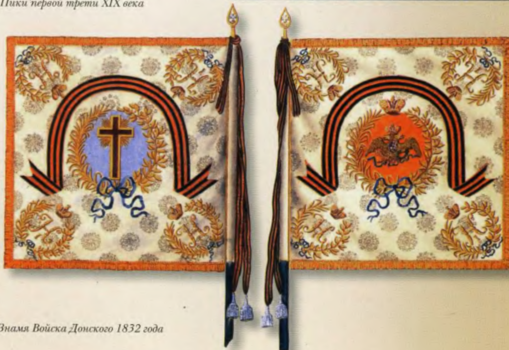
Знамя Войска Донского 1832 года