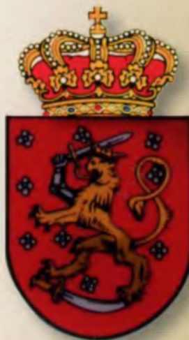
Герб Княжества Финляндского