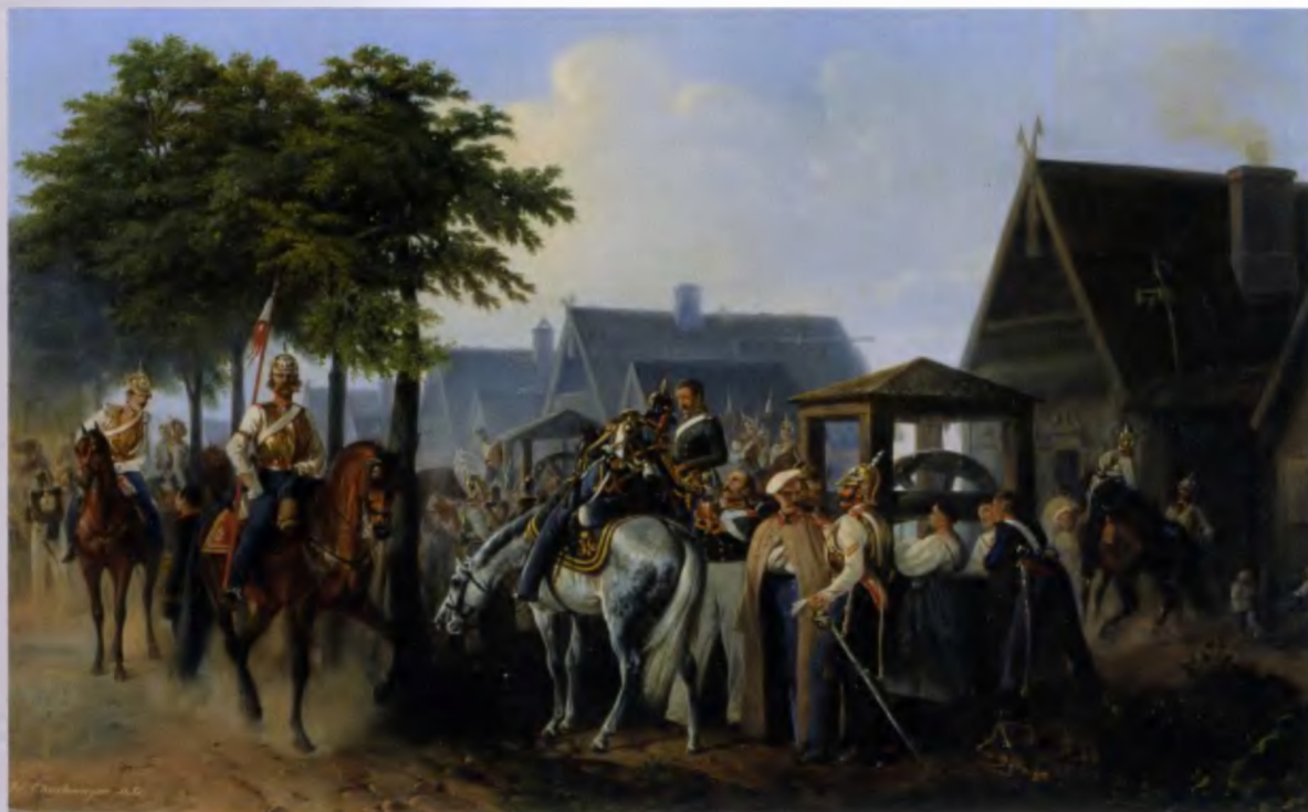
А. Шарлемань. Гвардейцы на постое в деревне во время летних маневров 1851 года. 1851 год

по всему, был не из робкого десятка. Ему шел 44-й год, из которых 20 было проведено в Петербурге. Мы не знаем, как проходила его командировка, т.к. в Россию он не вернулся. Вероятно, до Варшавы художник все-таки добрался и зарисовки сделал, ибо заказанные полотна впоследствии он присылал. Может быть, врожденная любовь к свободе не давала ему свыкнуться с тем, что его стали посылать в командировки, как раньше не позволяла устроиться на государственную службу, или какие-то другие соображения заставили его покинуть пределы России, остается лишь догадываться. Гебенс уехал в Германию и поселился в Берлине по адресу Tempelhofer Ufer № 23, откуда и продолжал слать в Россию свои картины. Весь 1864 год приходили картины с изображениями солдат и офицеров частей Варшавского корпуса: Л.-гв. Конная артиллерия, Гренадерский Императора Австрийского (так назывался в то время Кексгольмский гренадерский) полк, Гренадерский Короля Прусского (Санкт-Петербургский гренадерский) полк, Л.-гв. Волынский полк и Л.-гв. Второй стрелковый батальон. Следующий год ознаменовался лишь двумя присланными работами. Неизвестно, были ли они заказаны или созданы по инициативе самого художника, не желавшего порывать с Россией. Они исполнялись «на местном материале» и изображали солдат и офицеров 3-го уланского Прусского и 6-го кирасирского Бранденбургского полков, шефами которых были члены российской императорской семьи. Картины были оплачены как обычно.