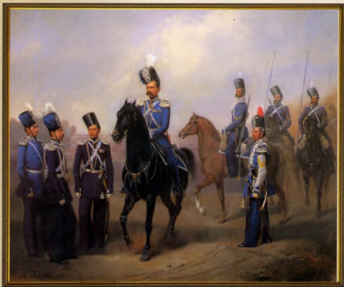
Группа чинов Лейб-Атаманского Его Императорского Высочества Наследника Цесаревича полка