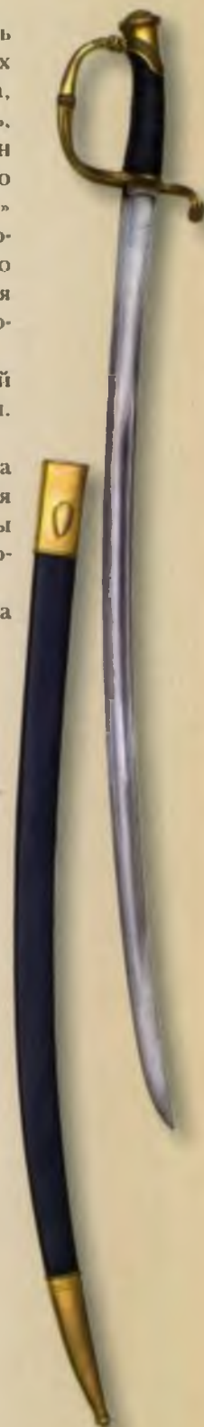
Офицерская пехотная сабля обр. 1826 года