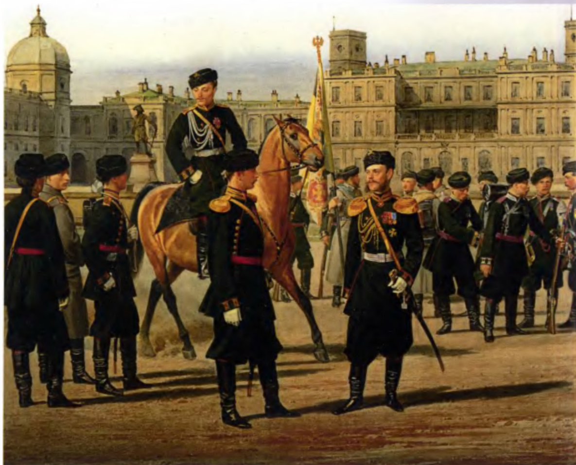
К. Пиратский. Чины Л-го, 4-го Стрелкового Императорской фамилии батальона на фоне Гатчинского дворца. 1864 год

работы, созданные и выставлявшиеся в последний период его жизни, он умер настолько неизвестным, что в европейских искусствоведческих справочниках нет даже единого мнения о его национальности. Германский художественный лексикон представляет Гебенса шведским художником, работавшим в России. Французский словарь тоже называет его русским художником шведского происхождения. На первый взгляд то, что это русский художник подтверждается и выпиской из журналов собраний совета Академии художеств за 27 и 28 августа 1861 года: «... 4. Во утверждении искусства и познаний в художествах, доказанных отличными работами по заданным от Академии программам и по другим известным трудам, признаны академиками: по архитектуре Иван Слупский и Федор Клагерс; по живописи исторической и портретной Александр Нотбек, Иван Келлер, Леонид Воротилкин и иностранный художник Андрей Беллони; по скульптуре животных — почетный вольный общинник Николай Либерих; по живописи народных сцен Константин Трутовский, Николай Шильдер и Адольф Гебенс и по живописи животных иностранный художник Карл