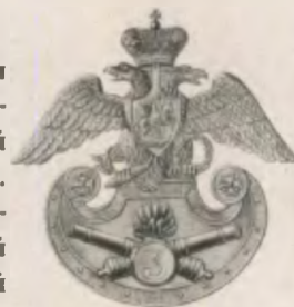
Киевский герб Гренадерских Артиллерийских бригад, 1828 год

28 декабря 1833 года была образована 3-я Гвардейская и Гренадерская артиллерийская бригада (бывшая Сводная гвардейская и Гренадерская артбригада 6-го пехотного корпуса). Батарейный праздник — 6 декабря. В состав этой новой части вошли: Батарейная рота № 5, Батарейная рота № 6 и Легкая рота № 3. Чуть позже все роты стали именоваться батареями. Художник продемонстрировал главные мундирные различия батарей. У чинов 5-й и 6-й батарей на воротниках золотые петлицы, которых нет у артиллеристов легкой батареи.