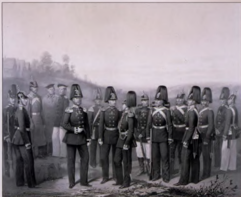
Пехота Гренадерского корпуса. 1861 г. Литография Смирнова