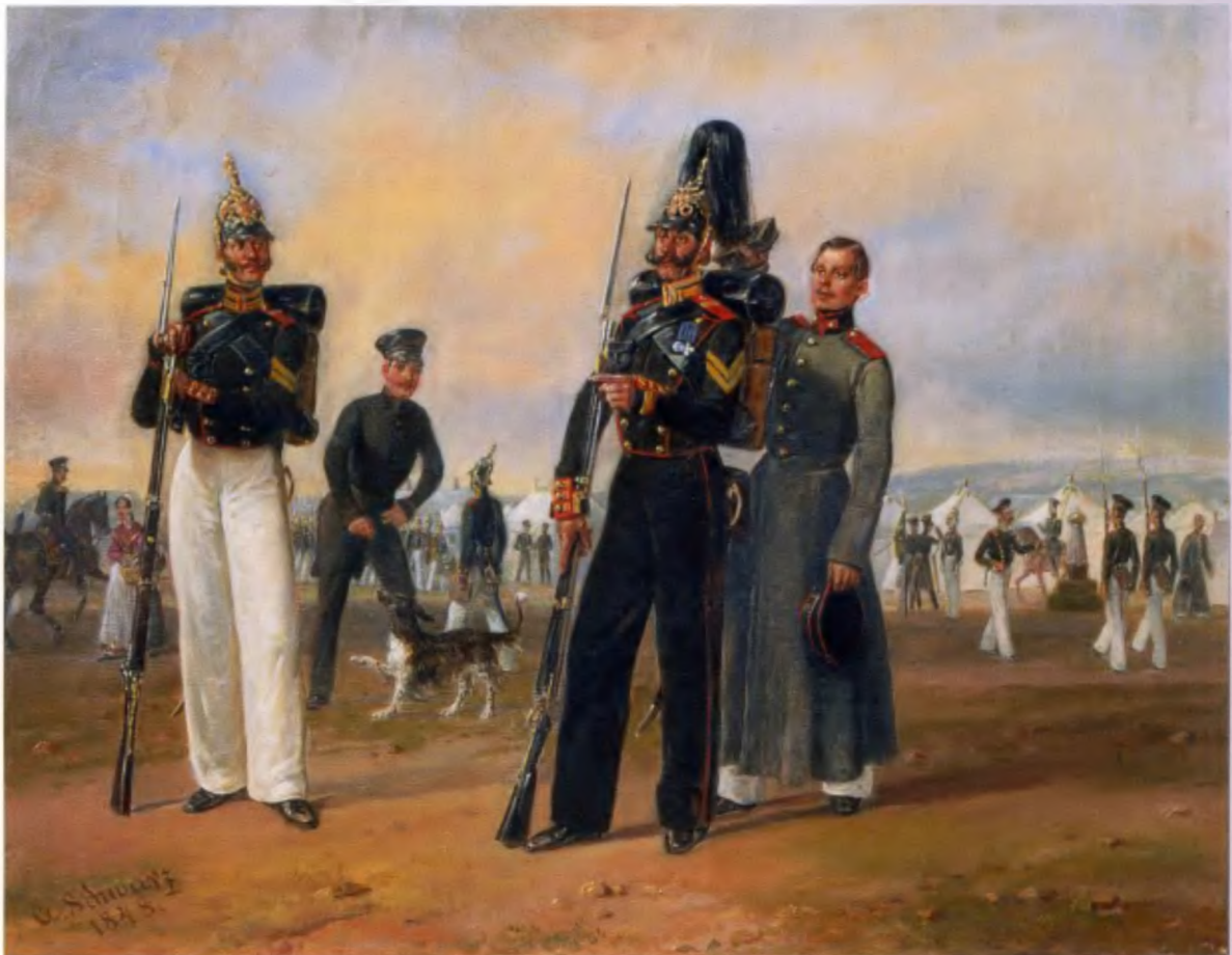
Г. Шварц. Летний лагерь Л.-гв. Преображенского полка. 1848 год

А. Е. Коцебу (1815–1889), «историограф русской военной славы», получил военное образование во втором кадетском корпусе в Санкт-Петербурге. Будучи офицером в Литовском пехотном полку, он одновременно посещал классы Академии художеств. В отличие от своего учителя, был приверженцем классической батальной школы, тяготел к парадности и условности панорамных батальных картин XVIII века, откуда и гигантские размеры его полотен. Для Коцебу характерно создание циклов батальных картин панорамного типа – огромных пространств, на которых разворачивается действие. Таков