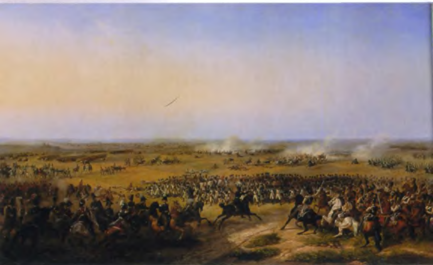
В. Тимм. Сражение при Фершампенуазе 13 марта 1814 года. 1839 год