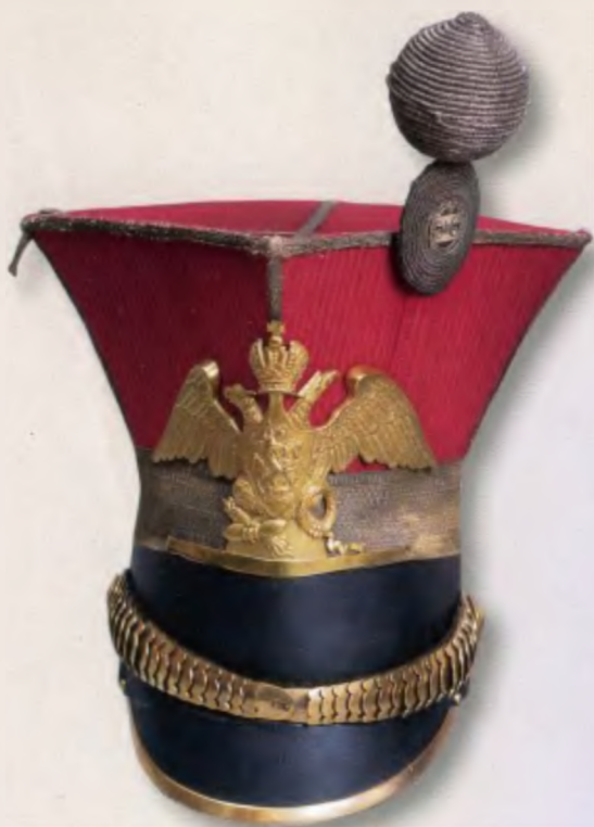
Уланская шапка середины 1830-х годов