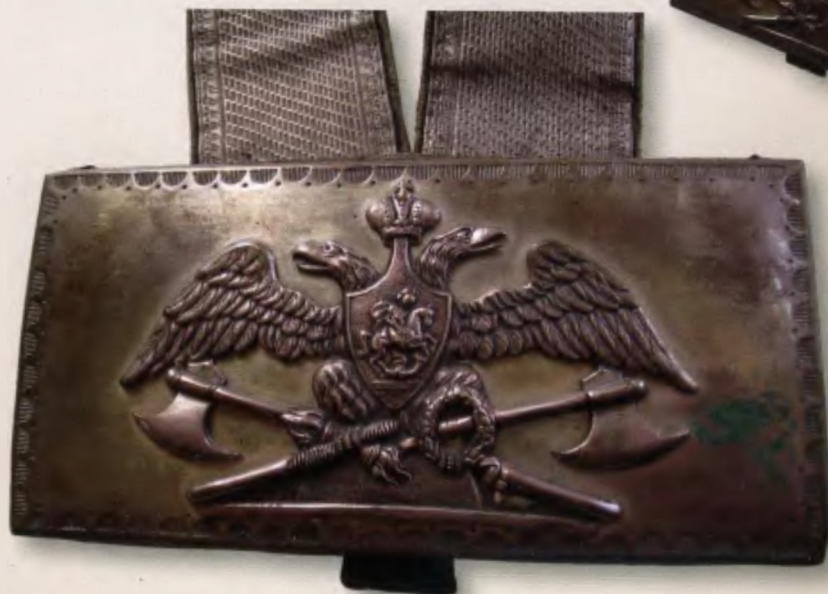
Ляпунок офицера Л-гв. Конно-Пионерного эскадрона