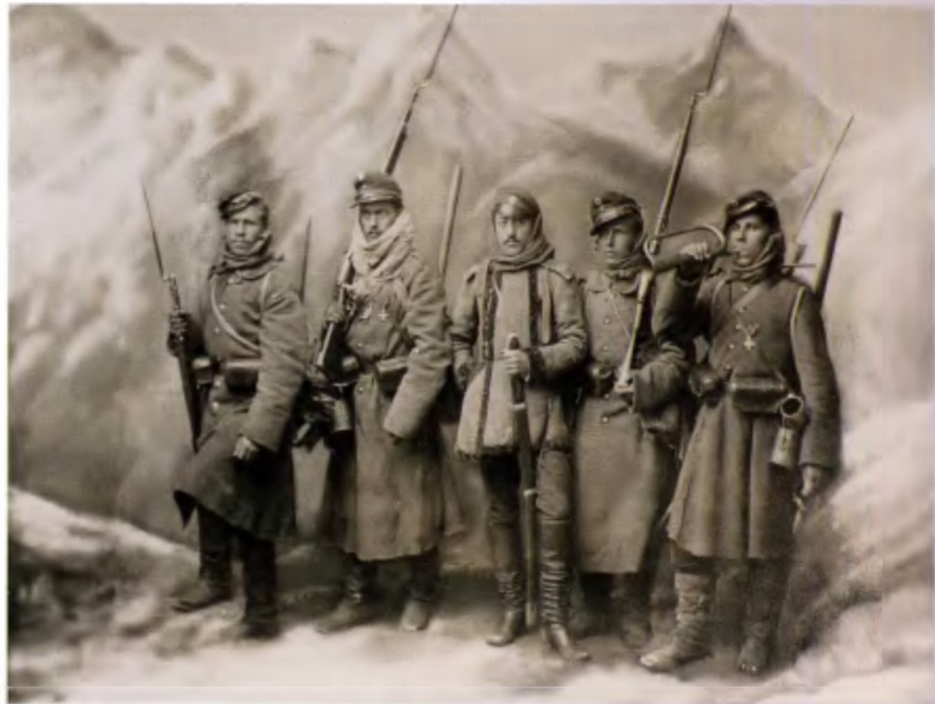
Солдаты Судауского пехотного полка на Балканах в 1877 году

Самым полным собранием работ Гебенса, но в другом исполнении, обладает Государ-