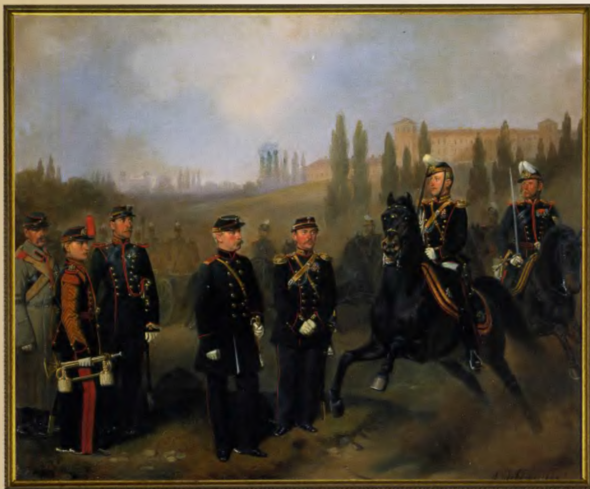
Группа военных чинов 3-й батареи Гвардейской Конной артиллерии