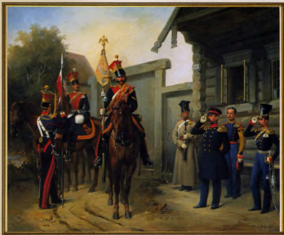
Группа военных чинов Л.-гв. Уланского полка