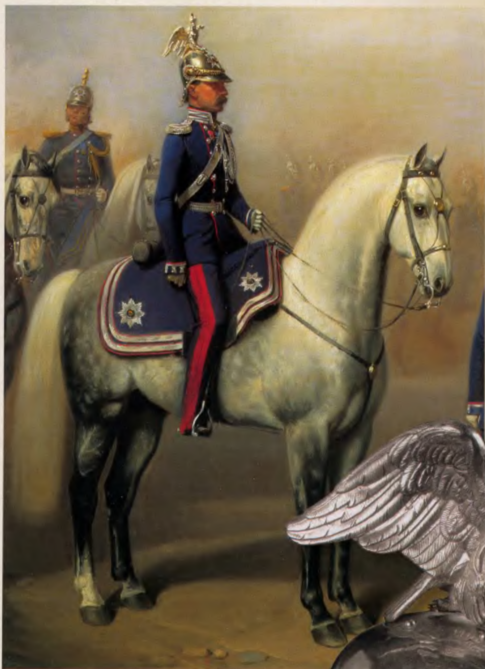
Каска офицера Гвардейского Жандармского полускадрона