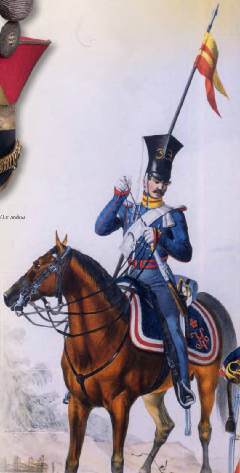
Улан 1830-х годов (раскрашенная литография)