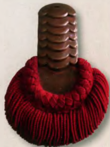
Эполет к парадной форме рядового Л.-гв. Конно-Гренадерского полка