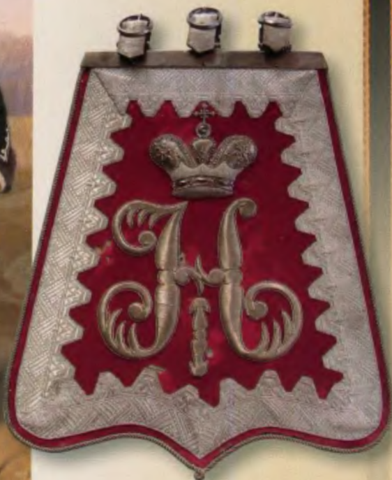
Ташика офицера Л.-эв. Гродненского Гусарского полка