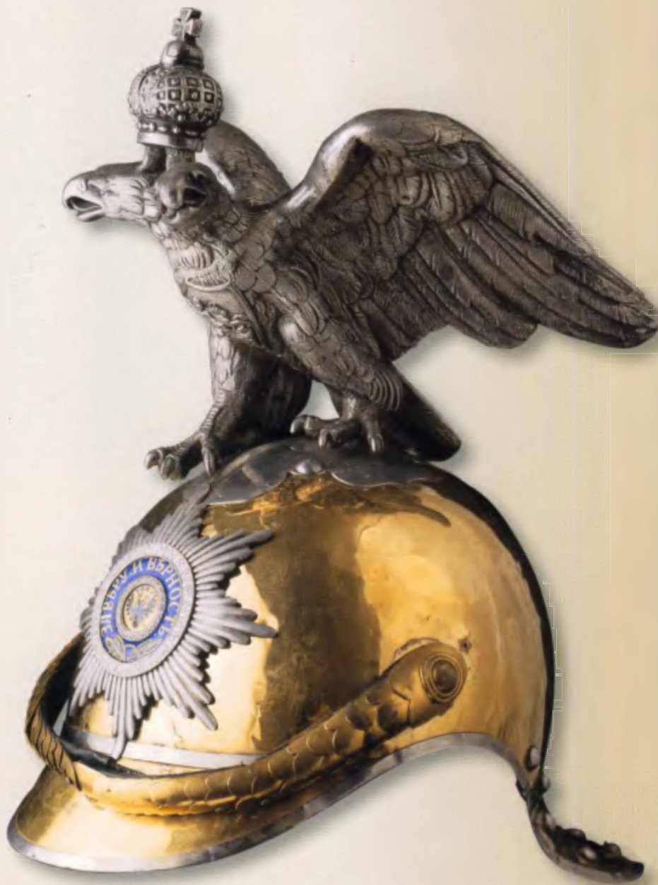
Каска офицера Л.-гв. Кирасирского Его Величества полка