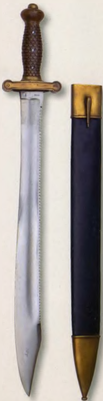
Тесах саперный солдатский. Экспериментальный образец 1833 года