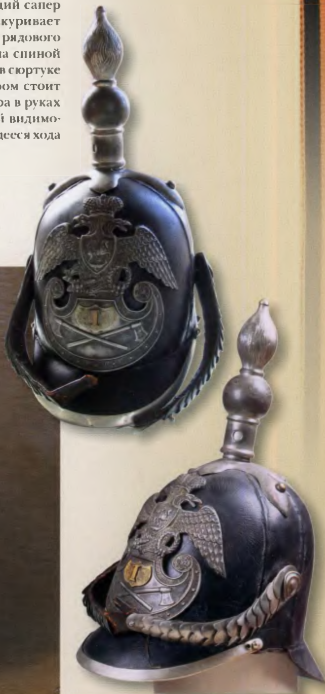
Каска гвардейских инженеров 1844 года