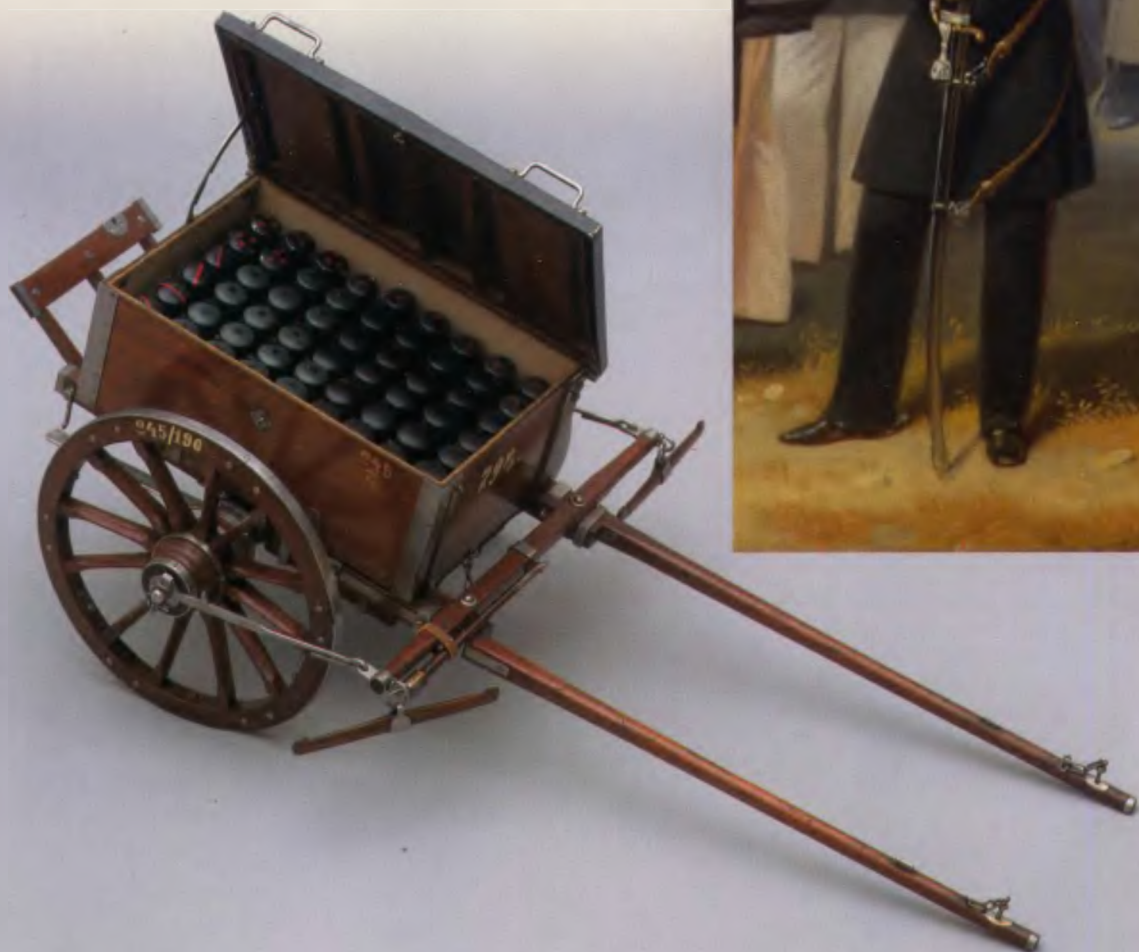
Пушечный зарядный ящик обр. 1845 года