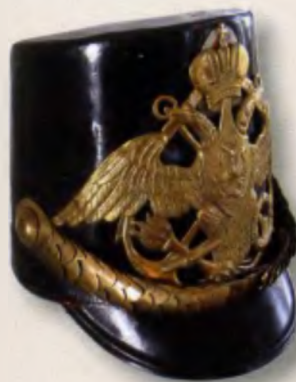
Кивер моряка Гвардейского морского экипажа

25 июня 1807 года в прусском городе Тильзите состоялась встреча двух императоров. Чтобы не было споров, на чьей земле происходит встреча, Александр I и Наполеон I уговорились встретиться на плоту, расположенном на середине реки Неман. Разумеется, собравшиеся на берегу зрители ждали наиболее эффектного зрелища — одновременного вступления вершителей судеб Европы