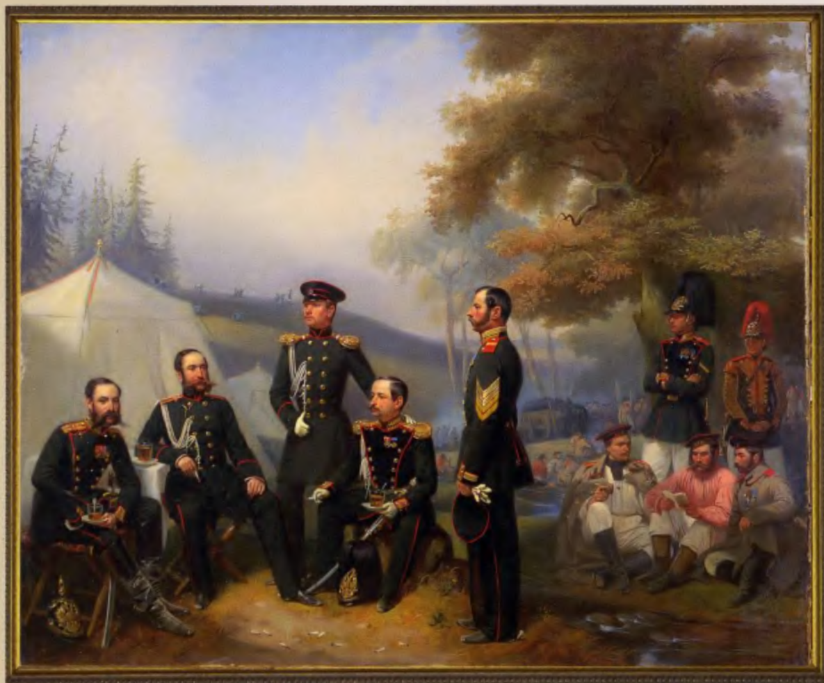
Группа военных чинов 3-й батареейной батареи Л.-гв. 2-й Артиллерийской бригады

Полотно 1859 года, 67,5х56, холст, масло