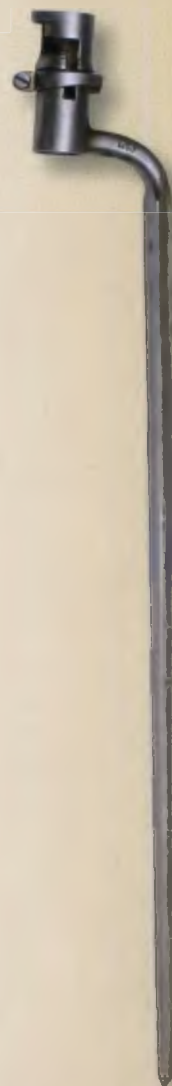
Штык к пехотному ружью обр. 1828 года.