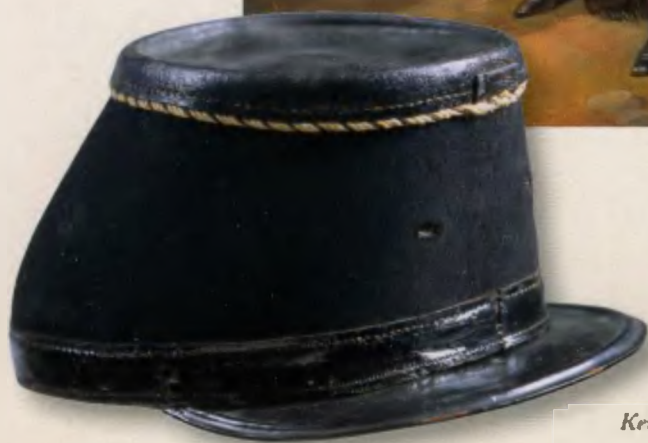
Кети солдата пехоты 1862–1882 годов