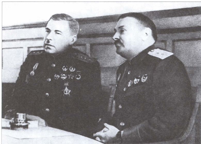
Командующий Ленинградским фронтом Л.А. Говоров (слева) и член Военного совета фронта секретарь ЦК ВКП(б) А.А. Жданов