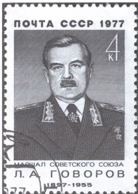
Советская почтовая марка, выпущенная в честь маршала Советского Союза Л.А. Говорова. 1977 г.