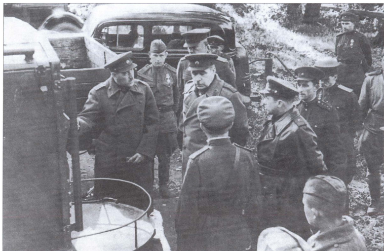
Командующий войсками Ленинградского фронта Л.А. Говоров с группой офицеров осматривает выставку автотехники