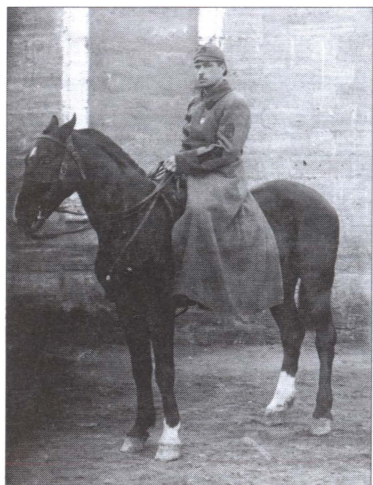
Л.А. Говоров. 1920-е гг.