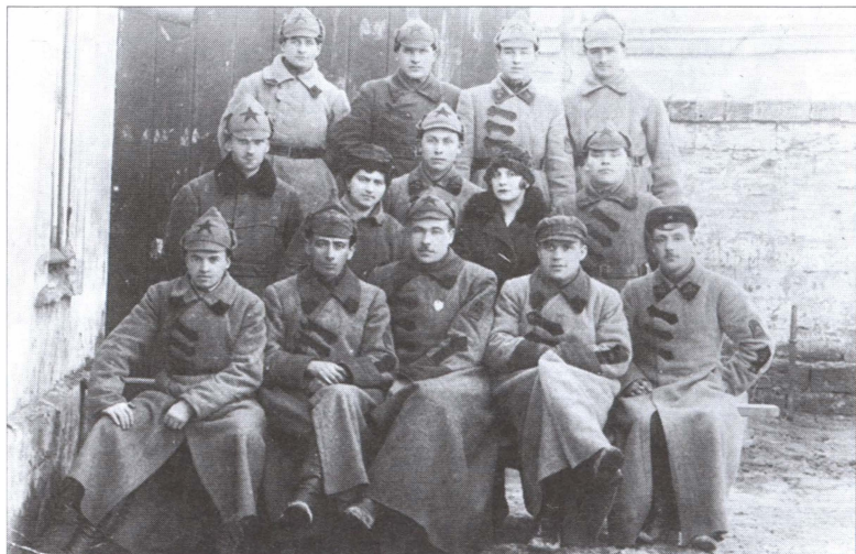
Л.А. Говоров среди красноармейцев. 1920-е гг.