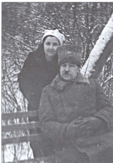
Маршал Советского Союза Л.А. Говоров с супругой в послевоенные годы