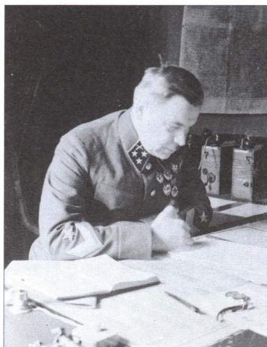
Генерал-лейтенант артиллерии Л.А. Говоров за рабочим столом