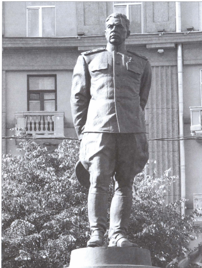
Памятник маршалу Л.А. Говорову на площади Стачек в Санкт-Петербурге