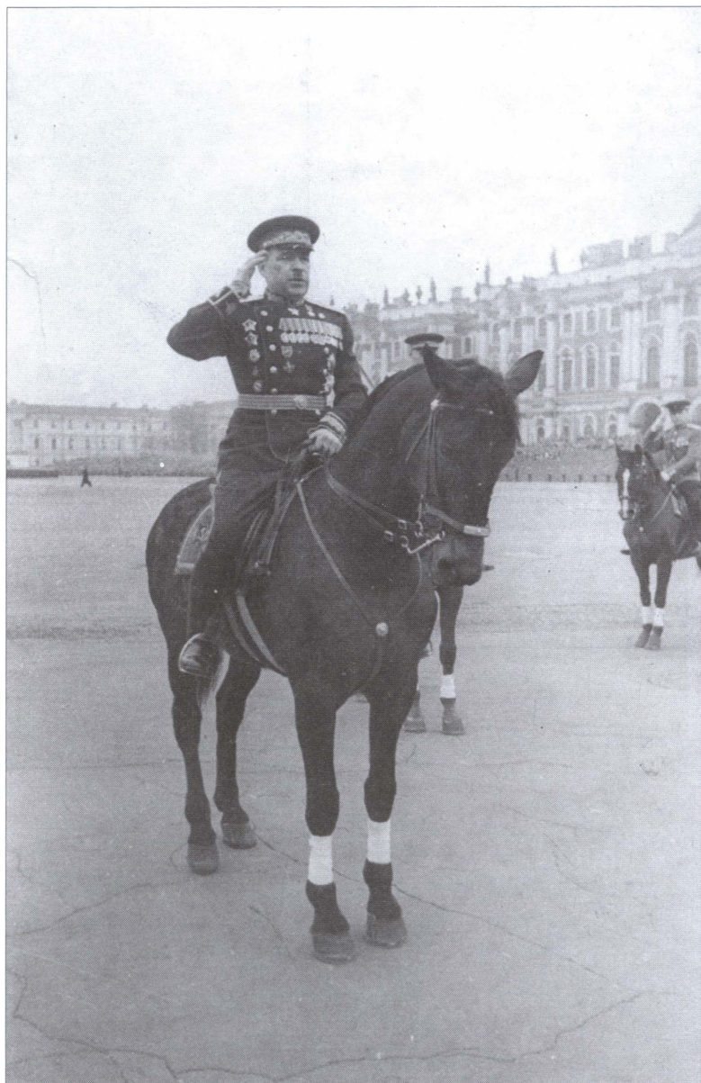
Маршал Советского Союза Л.А. Говоров. Ленинград. 1950-е гг.