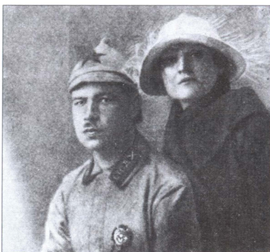
Л.А. Говоров с супругой. 1923 г.