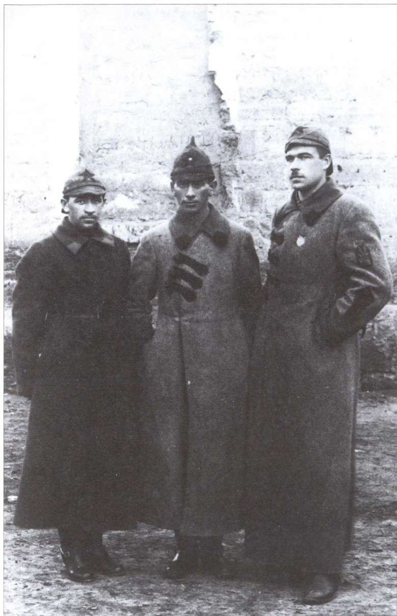
Л.А. Говоров с сослуживцами. 1920-е гг.