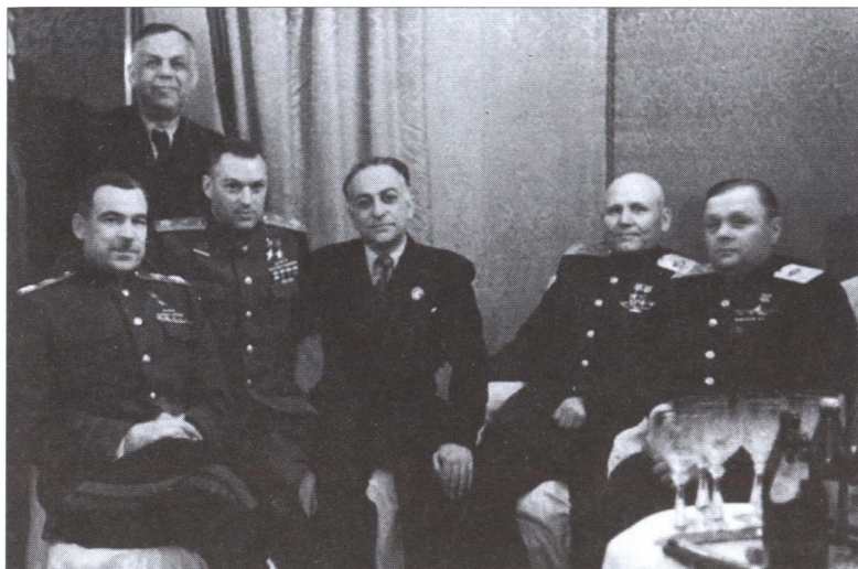
Маршалы Советского Союза Л.А. Говоров, К.К. Рокоссовский, И.С. Конев и К.А. Мерецков в гостях у главного режиссера Театра им. Е. Вахтангова Р.Н. Симонова