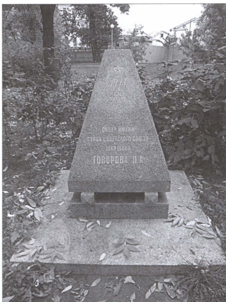
Памятный знак в сквере им. Героя Советского Союза маршала Л.А. Говорова в Санкт-Петербурге