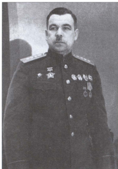
Генерал армии Л.А. Говоров