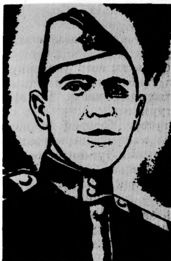
Герой Советского Союза Е. И. БУРЫХИН