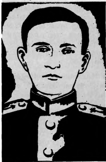
Герой Советского Союза Н. В. СЕРОВ