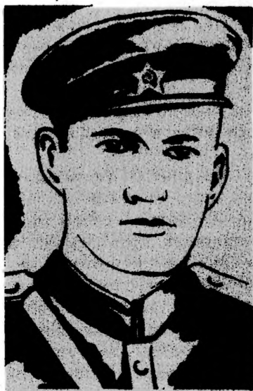
Герой Советского Союза Ю. Н. МАЛАХОВ