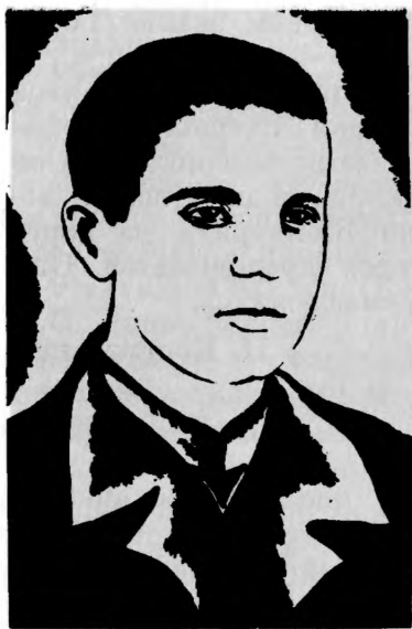
Герой Советского Союза В. К. ШЕВЧУК