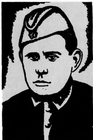
Герой Советского Союза Н. М. БРОВЦЕВ