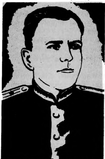
Герой Советского Союза А. И. РЕНЗАЕВ