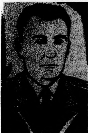
Герой Советского Союза М. М. БАРСУКОВ