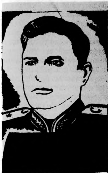
Герой Советского Союза Н. Ф. ПАПИВИН