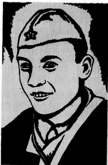
Герой Советского Союза В. С. ГОЛОВКИН