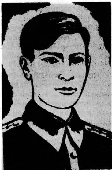
Герой Советского Союза В. Л. ХУДЯКОВ