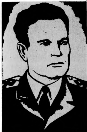
Герой Социалистического Труда Г. К. ПРОКУС