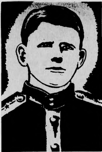
Герой Советского Союза В. Г. ВЛАДЫСЕВ