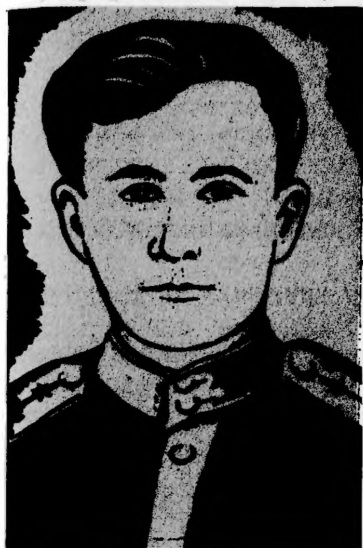
Герой Советского Союза Г. П. ПОЛУЯНОВ