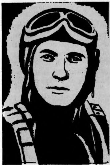
Герой Советского Союза В. Г. КОЗЕНКОВ