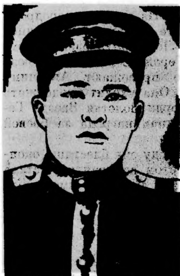
Герой Советского Союза Т. КАБИЛОВ