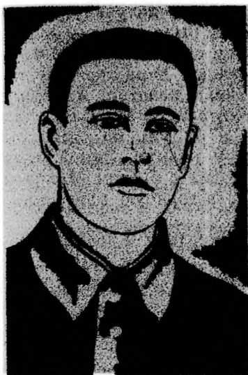
Герой Советского Союза И. И. ДВОРСКИЙ