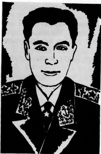
Герой Советского Союза И. И. БОРЗОВ