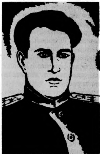
Герой Советского Союза Г. Э. ГУСЕЙНОВ