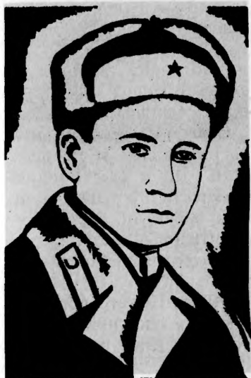
Герой Советского Союза В. Ф. ЛАПШИН