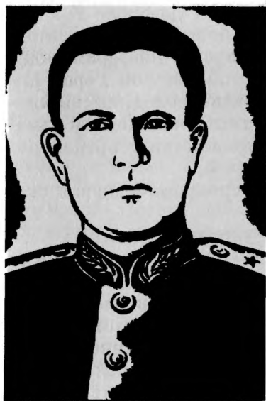
Герой Советского Союза Т. Т. ХРЮКИН