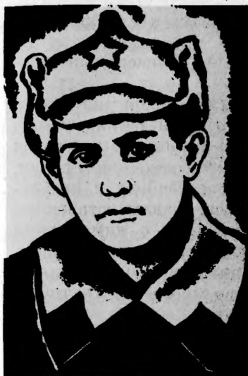
Герой Советского Союза Ш. Л. ГАМЦЕМЛИДЗЕ

«На свои плечи он поднял многотонный фашистский танк, поднял его и сбросил в бездну...» — так писал о подвиге младшего сержанта Шота Гамцемлидзе грузинский поэт Соломон Тавадзе.