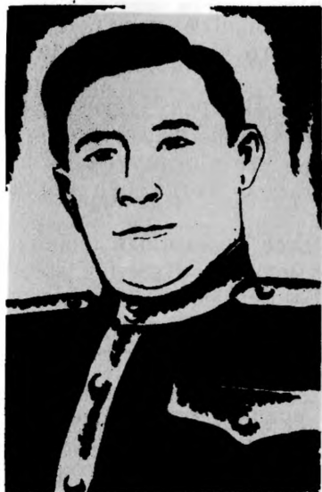
Герой Советского Союза Н. Г. ЦЫГАНОВ