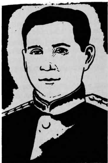
Герой Советского Союза Н. И. СЕМЕЙКО