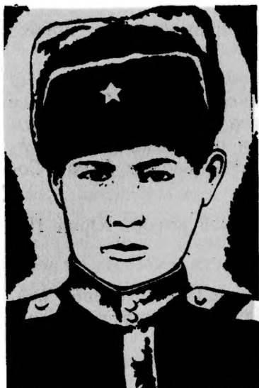
Герой Советского Союза З. МУСТАКИМОВ