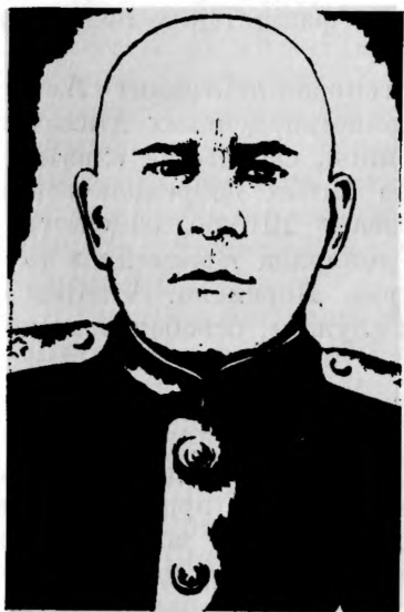
Герой Советского Союза А. И. ЛОПАТИН