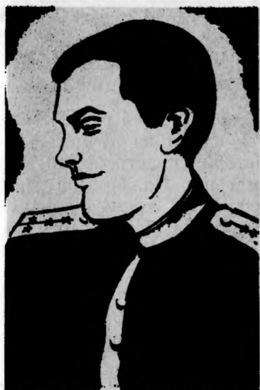
Герой Советского Союза Л. Б. НЕКРАСОВ