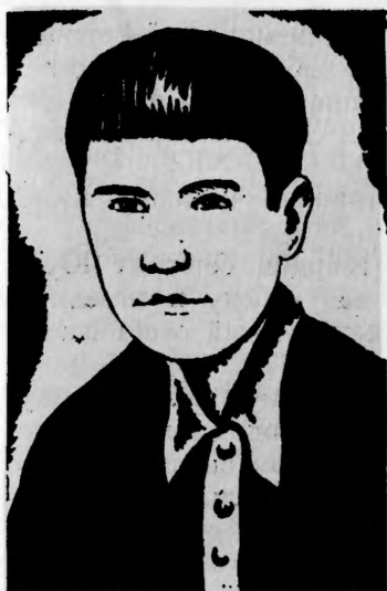
Герой Советского Союза Ю. Н. КОСТИКОВ