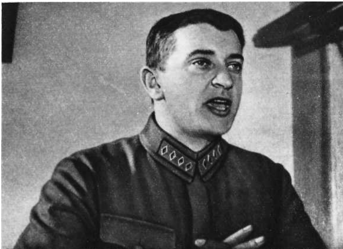
М. Н. Тухачевский читает лекцию в Военной академии им. М. В. Фрунзе (1928 г.)

Его выступление на академическом совете, о котором я сейчас рассказываю, закончилось под аплодисменты. Слушатели аплодировали, услышав нечто им близкое по классовому духу, отвечавшее их настроениям и думам. А профессора и преподаватели не могли не отдать должного эрудиции, широте и свободе мышления этого «офицера», ставшего начальником академии и удивительно соответствующего своему необычному назначению. Сильное впечатление произвели на них и умение Михаила Николаевича читать лекцию, его манера держаться на кафедре, такт, удивительное сочетание скромности и чувства собственного достоинства.