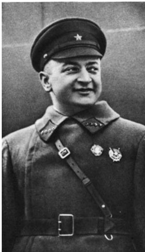
Михаил Николаевич ТУХАЧЕВСКИЙ