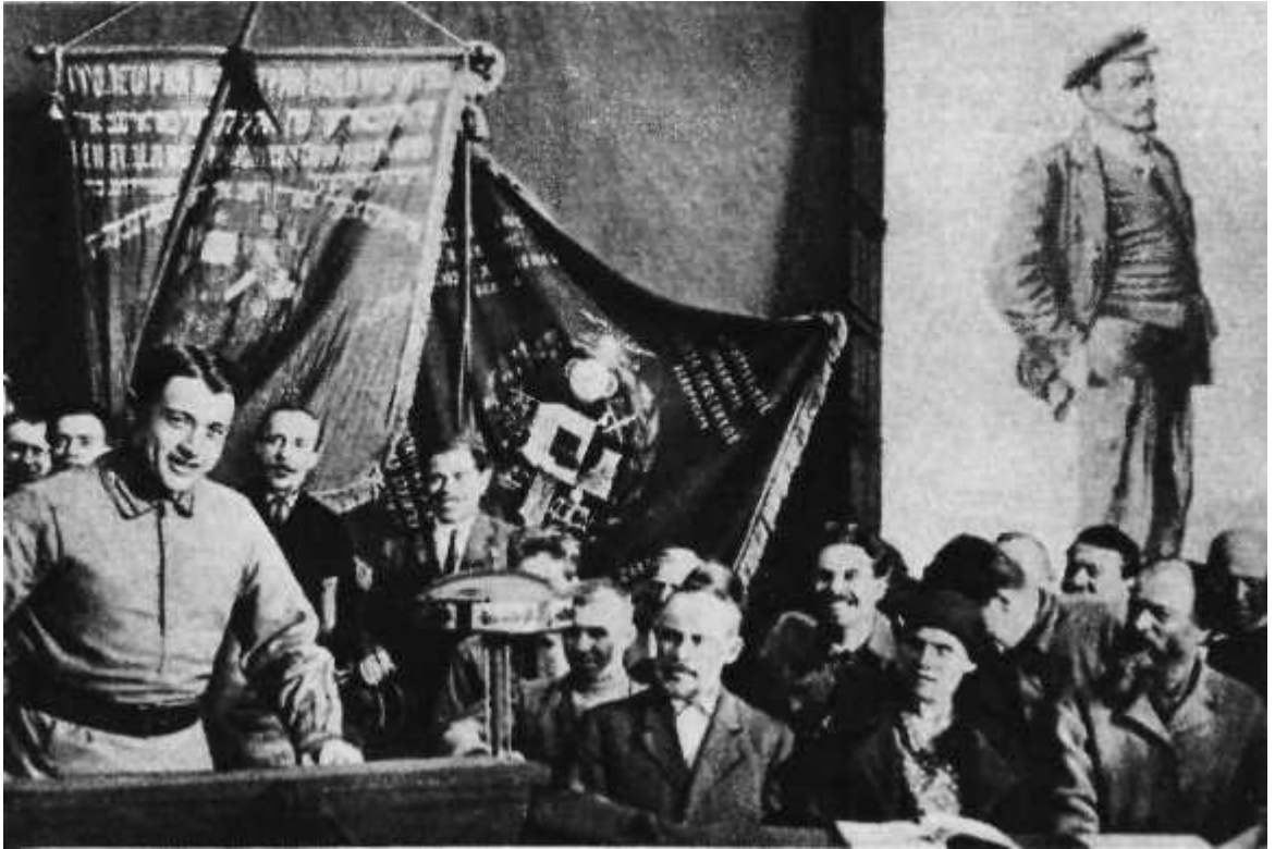
М. Н. Тухачевский на трибуне VII съезда Советов Белоруссии (1925 г.)

Симбирские коммунисты, естественно, связывали с новым командармом надежды на лучшее руководство войсками. И он не обманул этих надежд. Сразу же по вступлении Михаила Николаевича в командование 1-й Революционной последовала целая серия приказов, очень дельных по существу и бодрых по своему революционному духу. Группы войск преобразовывались в дивизии, штаб армии усиливался новыми работниками. Особенно важен был приказ о решительных мерах по укреплению революционной дисциплины.