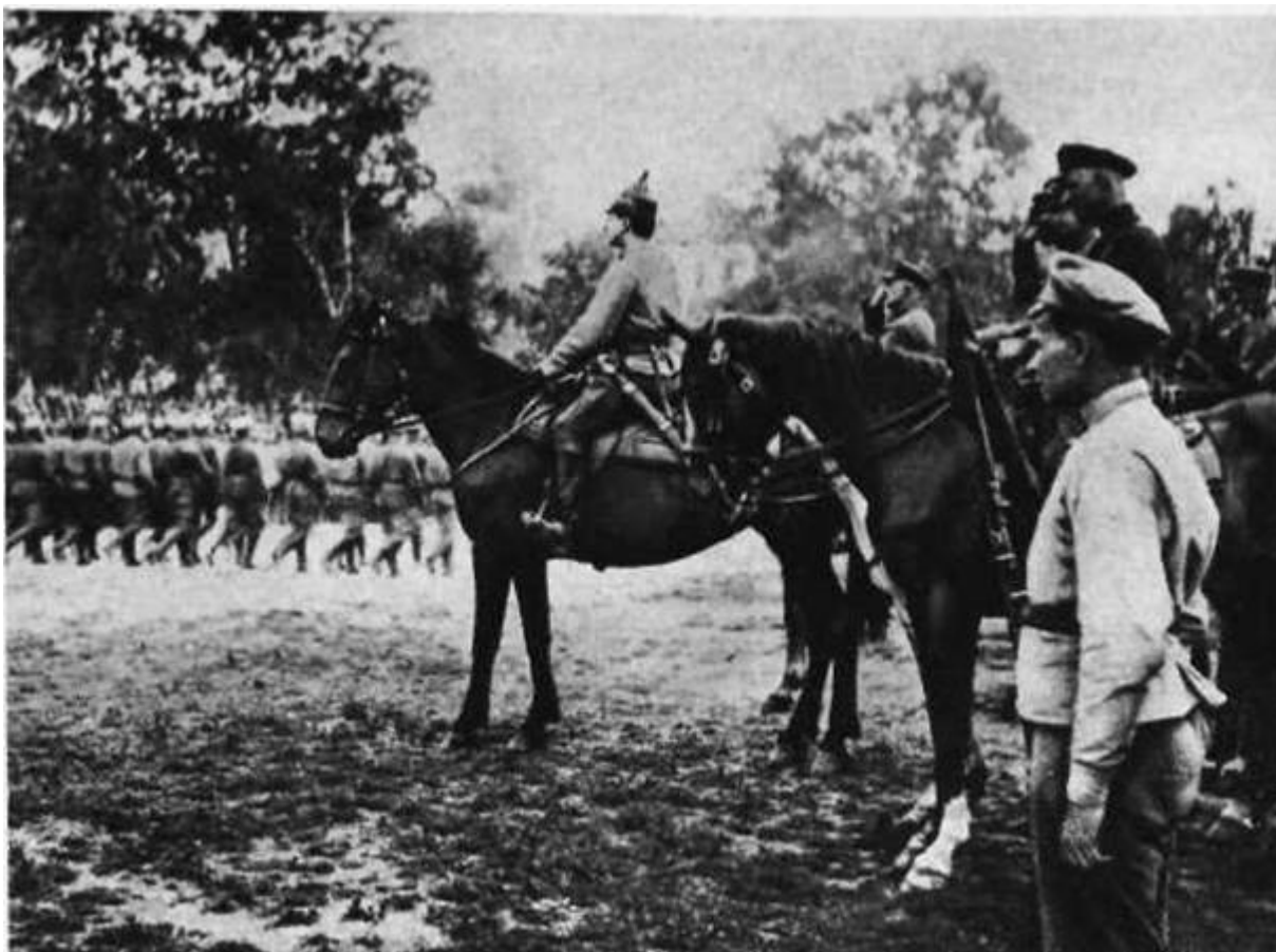
М. Н. Тухачевский на строевом смотре частей Западного фронта (1920 г.)

Моя первая встреча с М. Н. Тухачевским произошла в здании бывшего кадетского корпуса, где размещались губисполком и комитет РКП (б). Там я бывал ежедневно. Работа в политотделе Симбирской группы войск не освобождала меня от моих прежних обязанностей. Я, как и раньше, ведал в Симбирском комитете большевиков партийной техникой.