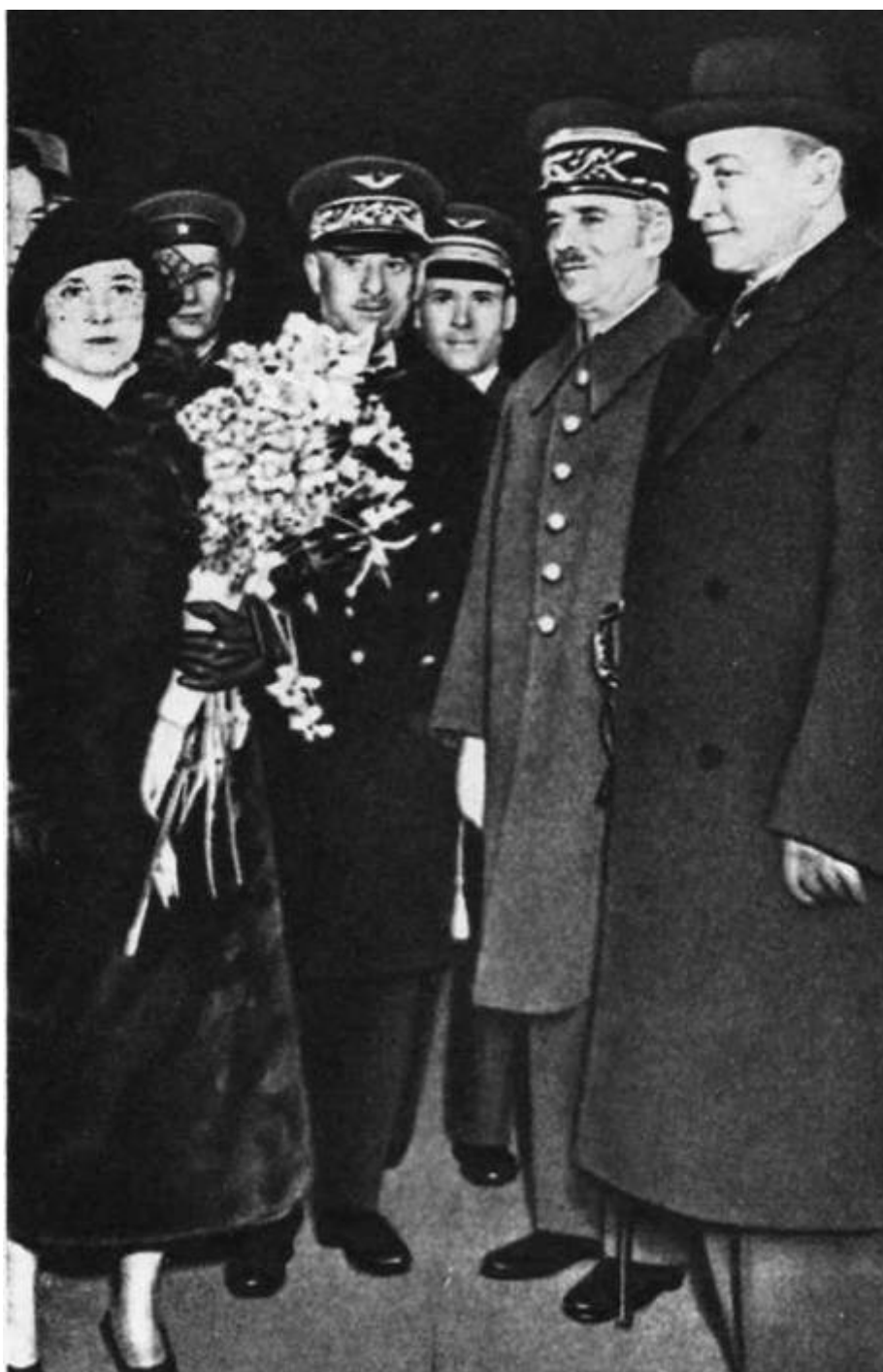
Поездка во Францию. Встреча М. Н. Тухачевского на Парижском вокзале