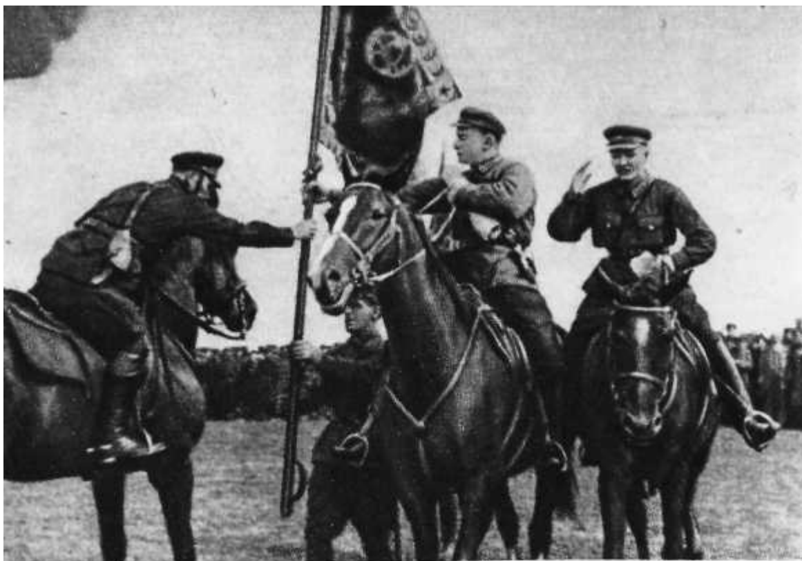
М. Н. Тухачевский на праздновании десятилетия 4-й кавалерийской дивизии (1929 г.)