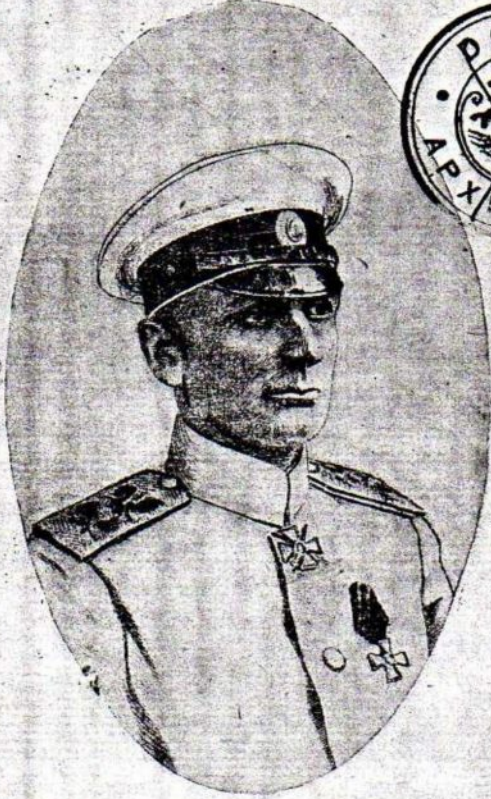
ВЕРХОВНЫЙ ПРАВИТЕЛЬ РОССИИ Адмиралъ А. В. КОЛЧАКЪ.