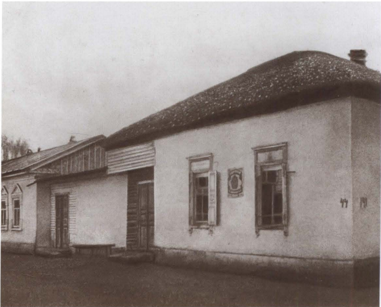
Дом в Пишпекке, где родился Михаил Фрунзе