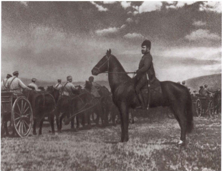
М. В. Фрунзе принимает войска в крепости Кушка