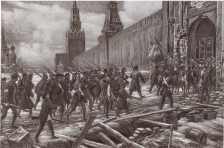
Вступление Красной гвардии в Кремль. Художник Э. Лисснер