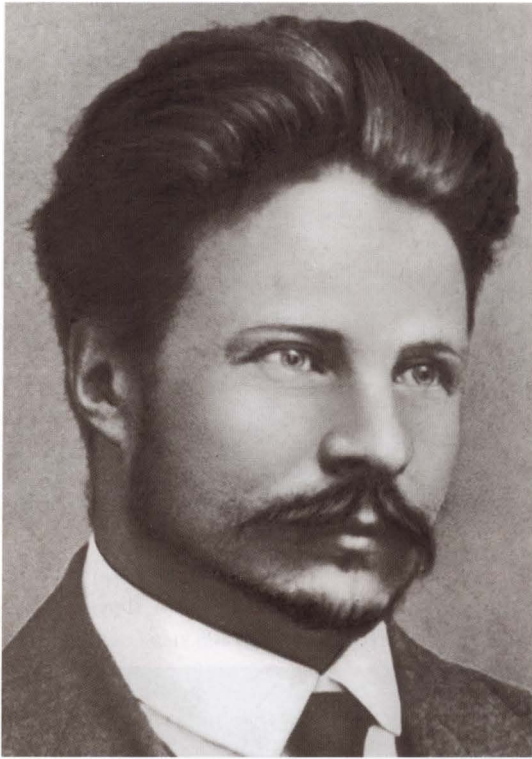
Фрунзе — «Василенко»