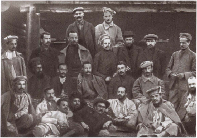
М. Фрунзе (в центре) в группе ссыльных