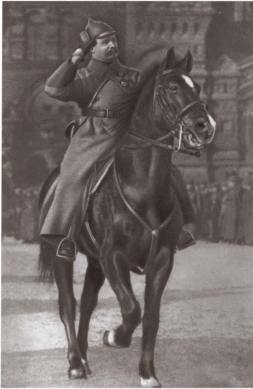
М. В. Фрунзе принимает парад войск на Красной площади в Москве. 1924 г.