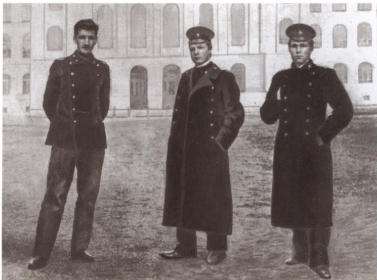
Михаил Фрунзе (крайний справа) с товарищами по институту