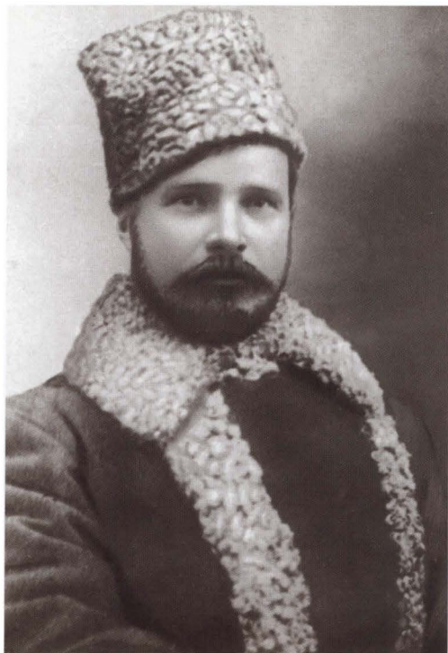
М. В. Фрунзе — командующий вооруженными силами Украины и Крыма