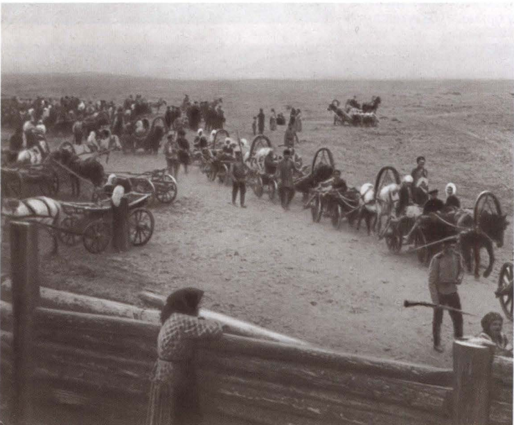
Партия ссыльных подходит к Манзурке