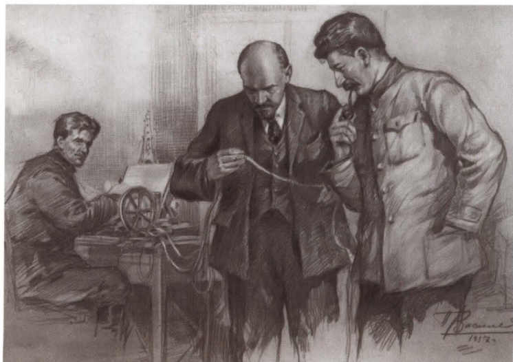
В. И. Ленин и И. С. Сталин у прямого провода.