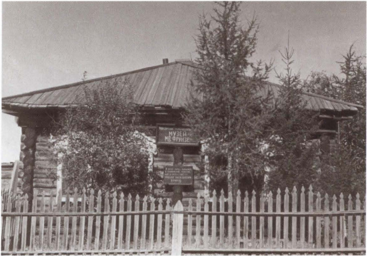
Дом в селе Манзурка, где М. В. Фрунзе жил в сибирской ссылке в 1914—1915 годах