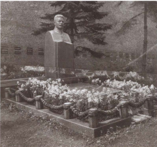
Могила М. В. Фрунзе на Красной площади у Кремлевской стены