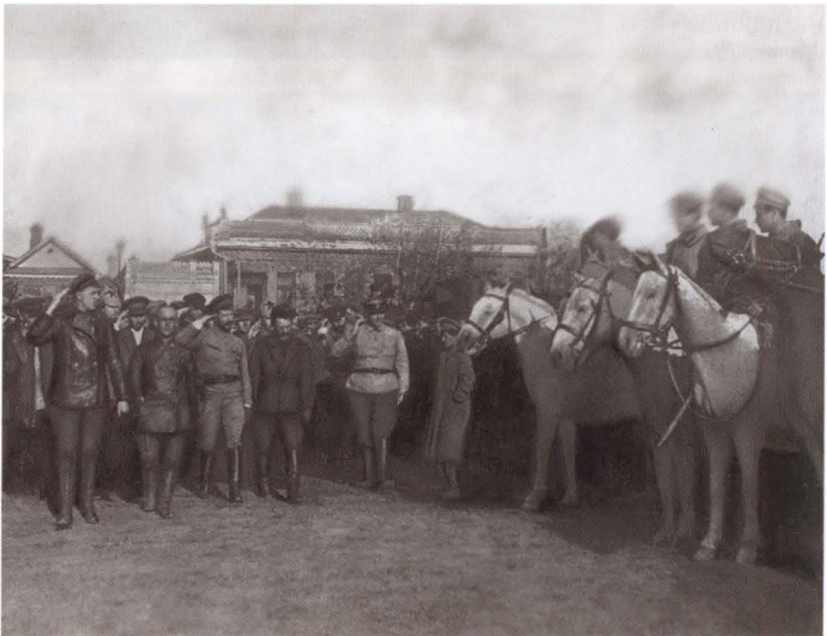
М. В. Фрунзе и М. И. Калинин. Туркестанский фронт. Оренбург, 1919 г.