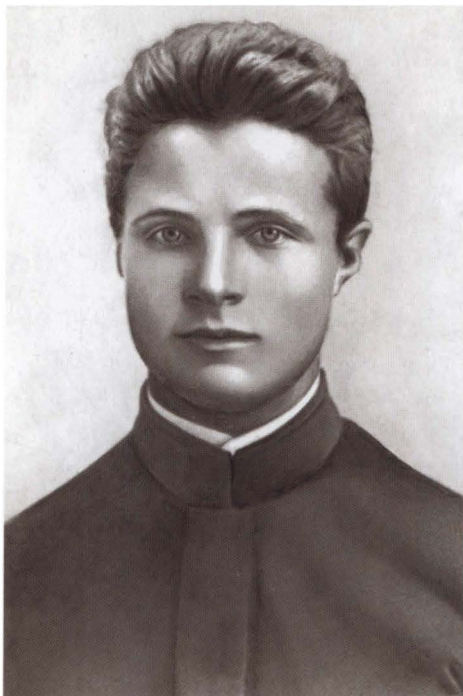
Михаил Фрунзе — выпускник гимназии. 1904 г.