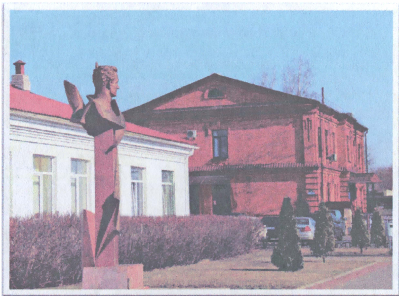
Двухэтажное здание Осиповичского железнодорожного вокзала, уцелевшее со времен Великой Отечественной войны.