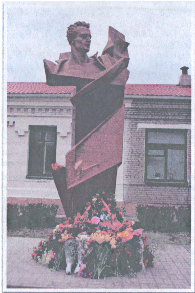
Памятник Федору Крыловичу на железнодорожном вокзале в г. Осиповичи.

Смотрит Федор на грохочущие грузовые составы, отправляющиеся как на восток, так и на запад, комфортабельные поезда с пассажирами, уверенными в своем настоящем и будущем, и радуется замечательным переменам в своем городе и светлому небу над головой, в чем, безусловно, есть и заслуга героя Крыловича.