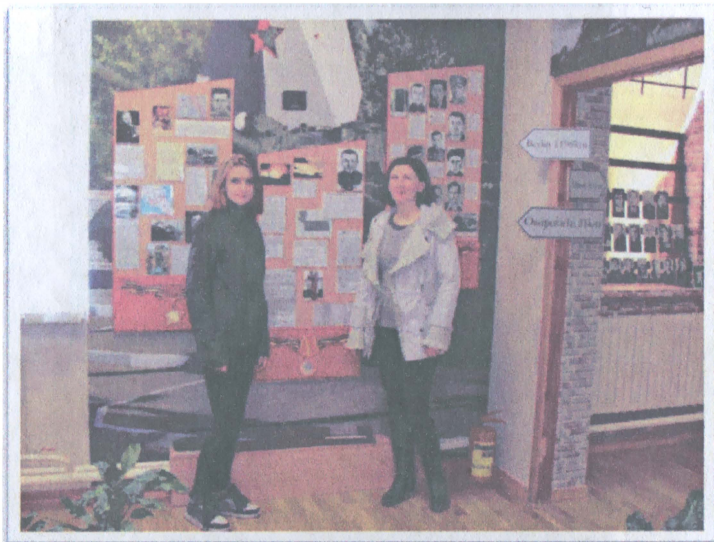
Внучка и правнучка Ф. Крыловича в Осиповичском историко-краеведческом музее.