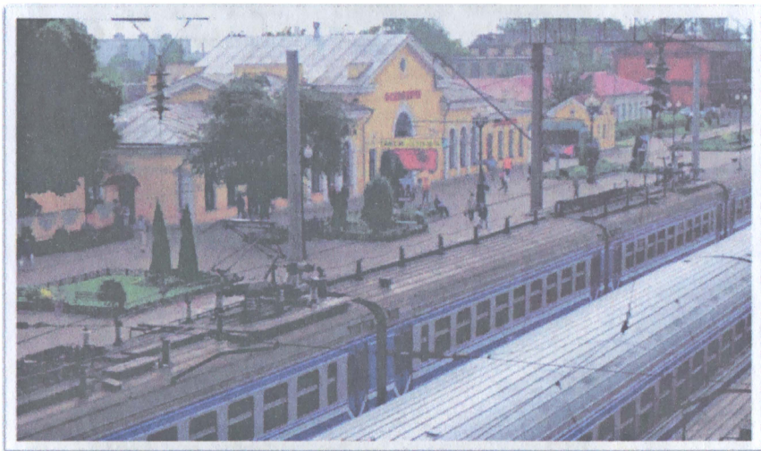
Современный вид Осиповичского железнодорожного вокзала.