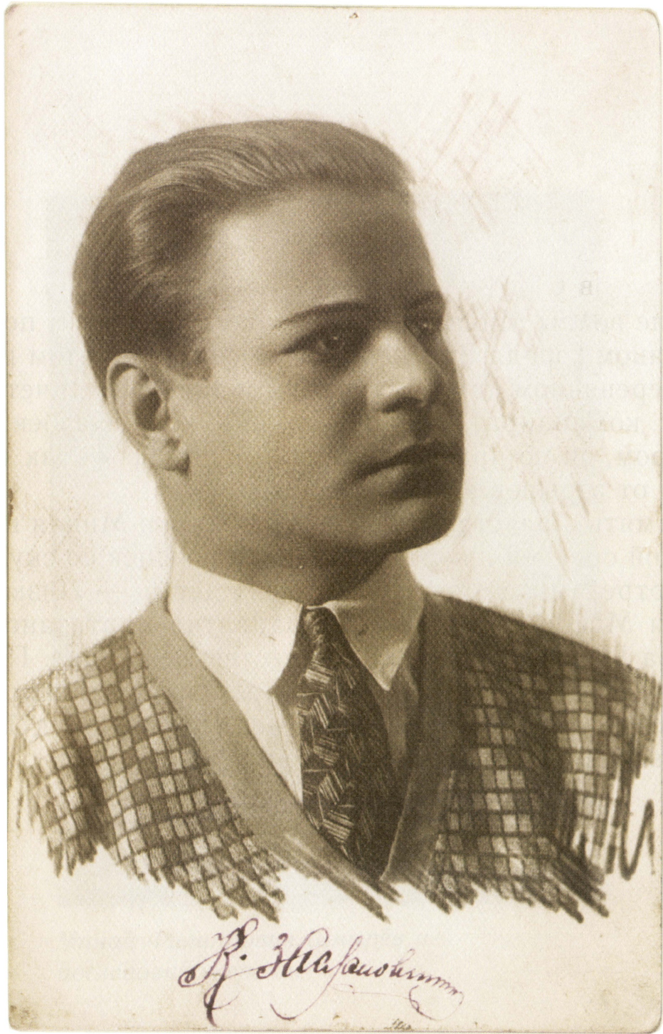
Константин Заслонов. Витебск, 1932 год.