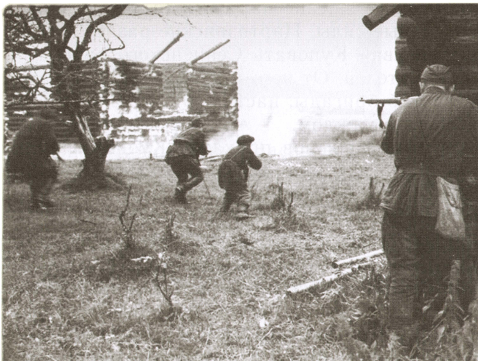
Бой партизан с оккупантами.