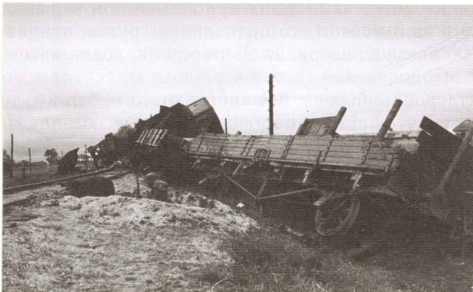
Подорванный партизанами вражеский железнодорожный состав.