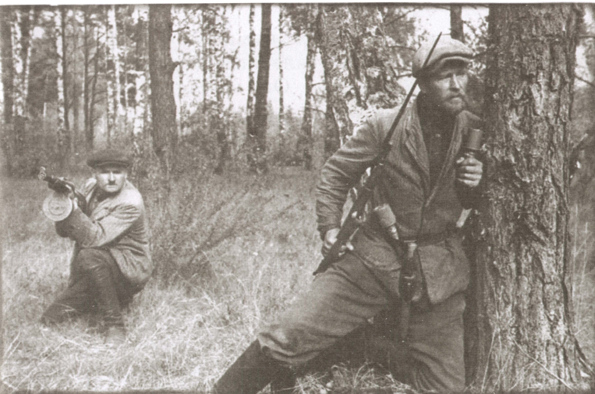
Народные мстители поджидают врага.

100 человек. Партизаны провели немало боёв, уничтожили несколько сотен гитлеровцев, 14 автомашин, 18 цистерн с горючим, 8 мостов. А 12 сентября 1941 года отряд стремительно ворвался в посёлок Сураж, где разгромил немецкий штаб и казарму.