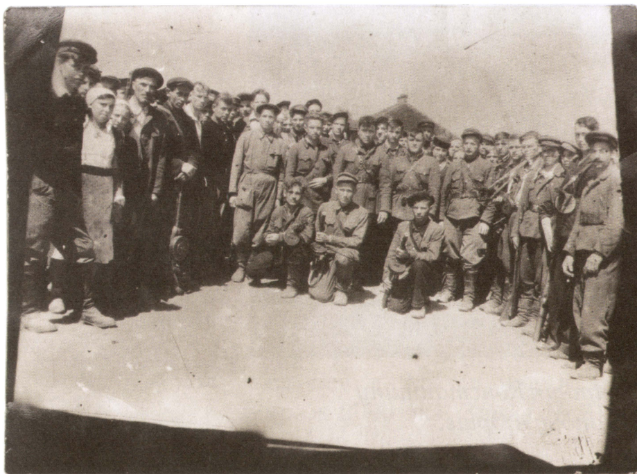
Отряд «Победа» партизанской бригады им. Заслонова. 1944 год.

Партизан в деревне было мало, всего около 25 человек, а фашистов на Куповат наступало в 20 раз больше. Они обрушили на защитников деревни ураганный огонь. Бой был жестоким и неравным. Уничтожив свыше 25 вражеских солдат и офицеров, партизаны отошли в лес. В бою героически погибли Заслонов и ещё 4 партизана. Их похоронили в братской могиле недалеко от Куповати.