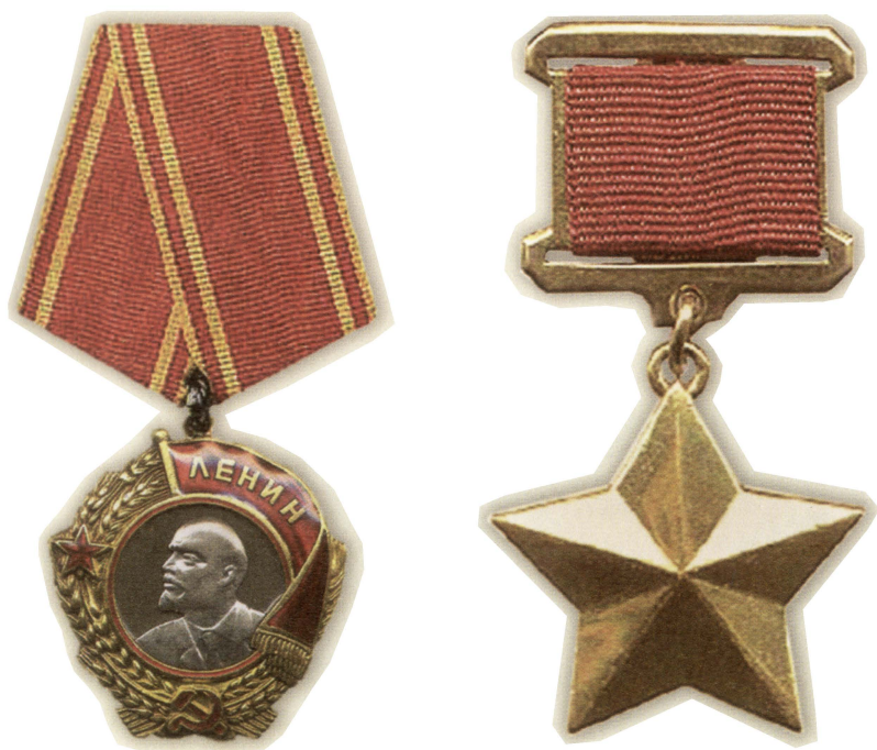
Орден Ленина и медаль «Золотая Звезда» Героя Советского Союза — высшие награды Родины.

Здесь же партизаны получали оружие. Суражские «ворота» действовали до конца сентября 1942 года.