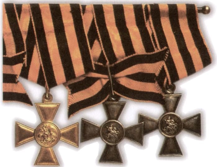
Георгиевские кресты – знаки солдатской доблести и отваги.