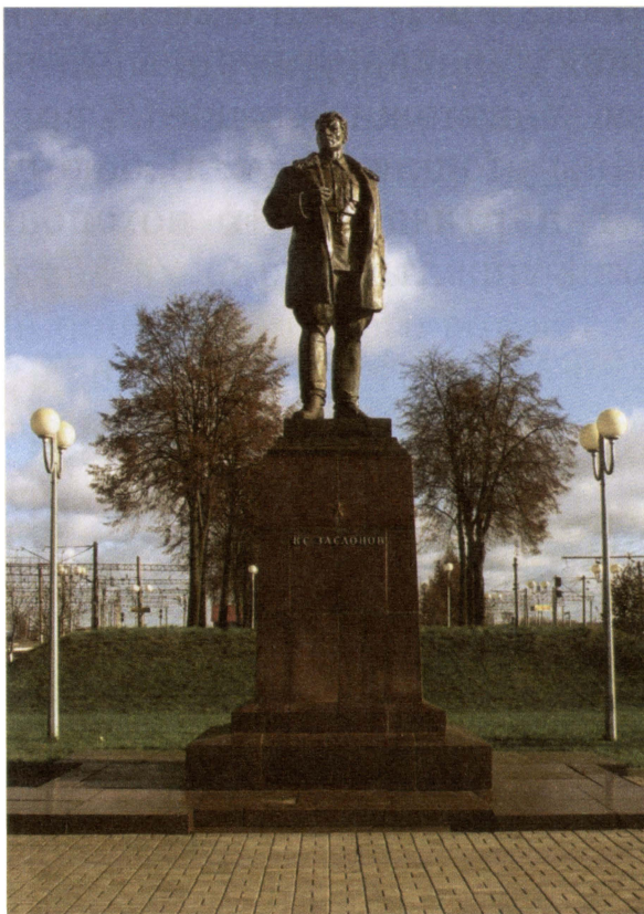
Памятник Константину Заслонову в Орше.