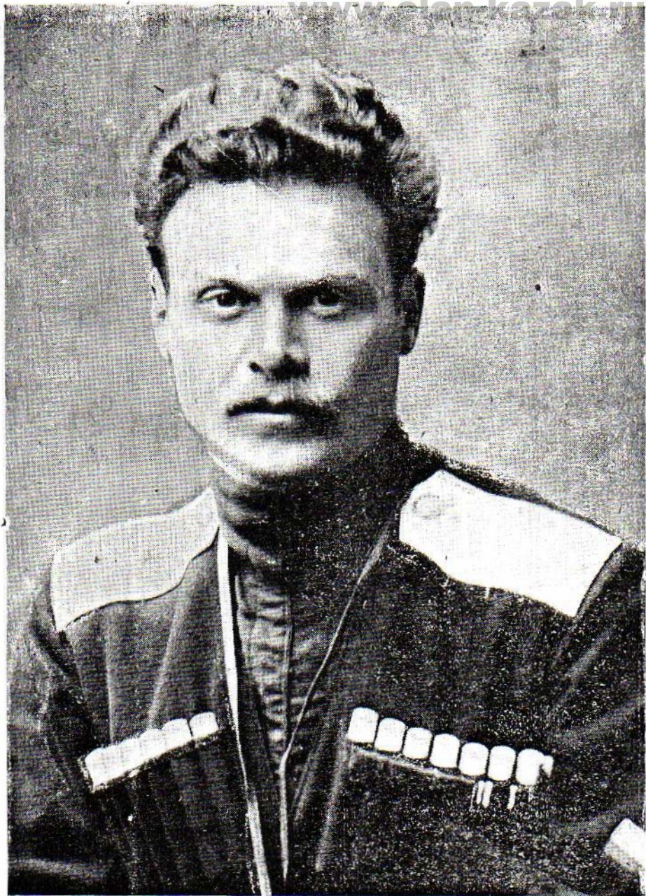
Генераль А. Г. ШКУРО.