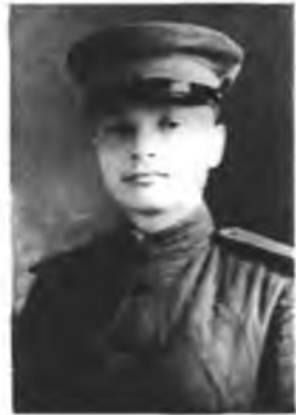
Курсант Свердловского пехотного училища 1943 г.