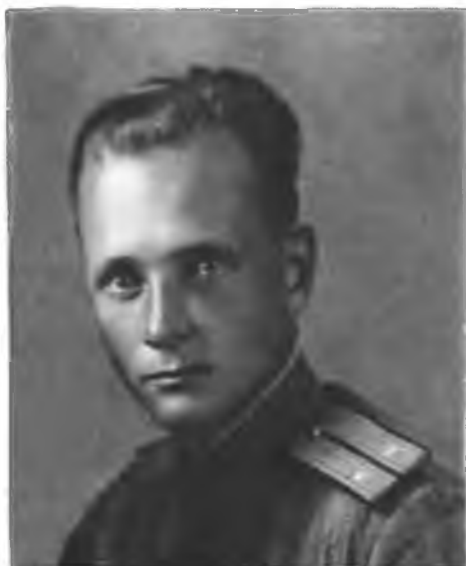
Покровская школа 1955 г.