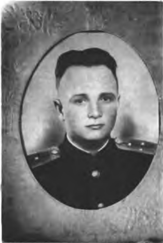
Старший лейтенант - помощник начальника штаба батальона 1955 г.