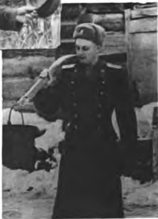
Последний отпуск. Февраль 1956 г.