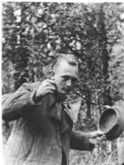
У Дасманова ключа. 1949 г.