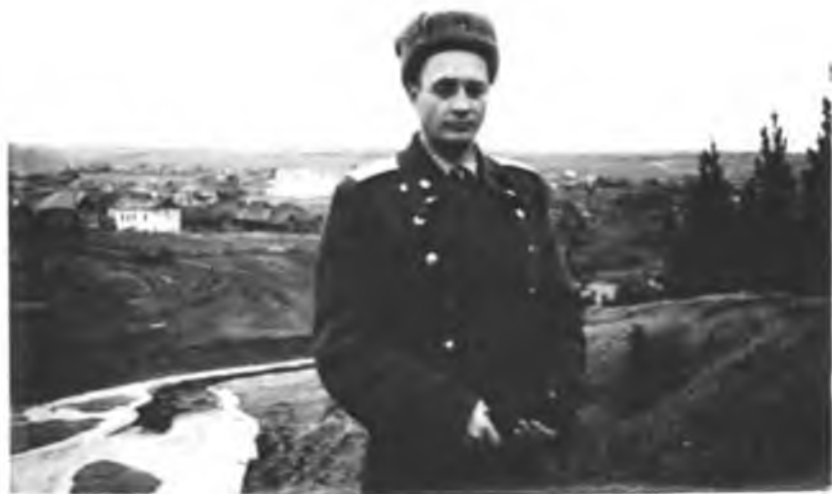
На родной земле... на родной Бобровке