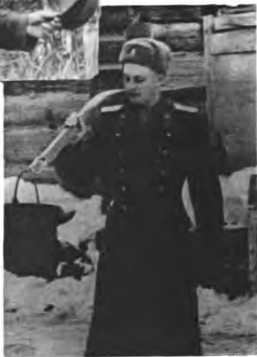
Последний отпуск. Февраль 1956 г.